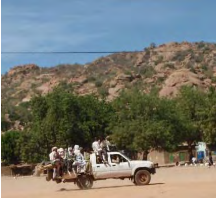
Photo 1.1 Un véhicule se rendant sur un marché hebdomadaire d'un village de Mongo

l'activité des 'coupeurs de routes', bandes armées au comportement souvent violent en raison notamment d'un fréquent usage de stupéfiants. 14