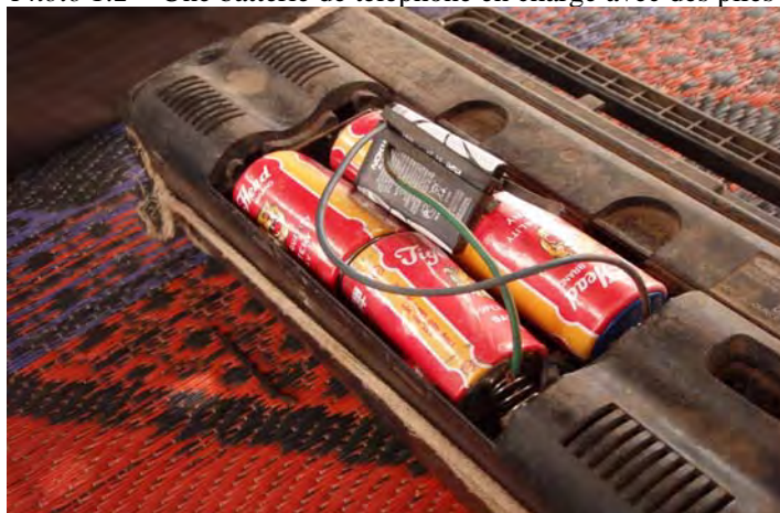
Photo 1.2 Une batterie de téléphone en charge avec des piles

dépôt de réseau limité et capricieux: Téléphones accrochés aux branches d'arbres ou aux toits des cases pour capter le réseau, charges des batteries avec des piles à défaut d'électricité et de générateurs.