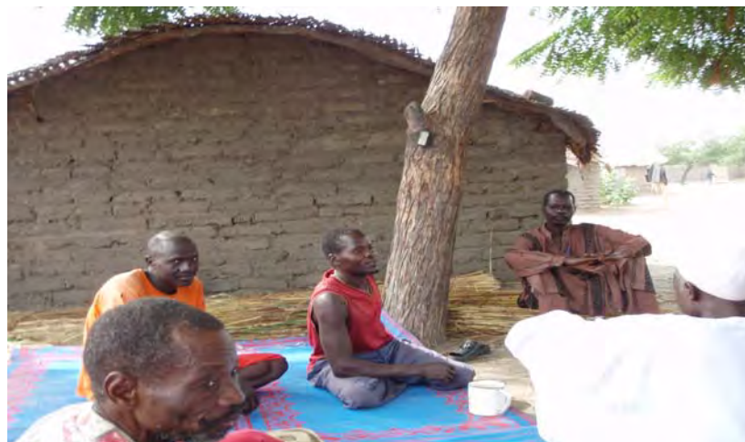
Photo 1.3 Une assemblée d'hommes attendant un appel téléphonique

toute la journée, les gens sont en état d'alerte: Les téléphones sont suspendus soit à un arbre, soit accrochés à une botte de paille. Durant toute la séance de causerie sous l'arbre à palabre, l'attention semble être plus portée à cet objet, comme c'est le cas de l'image ci-dessus.