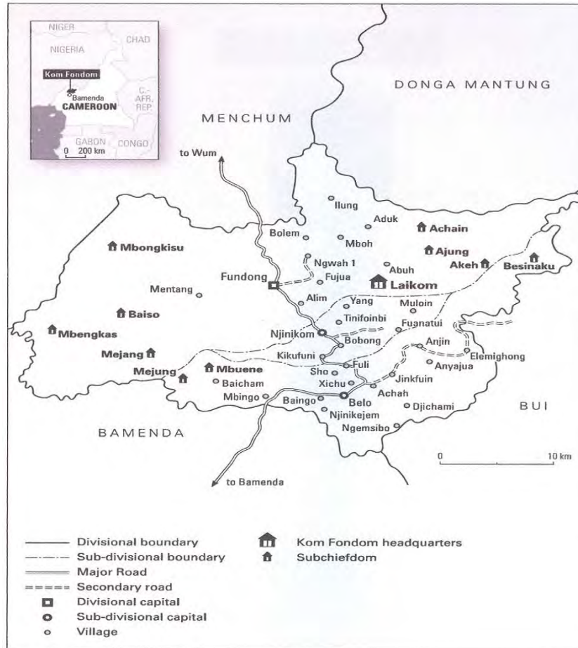
Map 6.2 Kom Fandom showing its neighbours, villages and sub-chiefdoms