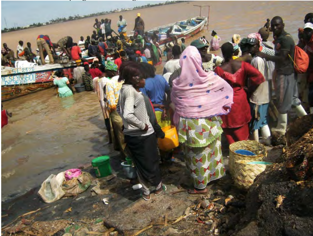
Photo 8.2 Return pirogue from fishing, St Louis