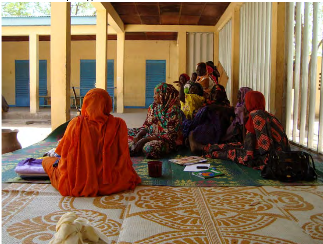
Photo 5.1 Le temps d'apprendre est arrivé