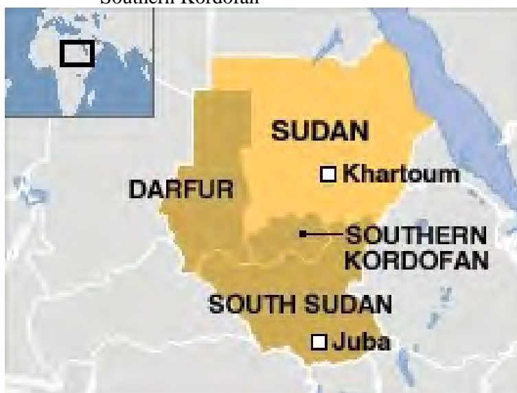
Map 9.1 Map of Sudan and South Sudan, showing Southern Kordofan

In contrast, the urban migrant youth that are the subject of this chapter come from one such ‘peripheral’ place that covers an area of approximately 250 km by 165 km (12°00’N and 30°45’E) to the southwest of Khartoum. Such a geographic location formulation is not the term of preference for the place now commonly known as the Nuba Mountains, al-jibaa al-nuba . In geo-political terms, the Nuba region is situated in the geographic centre of the country, politically incorpo-