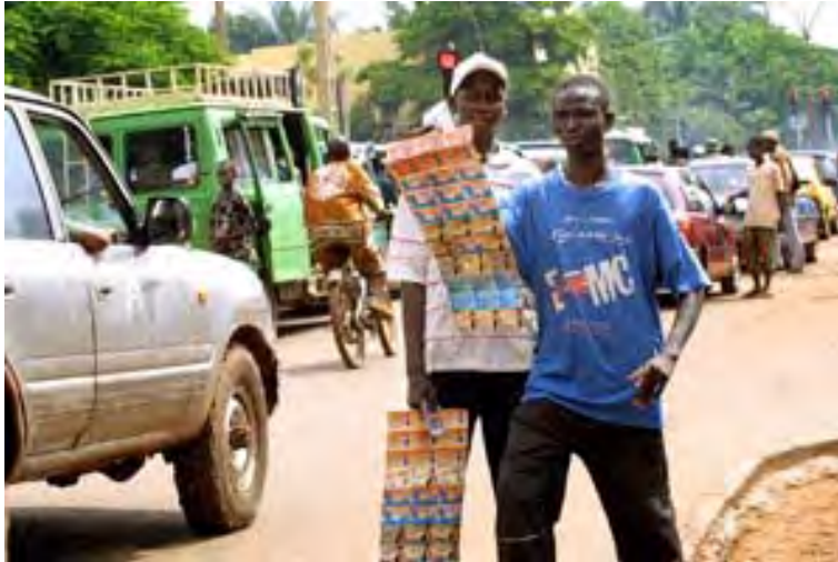
Photo 7.1 Si chaque société de téléphonie tient jalousement à ses produits et concepts l'espace public Bamakois est assez clairsemé de nombreux bricolages autour des usages de la téléphonie mobile. L'expression achevée de ces bricolages est la figure des vendeurs ambulants de cartes de recharger