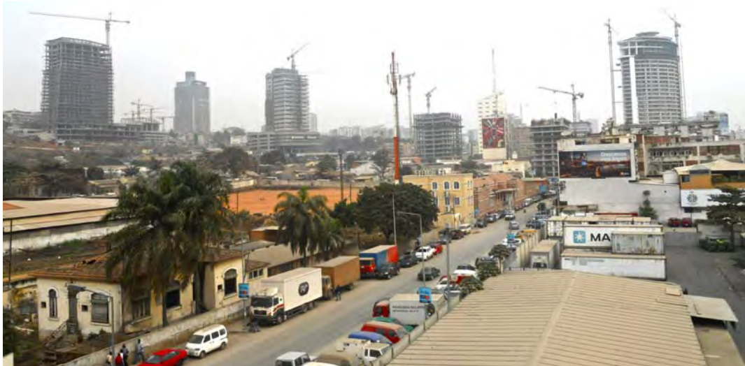
Photo 3.1 Luanda skyline in 2010

excited about returning to Luanda for the first time in ten years. When I asked him in earlier conversations about returning to a largely 'unknown' country, he was somewhat ambivalent: