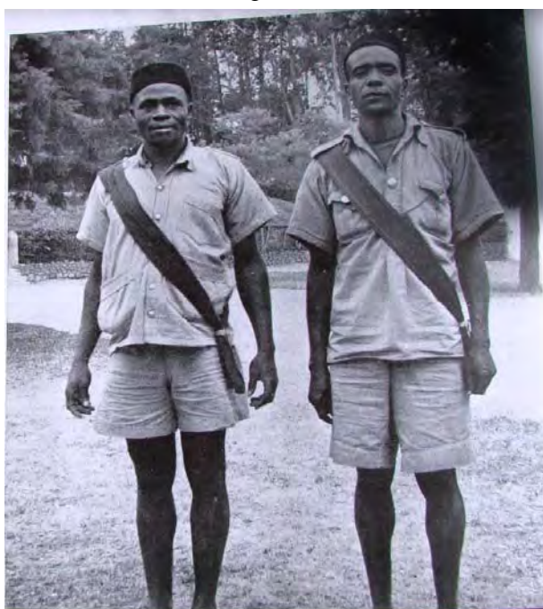
Photo 6.1 Two messengers in their official outfits