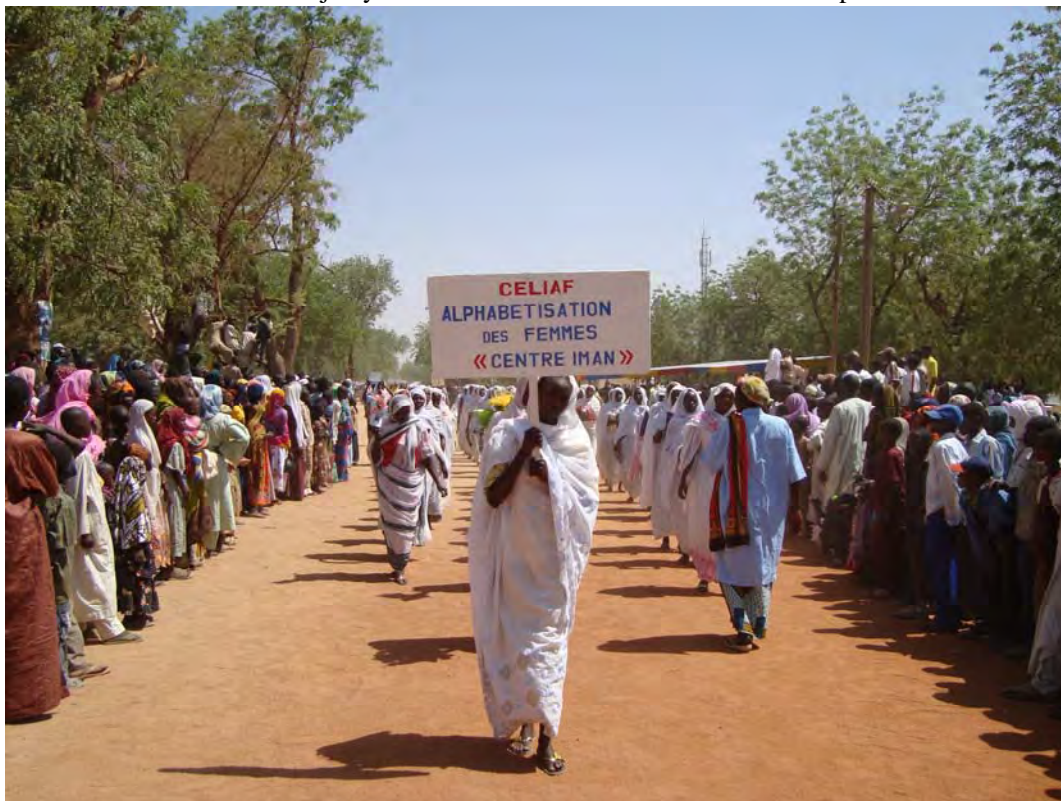
Photo 5.2 Les femmes hadjaraye ont décidé de faire face au défi de l'analphabétisme

liberté des structures féminines et de leurs membres. C'est ainsi que chaque association, chaque groupement a pris le soin de créer une composante alphabétisation au sein de son organisation pour former ses membres. A part la volonté de se libérer de la tutelle masculine, les motifs et pratiques d'alphabétisation observés varient largement selon les organisations. Les motifs vont de la simple possibilité accordée aux femmes d'apprendre à lire, à écrire et/ou à calculer, à la maîtrise des outils de gestion organique ou comptable de leurs organisations respectives.