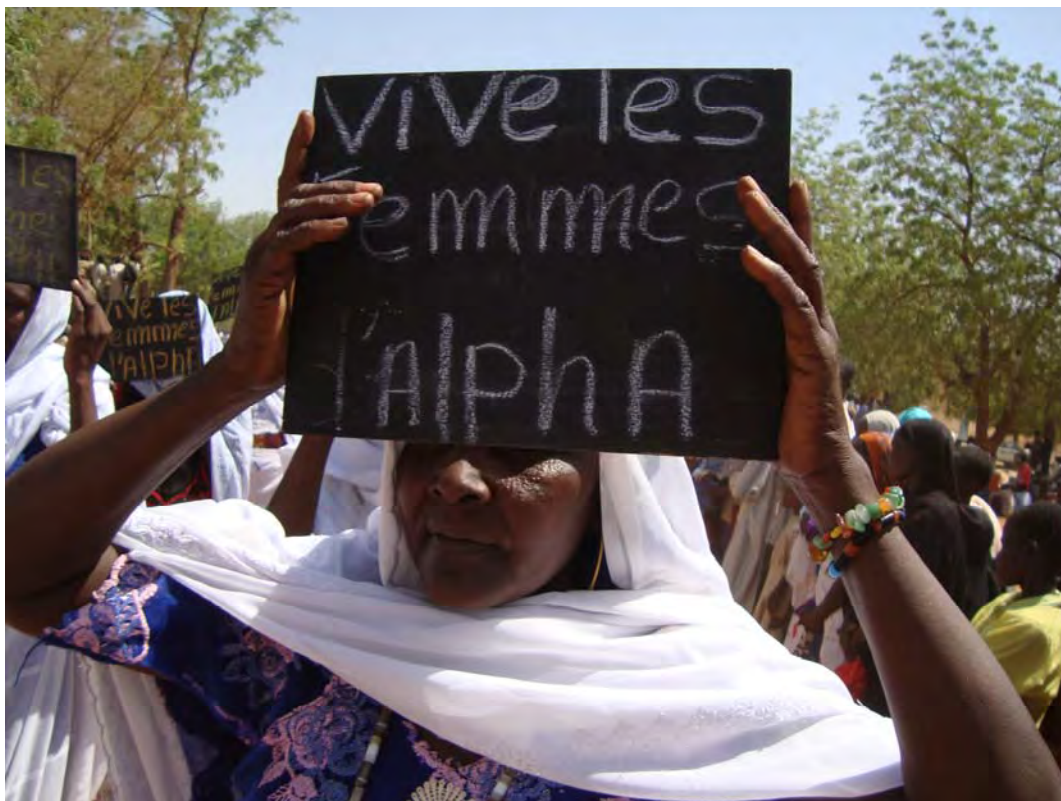
Photo 5.3 Les femmes hadjaraye se sont appropriées la technologie de savoir lire et écrire