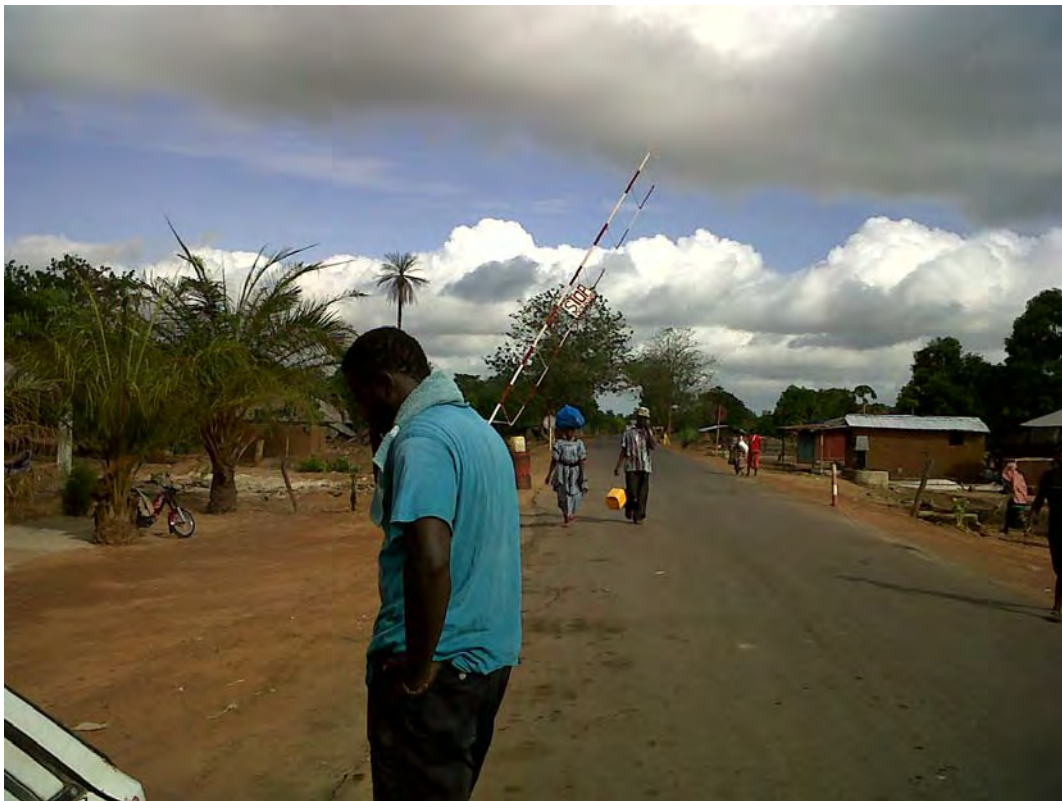
Photo 2.1 Un jeune homme se retire pour passer des coups de fil alors que la voiture qui le transportait est contrôlée par policiers au niveau de la frontière entre le Sénégal et la Guinée-Bissau (Mpack).

Pour une meilleure compréhension d'une telle stratégie, nous allons essayer de revenir sur la cause réelle et objective de la marginalité et la façon dont elle est perçue par les acteurs, avant de nous interroger sur certains développements lointains et récents liés aux possibilités qu'offrent les technologies de l'information et de la communication en termes de réduction de la marginalité.