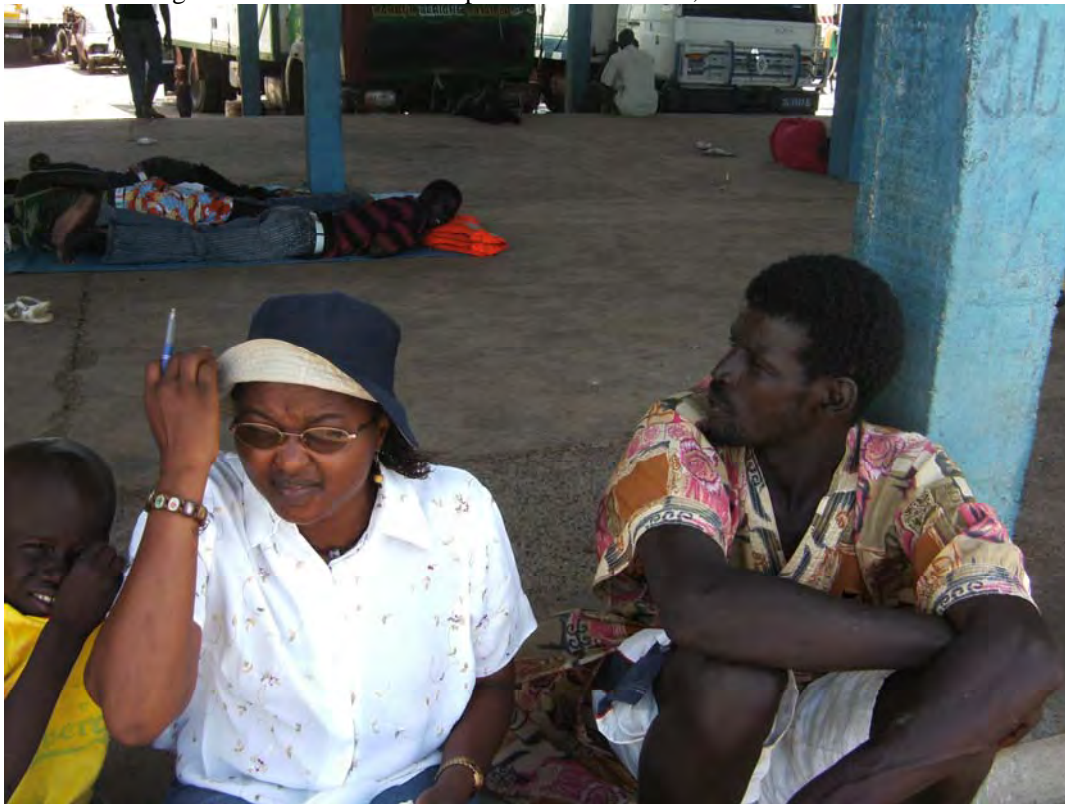
Photo 8.1 Migrant who returned from Spain due to ill health, St Louis

This connectivity is not limited to migrants and their family or to migrants' associations and their homeland but has also extended to the political arena. Through migrants' trans-connections, families at home are able to speed up or influence political decisions. When Moustapha and a host of other boat migrants were stranded in Morocco and news of their maltreatment reached their families, the latter were able to mobilize support on their behalf to get the government to facilitate their return home. According to Moustapha, some migrants had their