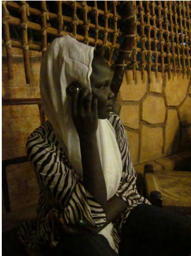
Photo 9.1 Nuba University student talking with people from the mountains

Nuba university students who have migrated to Khartoum are a marginalized group faced with the practical realities of participating in mainstream Sudanese life. On the one hand, they have a new urban consciousness where, when sitting in a lecture hall with hundreds of other students, one’s place of origin is less meaningful. On the other hand, as they make contact with the dominant culture,