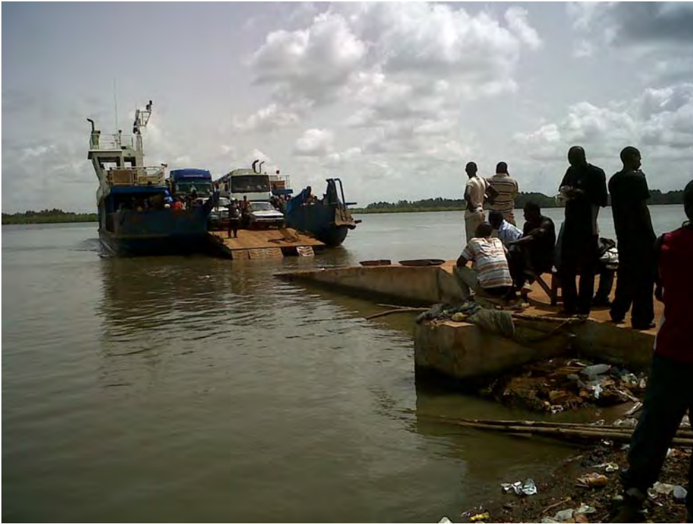
Photo 2.2 Des voyageurs quittant la Casamance pour se rendre dans d'autres régions du pays attendent des heures le bac à Farenni pour traverser le fleuve en territoire Gambien

tout simplement exercer une mobilité est davantage problématique pour les zones marginales comme la Casamance. Cette mobilité passe de plus en plus par le biais des infrastructures de communication et d'information.