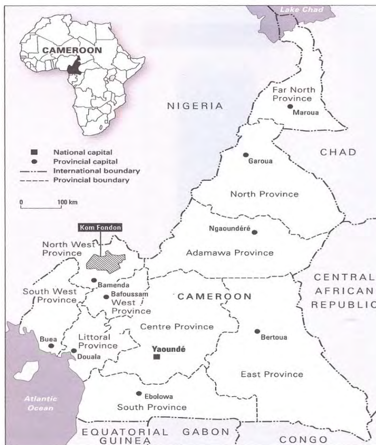
Map 6.1 Bamenda grassfields showing the location of Kom