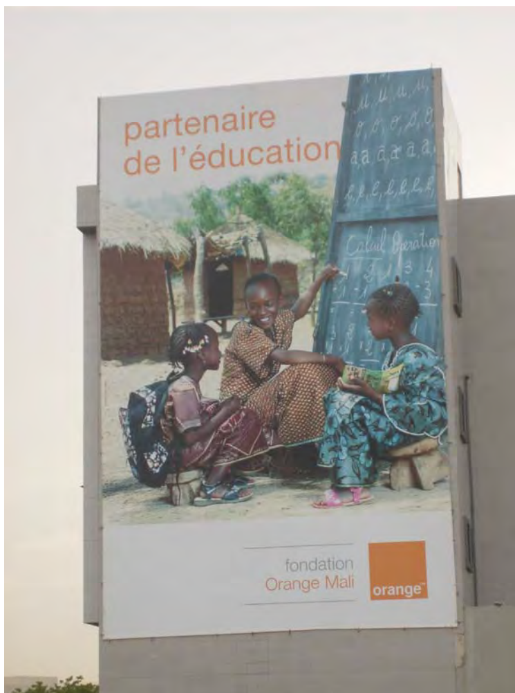
Photo 7.2 En investissant dans la publicité avec comme support des panneaux géants hissés sur le toit des maisons de particuliers en étage, Orange Mali exprime là une certaine forme de volonté de puissance ou d'expression de sa notoriété-proximité auprès des consommateurs.

Avant la participation de Maroc Télécom dans son capital, 9 la Sotelma employait directement 1 584 agents permanents, 122 stagiaires et générait indirectement près de 18 000 emplois à travers la gestion de 8 175 télécentres et cybercafés sur l'ensemble du territoire national. Aujourd'hui, l'effectif des employés a diminué de 35% par rapport à l'année 2008. 10