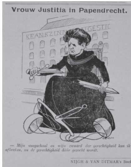
Afb. 1: Orion, 'Vrouw Justitia in Papendrecht', Uilenspiegel 44 (1910) Regionaal Archief Dordrecht, inventarisnummer 551_10614.

Een ander thema binnen deze categorie is het psychiatrisch jargon en richt zich sterker tegen de expertise van de psychiater. Allereerst is daar de nogal flauwe grap van Hahn in De Notenkraaker , waarin een boer een psychiater met een enorm voorhoofd vraagt of hij uit het westen komt. Wanneer de psychiater vraagt waarom de landarbeider dit wil weten, antwoordt deze: 'de wijzen kwamen uit het Oosten.' 32 Interessanter is het wanneer de tekenaars de termen van de psychiater toe-eigenen, zoals in de tekening van Jordaan op dezelfde pagina als Hahns flauwe mopje. Jordaan portretteert een sterke arbeider die zich afvraagt of zijn baas geen 'querulantenwaan' heeft, omdat hij altijd wat te zeggen had over zijn werk. 33 In dit geval wordt de psychiatrische opvatting van querulantenwaan overgenomen, maar wordt een normale arbeider gepositioneerd als de bezitter van deze gezaghebbende kennis. 34 In dit geval wordt psychiatrische kennis toegeëigend om de