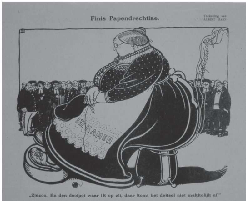
Afb 3: A. Hahn, 'Finis Papendrechtiae', De Notenkraaker 6 (1911) Regionaal Archief Dordrecht, inventarisnummer 551_10618.