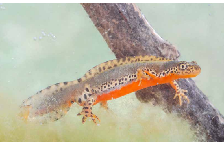
Een Mesotriton veluchiensis uit de Peloponnesos, Griekenland.

Wouter Beukema, RAVON & Ben Wielstra, Instituut Biologie Leiden, Universiteit Leiden & Naturalis Biodiversity Center