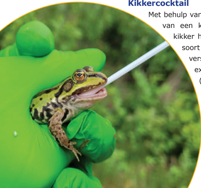
Figuur 1. Afnemen van wat wangslim met een swab, zodat via DNA de identiteit van de kikker bepaald kan worden.

Met behulp van de techniek 'DNA-barcoding' is heel precies de lettervolgorde van een klein maar variabel stukje DNA afgelezen. Door voor elke kikker het DNA-profiel vast te stellen, kon bepaald worden tot welke soort elke individuele kikker behoort en waar in het natuurlijk verspreidingsgebied deze oorspronkelijk vandaan komt. De exotische meerkickers komen uit vier heel verschillende streken: (1) Centraal- en Oost-Europa; (2) De Balkan; (3) Noord-Turkije, of zelfs verder oostelijk en (4) Zuid-Turkije. De bevindingen passen in het grotere plaatje van meerkikkerintroducties in West-Europa. Er is hier een mengmoes aan meerkikkerlijnen geïntroduceerd. Sommige zijn zó verschillend, dat ze vaak als