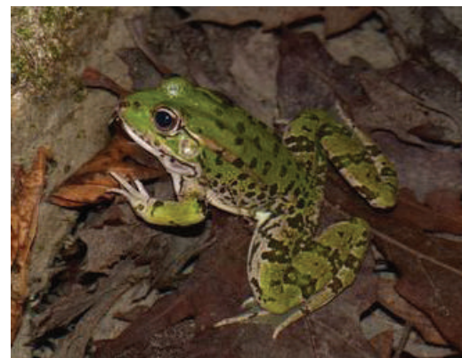
Figuur 3. Meerkikker ( Pelophylax (ridibundus) kurtmuelleri ) in Lefkas, Griekenland.

Wetenschappers en beleidsmakers pleiten al langer om de import van levende meerkikkers aan banden te leggen of in ieder geval beter te reguleren. Onlangs zijn de meerkikker en de poelkikker op CITES bijlage II geplaatst met als doel de internationale handel in met name kikkerbillen te reguleren. Nu de omvang van de meerkikkerinvasie in Nederland in kaart is gebracht, is het van belang om de impact te bestuderen en mitigatiestrategieën te formuleren. Hoe krijgen we exotische meerkikkers onder controle?