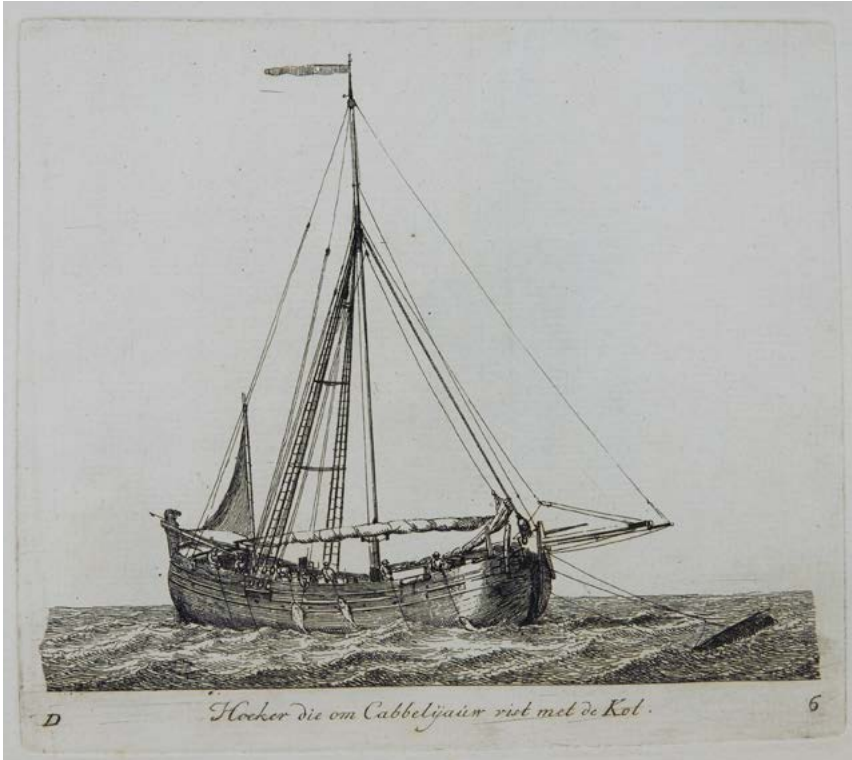
'Hoeker die om Cabbelijauw vist met de Kol'. Uit: Gerrit Groenewegen, Verzameling van vier en tachtig stuks Hollandsche schepen (Rotterdam 1789).

de hand op en neer bewogen totdat de vis toehapte. Zierikzeese leveranciers zorgden voor alle benodigdheden voor de visvangst: kollijnen, haken ('doghoeken'), messen om de vis schoon te maken ('doggemessen'), stenen om de vis op te snijden ('kaakstenen'), een kollenbak om de lijnen op te bergen, vis- en speelmanden.