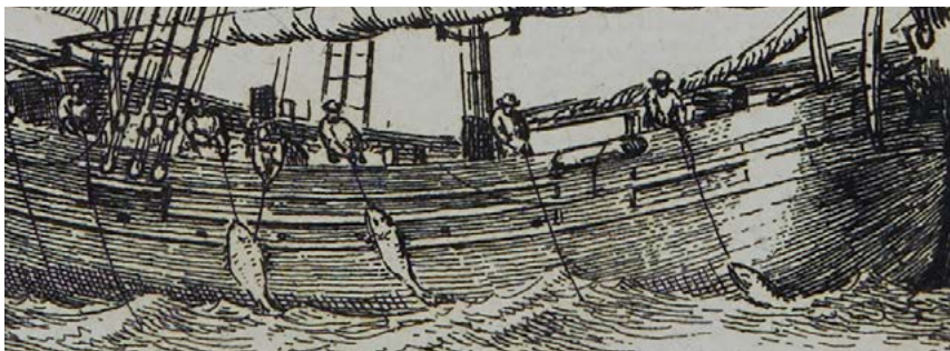
Vijf bemanningsleden vissend met de kol. Fragment van: 'Hoeker die om Cabellijauw vist met de Kol'. Uit: Gerrit Groenewegen, Verzameling van vier en tachtig stuks Hollandsche schepen (Rotterdam 1789). MARITIEM MUSEUM ROTTERDAM

Zierikzeese vissers voor de eerste vangst gebruikten is niet bekend. Wellicht gebruikten ze iets van het eigen proviand. 54