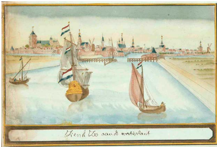
Gezicht op Zierikzee aan de landzijde en aan de waterkant. Tekening door Andries Schoemaker, c. 1710–1730. DEN HAAG, KONINKLIJKE BIBLIOTHEEK