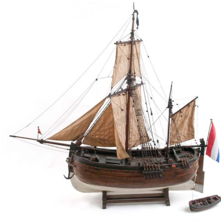
Scheepsmodel van een koopvaardijhoeker, vervaardigd door Pieter Ossewaarde, c. 1750–1770.