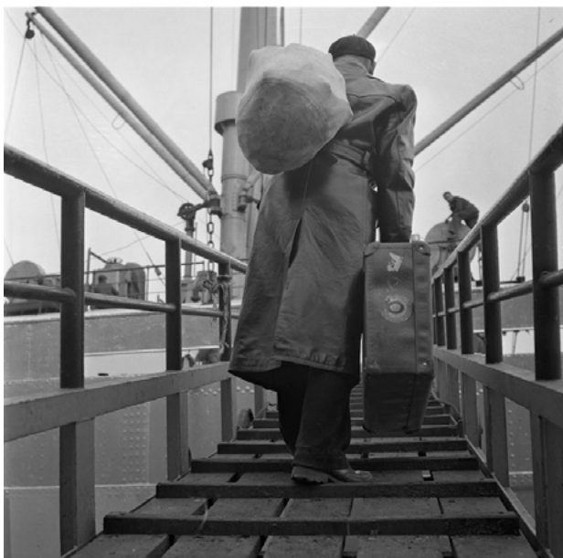
Een zeeman gaat aan boord van een schip in de haven van Rotterdam, 1957.