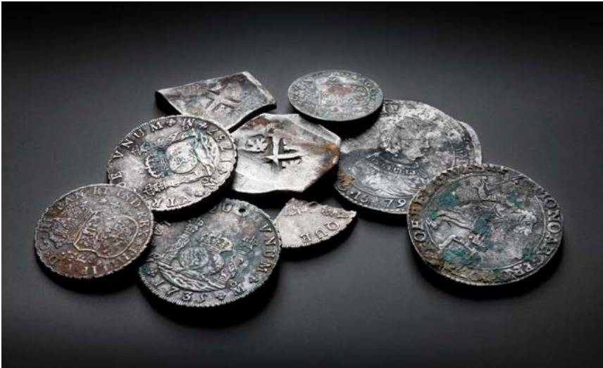
Zilveren munten uit het voc-schip Rooswijk . Smokkelgeld is soms te herkennen aan een gaatje in de munt om in de kleding vast te naaien.

koopwaren. Een lening van 1.000 gulden wijst echter eerder op uitlening van contant geld als belegging. Het was overigens niet ongebruikelijk dat kooplieden geld uitleenden als belegging. 38