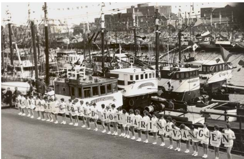
Tijdens een declamatorium op Vlaggetjesdag 1961 in IJmuiden doen leden van de christelijke gymnastiekvereniging 'IJmuiden' ritmische oefeningen, geïnspireerd op de visserij.