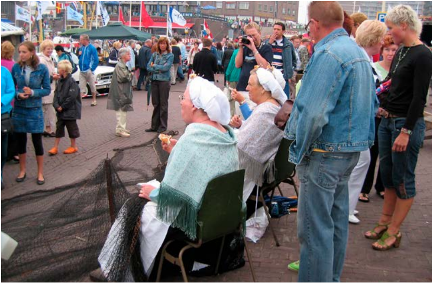
Vlaggetjesdag Scheveningen aan het begin van de eenentwintigste eeuw. Twee vrouwen in traditionele Scheveningse klederdracht pauzeren tijdens hun demonstratie nettenboeten.

en sterke concurrentie vanuit andere Europese landen stelden de reders voor uitdagingen. Door berichten over de haringworm (nematode) die in groene haring (lichtgezouten haring) zou zitten en buikpijn kon veroorzaken, moest de vers gevangen haring minstens drie dagen in de pekel staan voordat ze kon worden afgeslagen. Het nieuws zorgde voor een afname van de verkoop en het verdwijnen van de haringrace. Bij de haringrace ging het immers om het zo snel mogelijk aan wal brengen van de groene haring. De aanbevolen vriesmethode was een doeltreffend procedé om haring te conserveren. Het zorgde wel voor een duurder product. 11