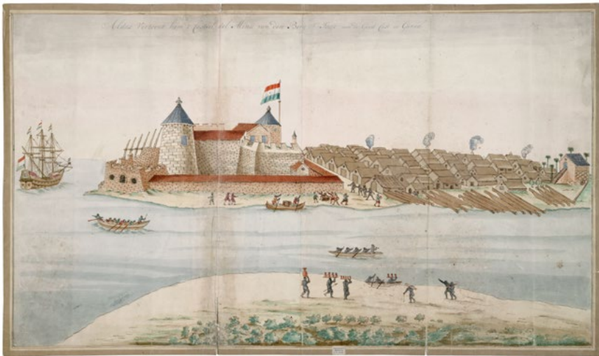
Fort Elmina aan de Goudkust. Tekening vervaardigd door de firma Van Keulen in Amsterdam, eerste helft achttiende eeuw. DEN HAAG, NATIONAAL ARCHIEF.

De afgelopen decennia is veelvuldig onderzoek verricht naar de bouw van schepen in de Republiek der Verenigde Nederlanden. De Nederlandse scheepsbouw maakte immers de overzeese macht en maritieme expansie van de Republiek mogelijk. 1 Hoewel er veel gepubliceerd is over Nederlandse scheepvaart en handel, is er weinig bekend over Nederlandse scheepsbouwactiviteiten in overzeese gebieden, zoals West-Afrika. Door verschillende wetenschappers is onderzoek gedaan naar de Nederlandse kusthandel in West-Afrika en naar de aanwerving en tewerkstelling van personeel van Europese en Afrikaanse afkomst bij de handel- en verdedigingswerkzaamheden. 2 Weinig onderzoek is echter verricht naar de bouw-, onderhouds-, en reparatiewerk-