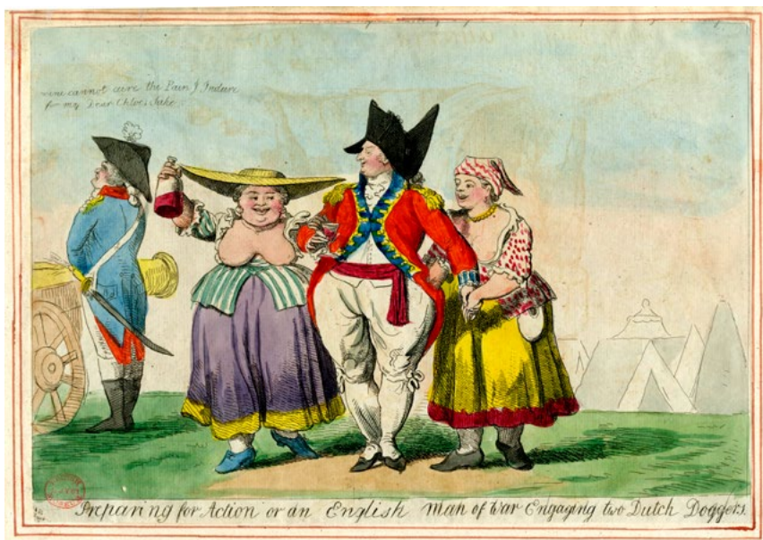
'Preparing for action, or an English man of war engaging two Dutch doggers'. Het 'doggers' verwijst naar de Slag bij de Doggersbank (1781), maar betekent in deze context eigenlijk 'sletten'. Spotprent door Isaac Cruikshank, 1793.

Iets wat vrijwel alle politieke commentatoren benadrukten was de symbiotische relatie tussen het economische succes enerzijds en de Royal Navy anderzijds. De economie genereerde de financiële basis onder de enorme vloot en marine-organisatie, terwijl de oorlogsschepen steeds nadrukkelijker wereldwijd Britse handelslijnen en koloniale aanwezigheid beschermden. Voor veel van hen vormde deze symbiotische verhouding zelfs de ruggengraat van de Britse staat en het Empire . Of de schrijvers hun lezerspubliek het idee van het eminente belang van de marine wisten op te dringen of dat zij hiermee juist handig anticipeerden op het reeds bestaande politieke referentiekader van hun klanten is voor de historicus niet na te gaan; waarschijnlijk was er sprake van tweerichtingsverkeer. Duidelijk is evenwel dat de wisselwerking tussen auteurs en lezers in belangrijke mate bijdroeg aan het ontstaan van een collectieve identificatie met de vloot. Met andere woorden: het voortdurend herbevestigen in politieke en economische analyses van het belang van de vloot zorgde ervoor dat deze als kernonderdeel van de Britse identiteit werd beschouwd. Dit zorgde er vervolgens voor dat bijvoorbeeld in het Parlement, waar uiteindelijk de sleutels van de schatkist lagen, nooit serieuze weerstand ontstond tegen het enorme beslag dat de Navy legde op de financiële middelen van de staat. 24