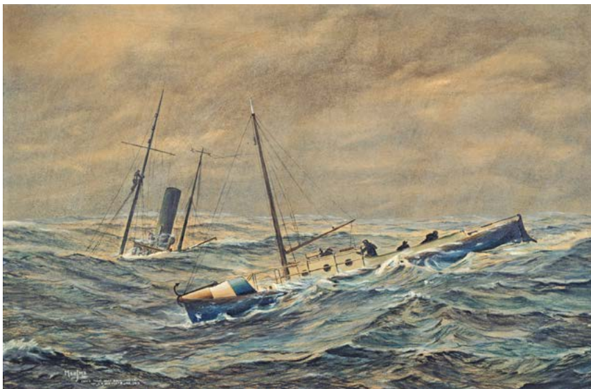
Motorreddingboot C.A. den Tex op Borkumer Rif. Krijttekening door Durk Monsma (1910–1992) naar een schilderij van E.M. Eden. BRUIKLEEN KNRM, IN DEPOT REDDINGMUSEUM DEN HELDER

na dertig uur nog een opvarende uit een bovenwaterstekende mast te redden. Later ontvingen zij van keizer Wilhelm II een onderscheiding hiervoor. Voor de marinemannen van het neutrale Nederland was dit een pikante gebeurtenis.