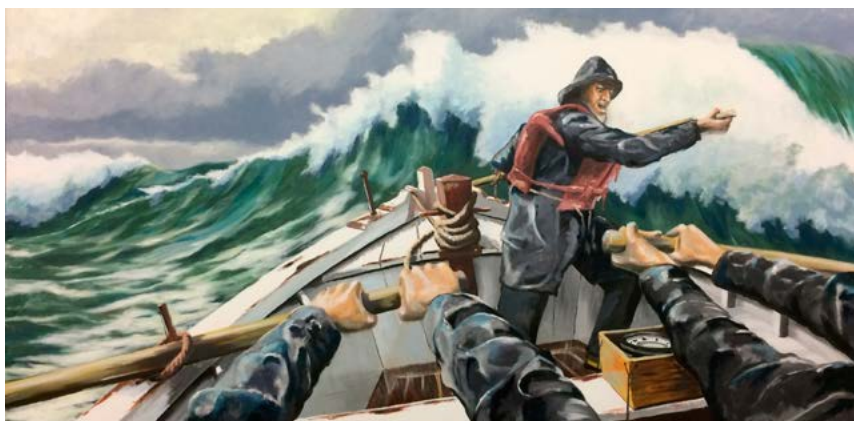
Zwijgend en zweogend aan de riemen. Olieverf op doek door Kees Brinkman, 2014. PRIVÉBEZIT KUNSTENAAR

niet ongebruikelijk dat de loodscommissarissen loodsen leverden als bemanning voor de reddingboot indien er onvoldoende vrijwilligers waren. Vooral de ZHMRS maakte van deze mogelijkheid gebruik. En het Loodswezen zorgde voor waarschuwing van de reddingboot. De vuurtorenwachters moesten uitkijken naar schepen in nood. Deze kustwachttak, ingesteld in 1886 nadat reders met een voorstel hiervoor kwamen 4 , was essentieel voor de inzet van de reddingboten. Het ontlastte de reddingmaatschappijen, want die konden zich een continue bezetting van uitkijkposten niet permitteren. Tevens investeerde de overheid aan het einde van de negentiende eeuw in telegraaf- en telefoonlijnen van de uitkijkposten naar de reddingstations. Een investering die de draagkracht van de reddingmaatschappijen ruim te boven ging.