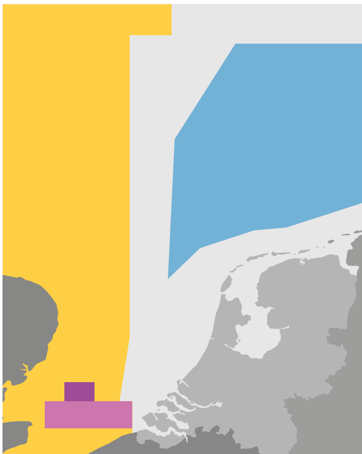
Figuur 2. Scheepvaartroute na 1 februari 1917. 20

pen van neutrale landen en die van de tegenstander was een gevolg van het misbruik van een neutrale vlag door Engelse schepen. Vanaf dat moment was Rotterdam nog alleen bereikbaar via een vaargeul uit het noorden. Het loodswezen markeerde die geul met lichtschepen en -boeien. 19