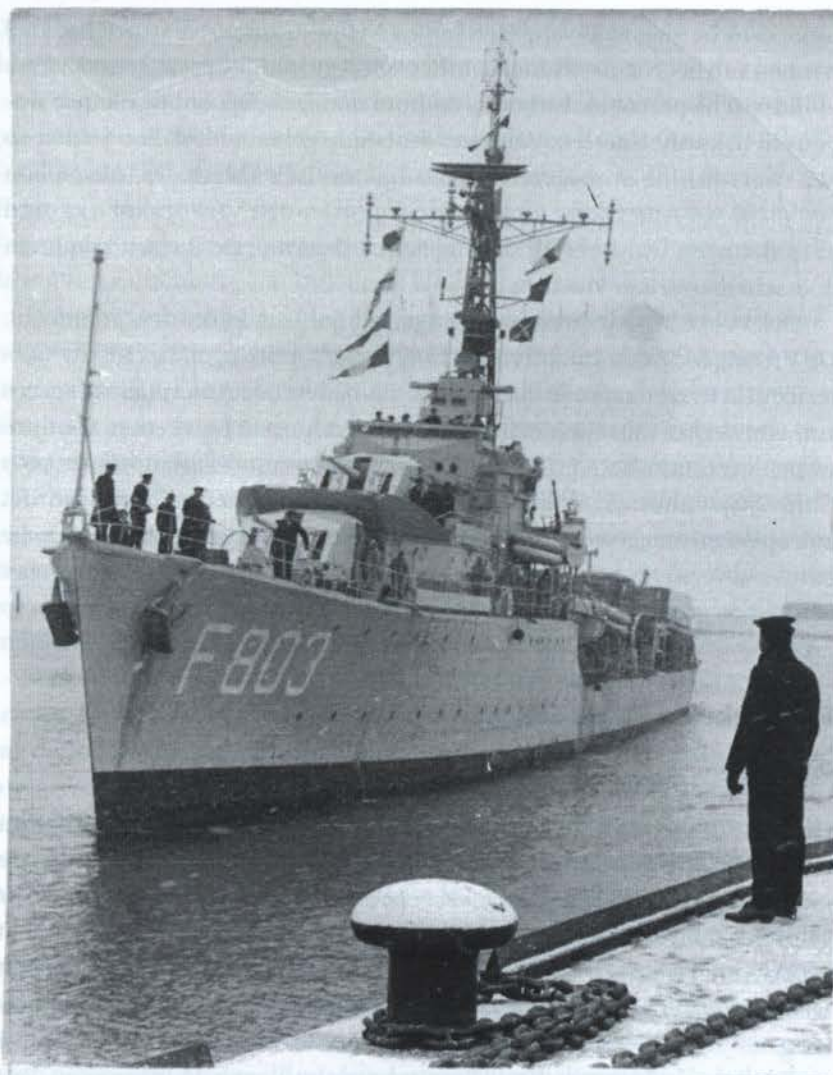
Aankomst van Hr.Ms. Evertsen (1945-1963) vanuit Nederlands Nieuw-Guinea in de haven van Den Helder op 22 november 1962