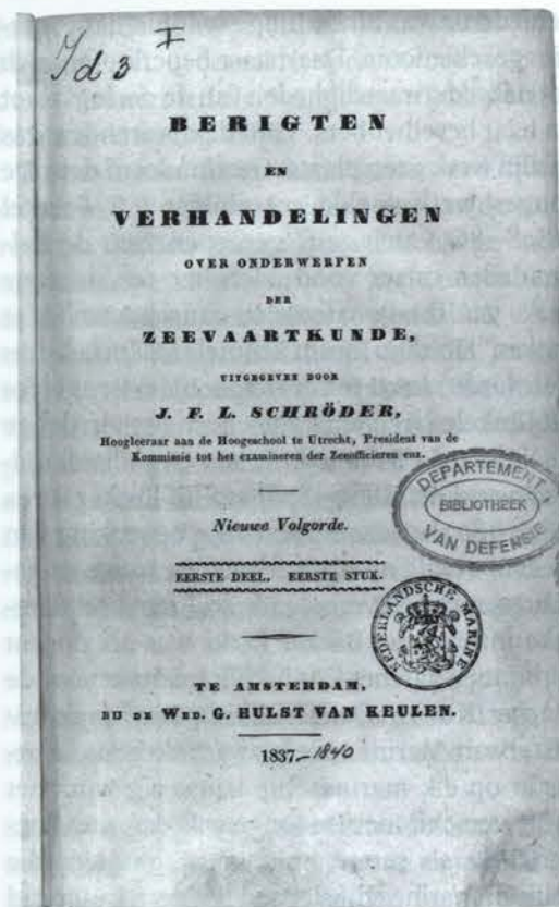
Afb. 2. Titelpagina van de Berigten en verhandelingen over onderwerpen der Zeevaartkunde uit 1837.

Op 10 maart 1883 werd de Vereniging tot behandeling van op de Zeemacht betrekking hebbende onderwerpen opgericht, waar uiteindelijk de Koninklijke Vereniging voor Marineofficieren (KVMO) uit ontstond. Aanleidingen voor de oprichting waren de verschijning van een brochure van kapitein-ter-zee J.W. Binkes als reactie op de ondergang van Zr.Ms. rammonitor Adder op 5 juli 1882 voor de kust van Scheveningen, de daaruit voortvloeiende kritiek op de Koninklijke Marine en de behoefte bij marineofficieren om Binkes' opvattingen in eigen kring te bespreken. Ruim drie jaar later bracht de vereniging het Marineblad , Bijblad op de verslagen van de Marine-Vereniging uit. In het