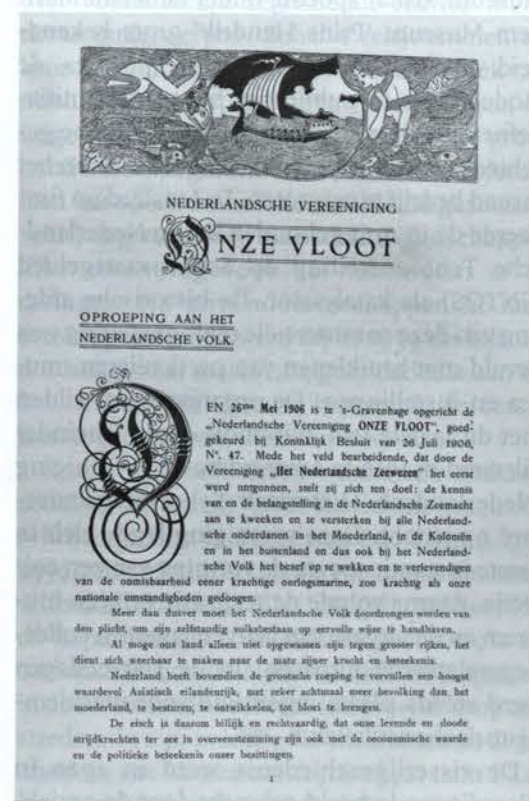
Afb. 3. Wervingsfolder van de 'Nederlandsche Vereniging Onze Vloot' uit 1906.

Gelijktijdig met de oprichting van de bovengenoemde verenigingen werden – vaak door