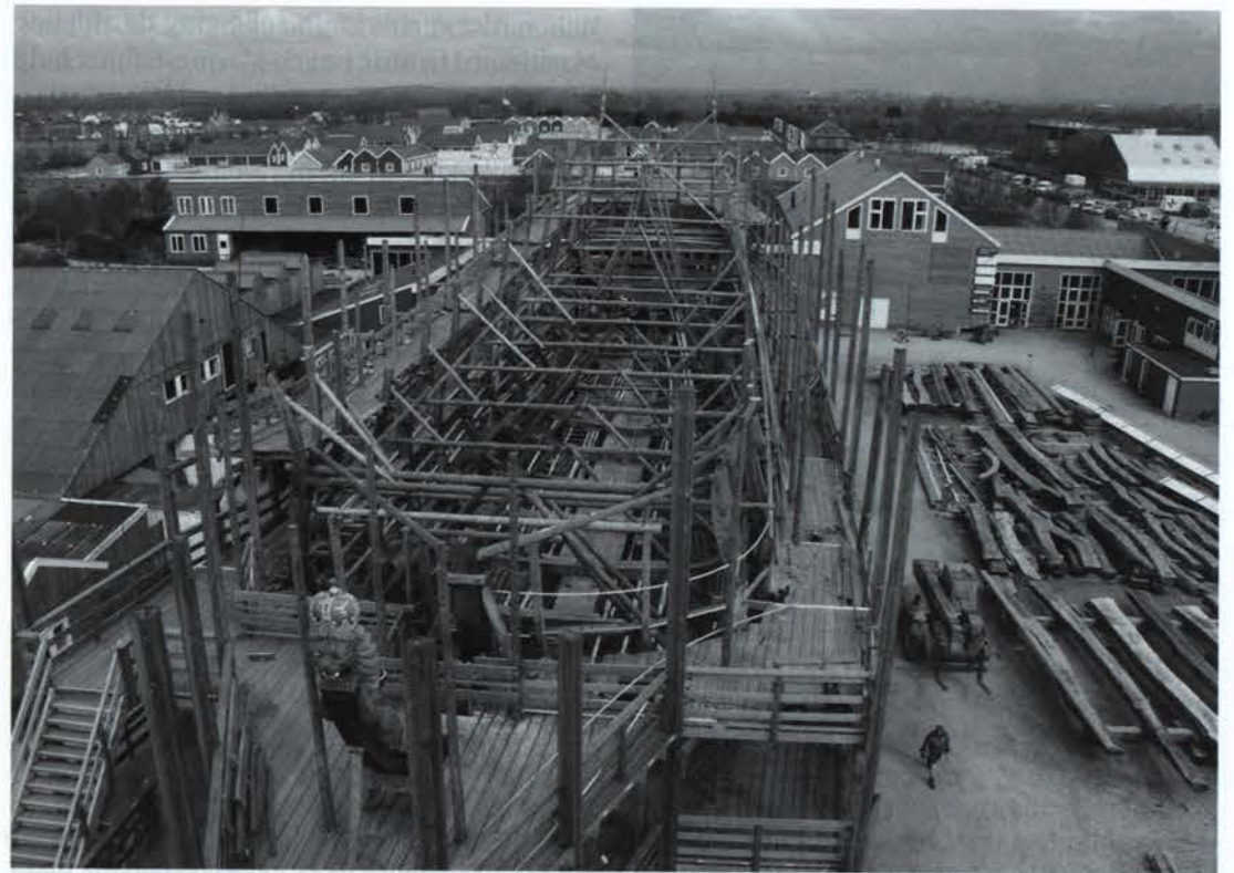
Afb. 4. Bouw van de replica van De Zeven Provinciën, het vlaggenschip van admiraal De Ruyter, op de Bataviawerf te Lelystad.

Naast de zeehistorische kern in Leiden ontstond in 1970 in Groningen het aan de Rijksuniversiteit in die stad verbonden Arctisch Cen-