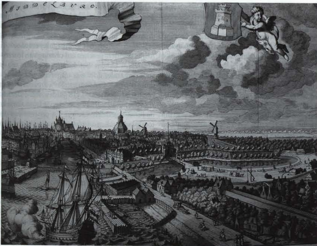
Middelburg. Kopergravure uit: Cronyk van Zeeland van Mattheus Smallegange. Middelburg 1696. (Particuliere collectie)