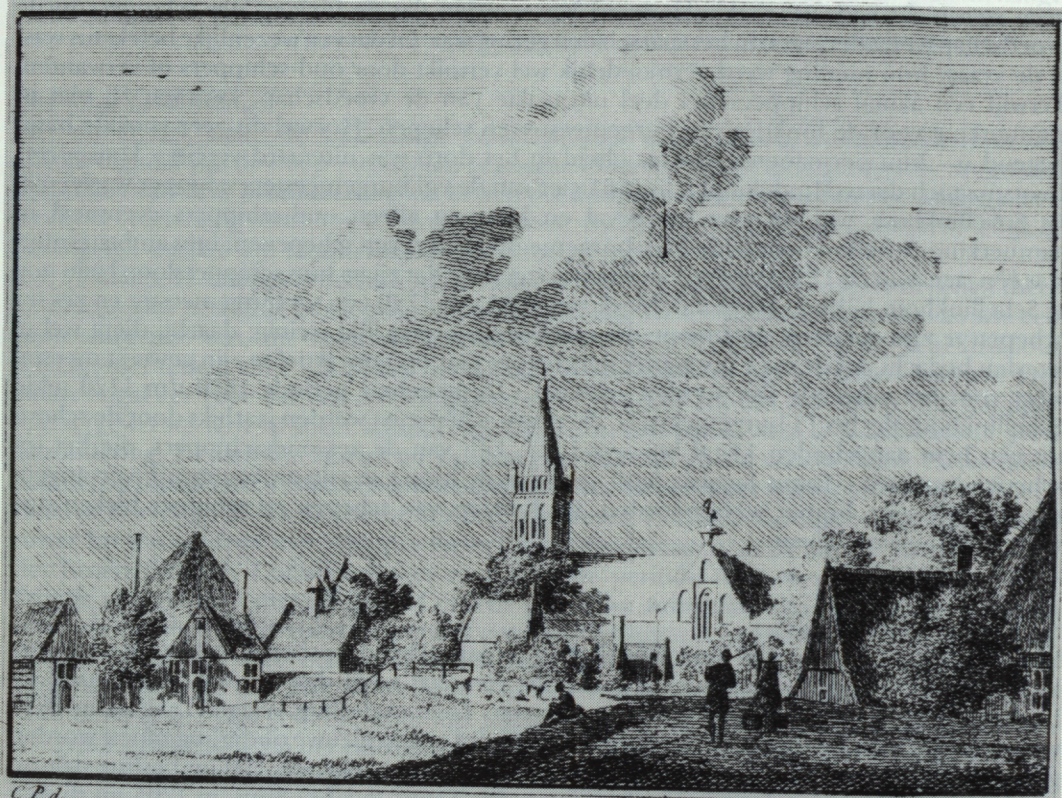
De STEDE SCHELLINKHOUT. 1726.

De beschikbare gegevens zijn dus voornamelijk tot de hervormde gemeente beperkt. Deze kende een tweetal ambten: dat van ouderling (naast de predikant belast met het opzicht over de gemeente) en dat van diaken (belast met de armenzorg). Aangezien er voor het opzicht bij voorkeur oudere gemeenteleden in aanmerking kwamen, kunnen we in dit ambt bijvoorbeeld ook schippers 'in ruste' verwachten. Van de 17 daarvoor in aanmerking komende personen (zie schippers en dorpsbestuur) werden er vijf inderdaad één of meerdere keren tot ouderling gekozen. Slechts éénmaal werd een (oud)-schipper tot diaken verkoren: de hierboven reeds genoemde Tamis Jacobsz Smit, die echter spoedig weer moest bedanken.