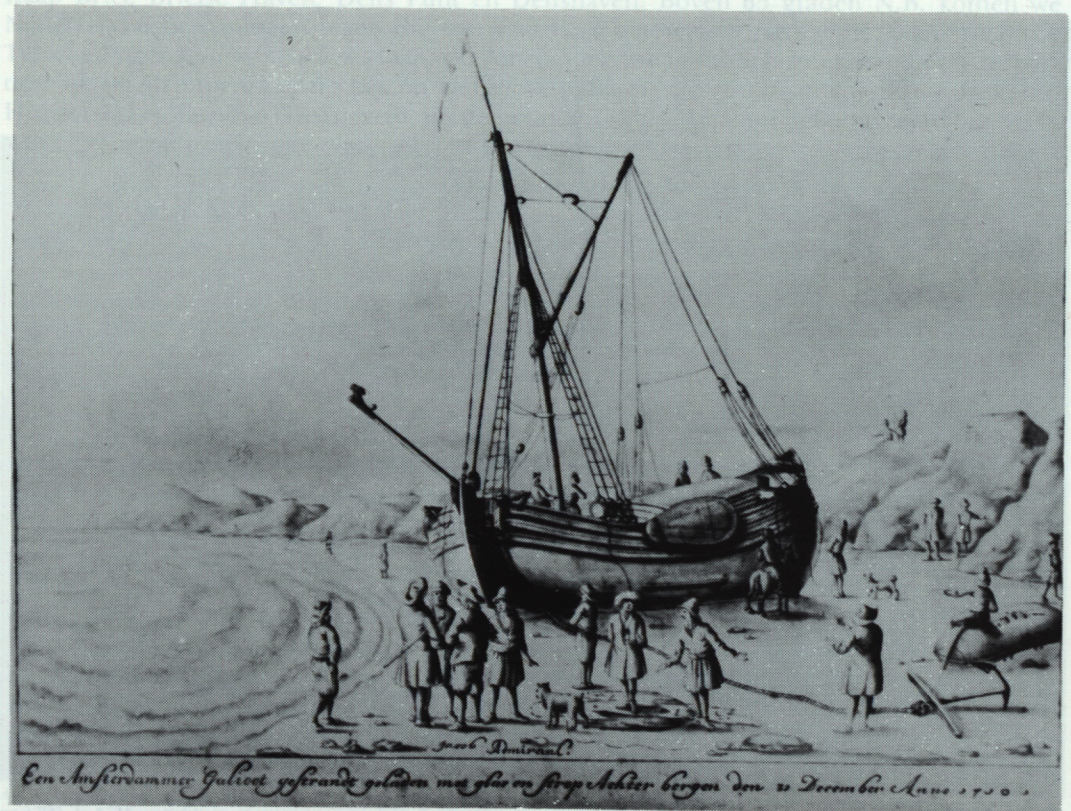
Afb. 1 'Een Amsterdamer Galjoen gestrandt, geladen et glas en strop. Achter bergen den 31 December Anna 1710'. Deze afbeelding van Jacob Admiraal toont een éénmast koopvaardij-galjoen, zoals deze veelvuldig voor de ruilhandel op Straat Davis zijn ingezet.