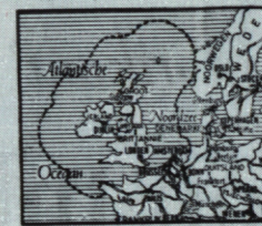
• Het gebied waar Engeland haringvangst verbiedt.

Vangst verboden voor alle vissers, ook de Engelse