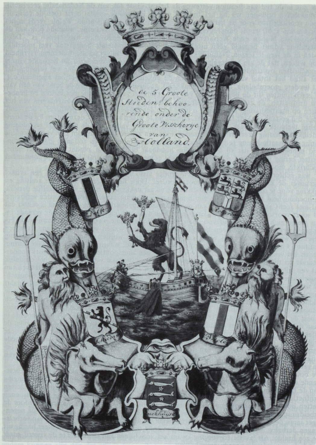
Titelpagina van het handschrift "De 5 Groote Steeden behorende onder de Groote Vischerije van Holland", dat de namen bevat van de penningmeesters en de secretarissen van de Grote Visserij van 1567-1732. Visserijmuseum, Vlaardingen.

vis was de beugvisserij nog overheersend. De invoer van de stoomtrawler luidde het einde van de passieve beugvisserij in en het is daardoor dat een haven als IJmuiden tot een snelle ontwikkeling kwam. Die ontwikkeling werd versneld door de afzetmogelijkheden als gevolg van de uitbreiding van het spoorwegnet, dat het Nederlandse, maar vooral het Duitse achterland tot een snel bereikbare markt maakte. Een gunstig ondernemersklimaat was allereerst voelbaar en daarvan heeft de Nederlandse visserij sterk kunnen profiteren, zelfs nog dank zij de neutraliteit van ons land tijdens de eerste wereldoorlog. Uit het oogpunt van visserijwetgeving was het een rustige tijd, afgezien van oorlogsmaatregelen. Wat de reglementering betreft zou het tussen de beide wereldoorlogen langzaam veranderen en na de tweede wereldoorlog in versneld tempo.