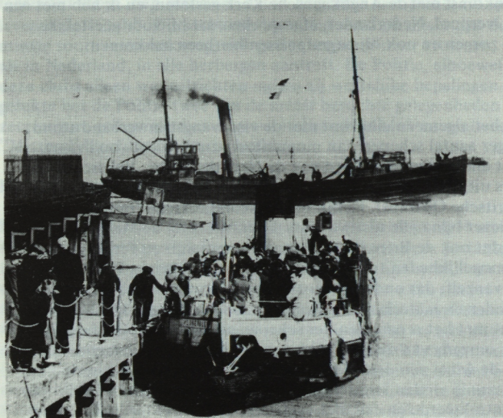
De "Perseus", kapitein Theunis Groen en machinist J.J. Fack, stoomt de haven van Fleetwood binnen.

De kleine trawlers visschen in de Iersche Zee of in het North Channel; de grootere des win-ters West van Ierland en later om en nabij IJsland. Er wordt gevischt met de "Vigneron-Dahl trawl" met Britsche netten, te Fleetwood gemaakt. Aan deze netten zijn eenige bij de Nederlandsche visschers gebruikelijke verbeteringen aangebracht, welke de Britten niet bezigden. Een daarvan is een soort van houten vlieger, aan de bovenpees van het net excentrisch opgehangen, en die door het net medegetrokken, in het water een opwaartsche beweging tracht uit te voeren en daardoor de bovenkant van het net naar boven trachtende te trekken, dit openhoudt. De Britten gebruiken voor dit doel metalen met lucht gevulde ballen, waarvan de werking veel minder goed is, maar van welker gebruik zij, vanzelf-sprekend, niet wenschen af te stappen. Er wordt gevischt op diepten tot 100 vaam water.