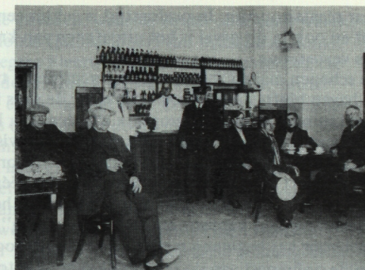
Vissers in het eerste Nederlandse zeemanshuis. Het viel geheel onder de administratie van de "Mission", met als gevolg dat er geen bier getapt mocht worden. Daarin kwam pas verandering toen de NS & HC zelf een pand huurde.