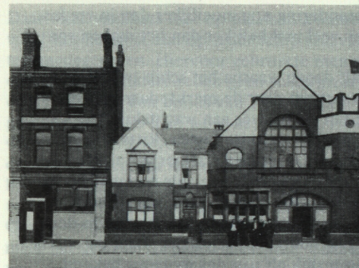
Het eerste Nederlandse zeemanshuis (links), gelegen naast de Engelse (rechts).

Het Nederlandsche Zeemanshuis maakte, gelijk gezegd, deel uit van "The Royal National Mission to Deep Sea Fishermen" en de regelen van deze philanthropische instelling laten niet toe, dat bier in hun instellingen wordt verkocht. Dit werd door onze menschen ondervonden als een nadeel, want zonder een glas bier voor zich, schijnt onze visscherman eenvoudig niet gezellig met zijn vrienden te kunnen praten. De slaapkamers van de Nederlandsche afdeling werden langzamerhand al minder en minder en tenslotte alleen nog maar door de asociale menschen gebruikt. De wensch maakte zich kenbaar om vrij van de Royal Mission te komen en een eigen tehuis te krijgen. De Mission bleek niet bereid aan de N.S. & H.C. de vrije beschikking over het door haar gehuurde pand te geven en toen toevallig in Fleetwood een lokaliteit vrij kwam op een veel fatsoenlijker plaats, huurde het "Welfare Depart-