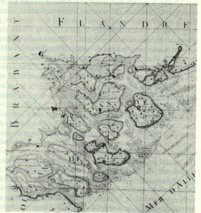
afb. 1 (Gedeelte van de) Carte des Entrées de l'Escaut et de la Meuse avec les Bancs Passes Isles et Costes Comprises entre Gravelines et Rotterdam (Parijs), begin 19e eeuw Maritiem Museum 'Prins Hendrik', Rotterdam