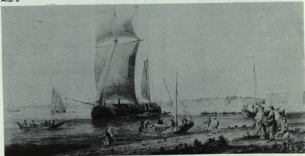
Een Keulenaar op de Nieuwe Maas bij het Bosland, Rotterdam. (Aquarel, 1809, Gemeentearchief Rotterdam, III 100).