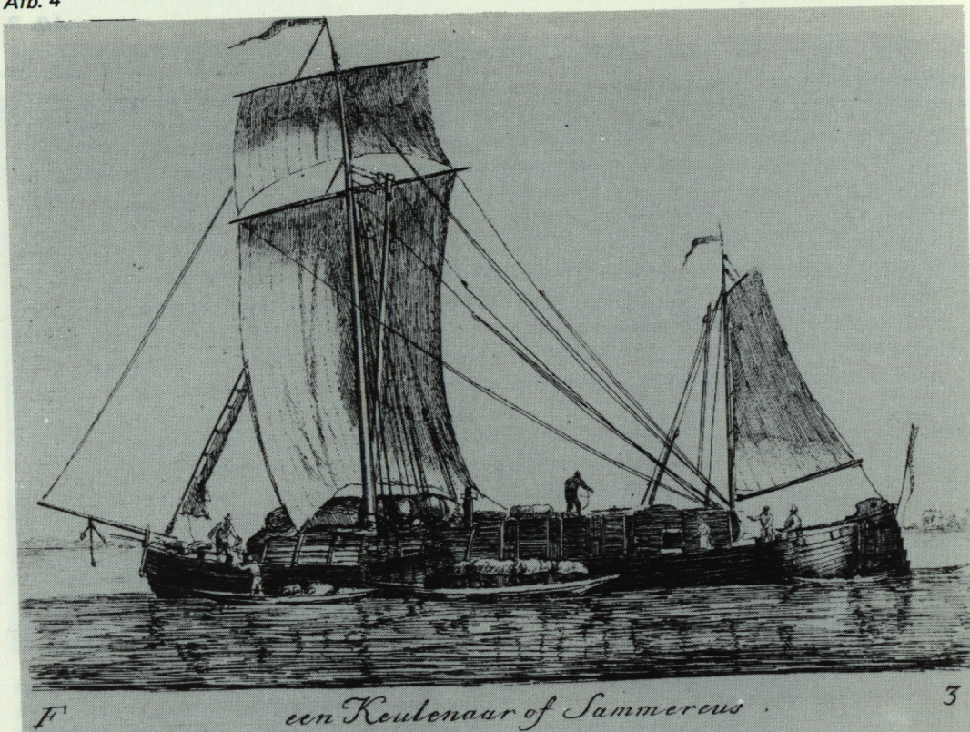
Keulenaar, gebruikt in de Rijnvaart. Uit de serie "Verscheide soorten van Hollandse vaartuigen". (Ets, 1791, Gemeentearchief Rotterdam, 52 C 13).