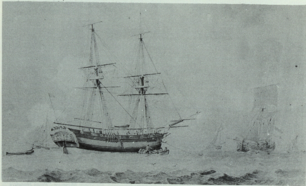
De "Vrouw Ida Johanna" op zee nabij een kust of in een brede rieviermond, waarschijnlijk in 1794. (Aquarel, eigendom van mr. A. Blussé van Oud-Alblas, Rotterdam).