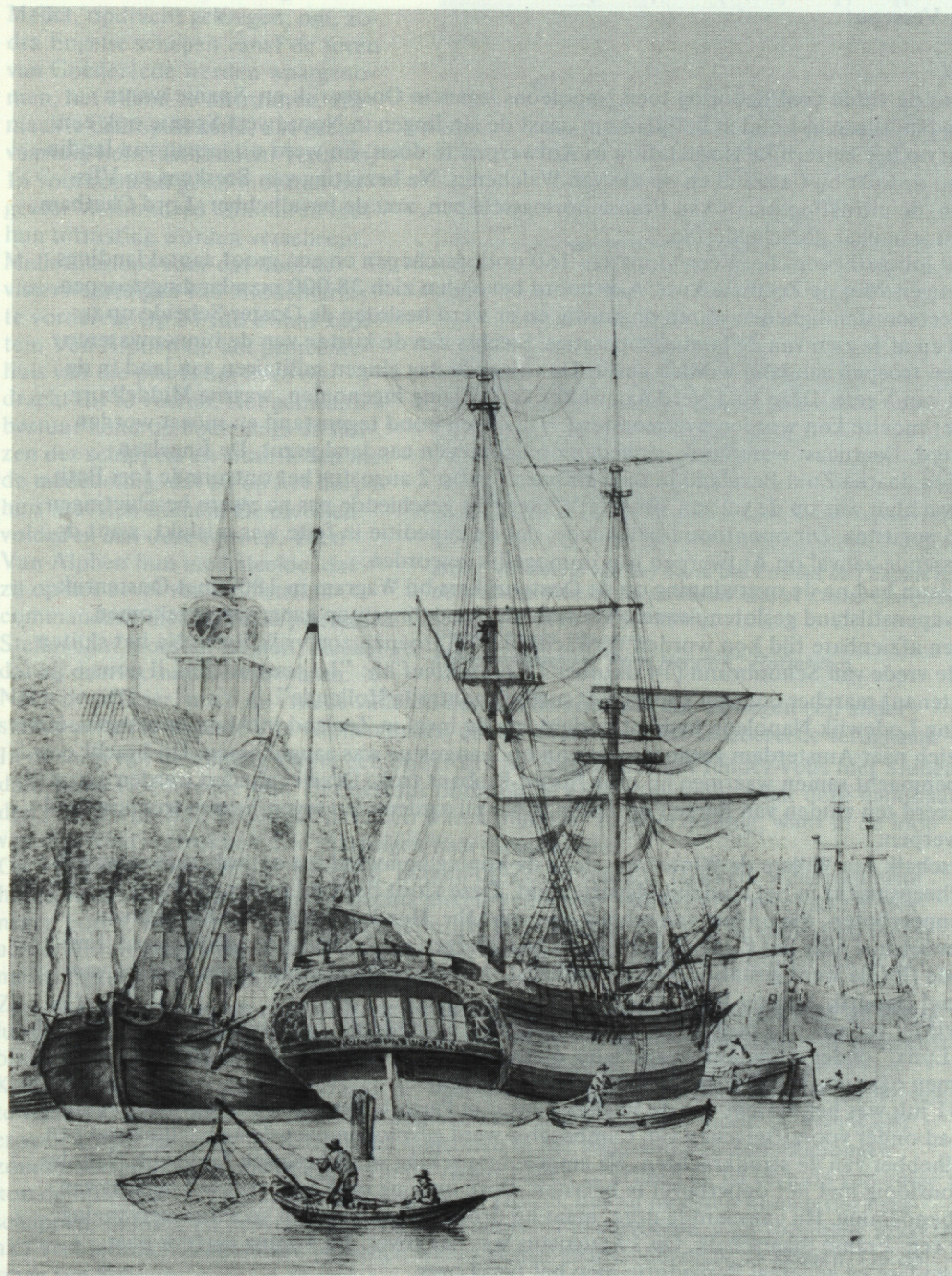
De "Vrouw Ida Johanna" in de Leuvehaven te Rotterdam, 1795. (Detail van een aquarel, Gemeente-archief Rotterdam, VII 248).