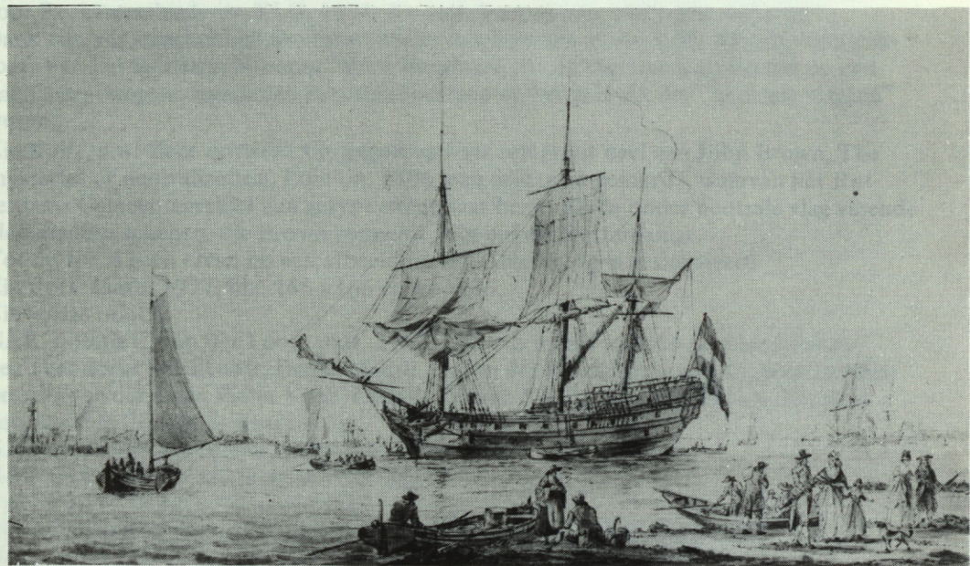
Riviergezicht, mogelijk gefingeerde omgeving. (Aquarel, Gemeentearchief Rotterdam, XXXII 31).