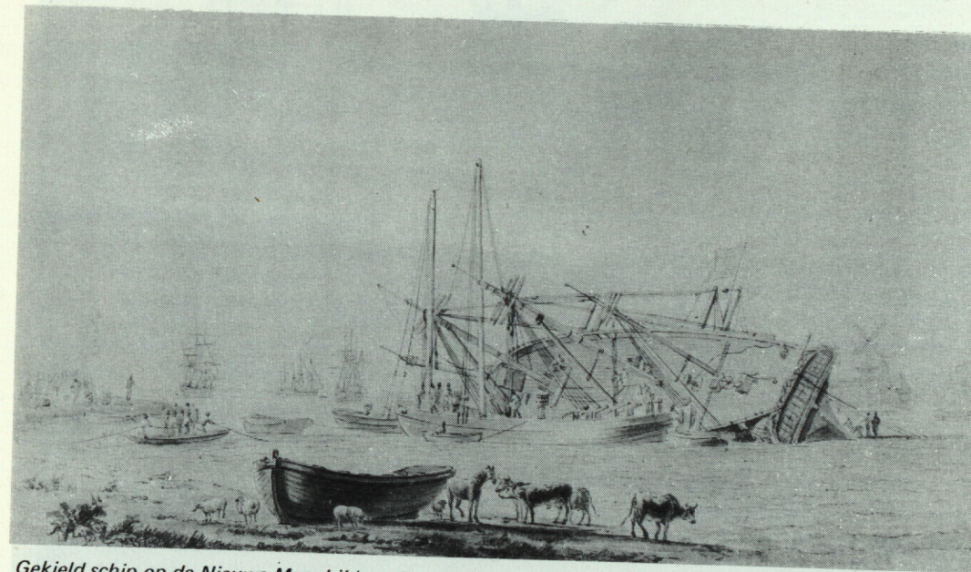
Gekield schip op de Nieuwe Maas bij het eiland Feijenoord. Geheel rechts de mond van de Rotterdamse Leuvenhaven met de Witte Poort. Het schip, een oorlogsfregat, wordt met een kiellichter scheefgetrokken. Links op de wal ziet men een vuur en pekketels. (Gewassen tekening, Maritiem Museum "Prins Hendrik", Rotterdam, P 1083).