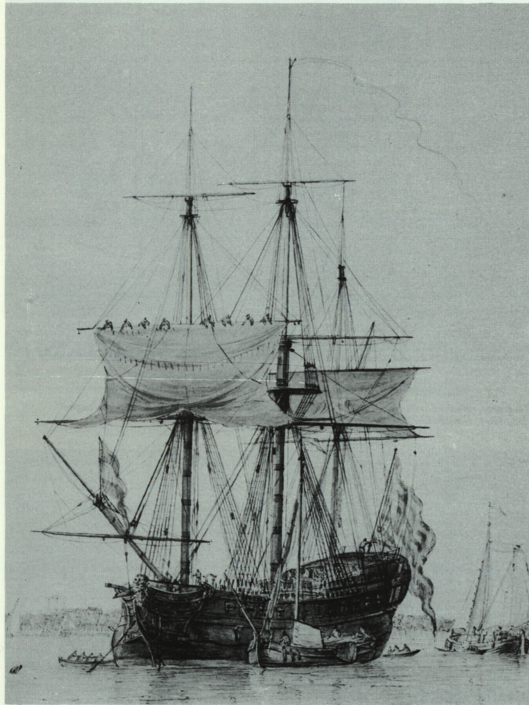
Koopvaardijfregat met de vlag van Knipphausen op de Nieuwe Maas voor Rotterdam (Detail van een aquarel, 1795, Gemeentearchief Rotterdam, III 82).