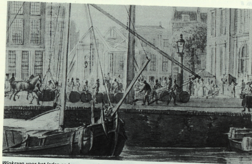
Wipkraan voor het laden en lossen van schepen aan de Kolk. Rechts een gedeelte van de Beurs, op de achtergrond de Blaak. (Detail van een aquarel, Gemeentearchief Rotterdam, XIV 13).