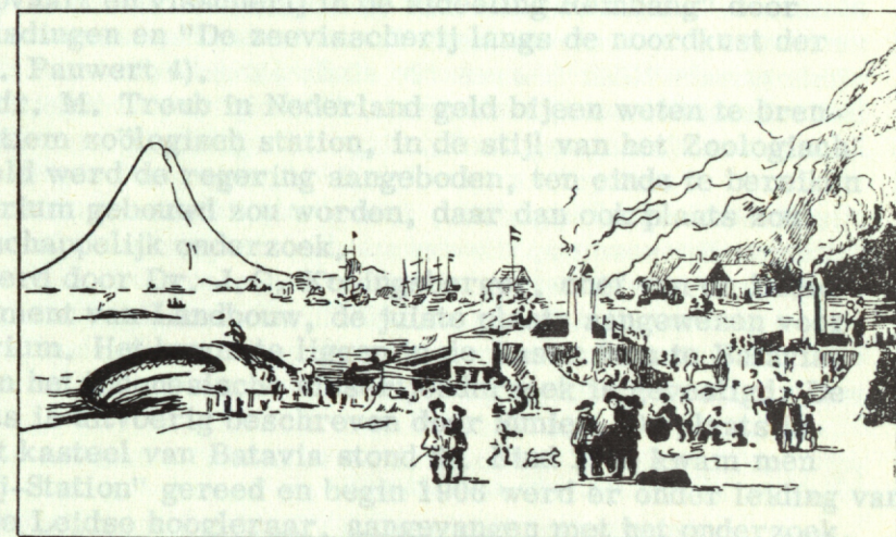
3. Schets van No. VI ter verduidelijking van de compositie van afbeeldingen Nos. V en VI. Let op het profiel van de Berenberg links, ietwat overdreven steil weergegeven.