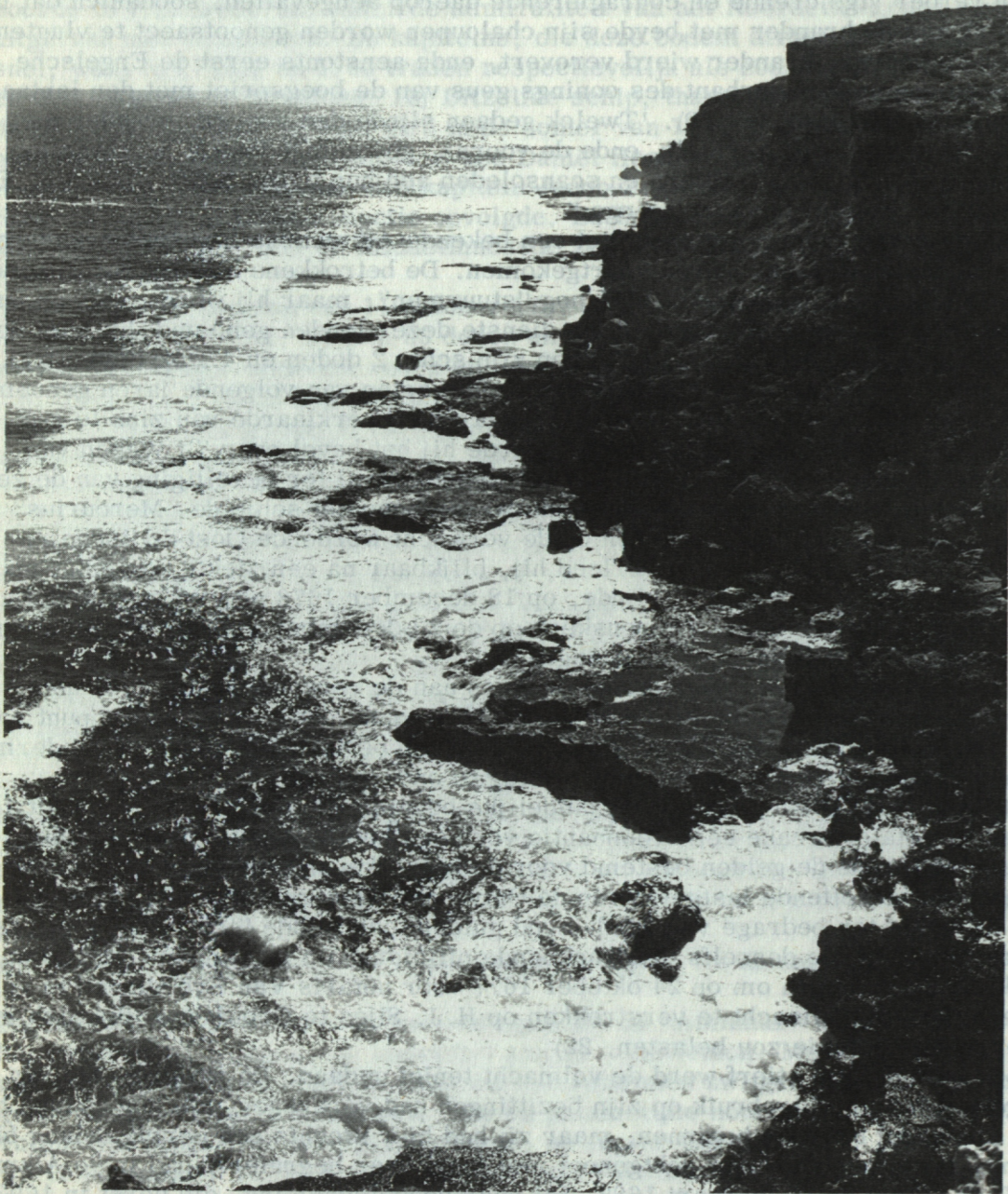
Rotsige kust nabij de vindplaats van de 'Zuytdorp'.