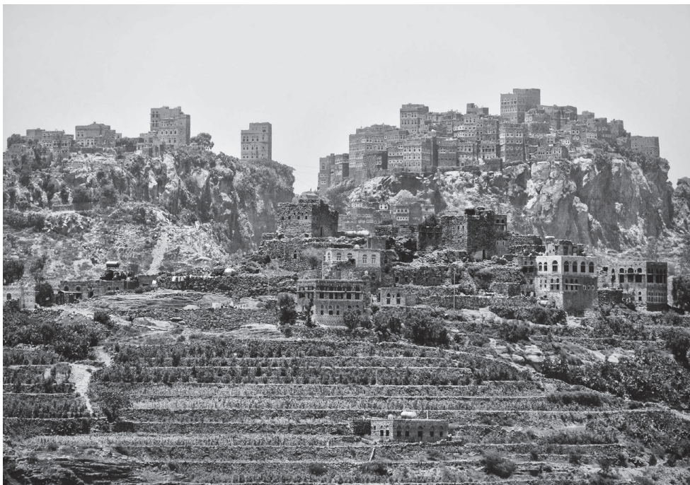
Het zaidisme is onlosmakelijk verbonden met het landschap van Jemen.

dat de leider van de moslimgemeenschap een afstammeling van de Profeet behoorde te zijn, een Alid , die vroom was en veel van de islam wist. Tegelijk, en in tegenstelling tot andere sjiëten, vond hij dat zo'n persoon een oproep ( da'wa ) moest doen om zijn volgers te bewegen tot strijden voor zijn visie van een rechtvaardige staat.