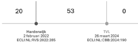
Figuur 2 Datum bestreden besluiten en rechtbankuitspraken voor de 73 geanalyseerde uitspraken

stijl, aangezien het bestuursorgaan dit ten tijde van het besluit nog niet op de vernieuwde manier motiveerde.