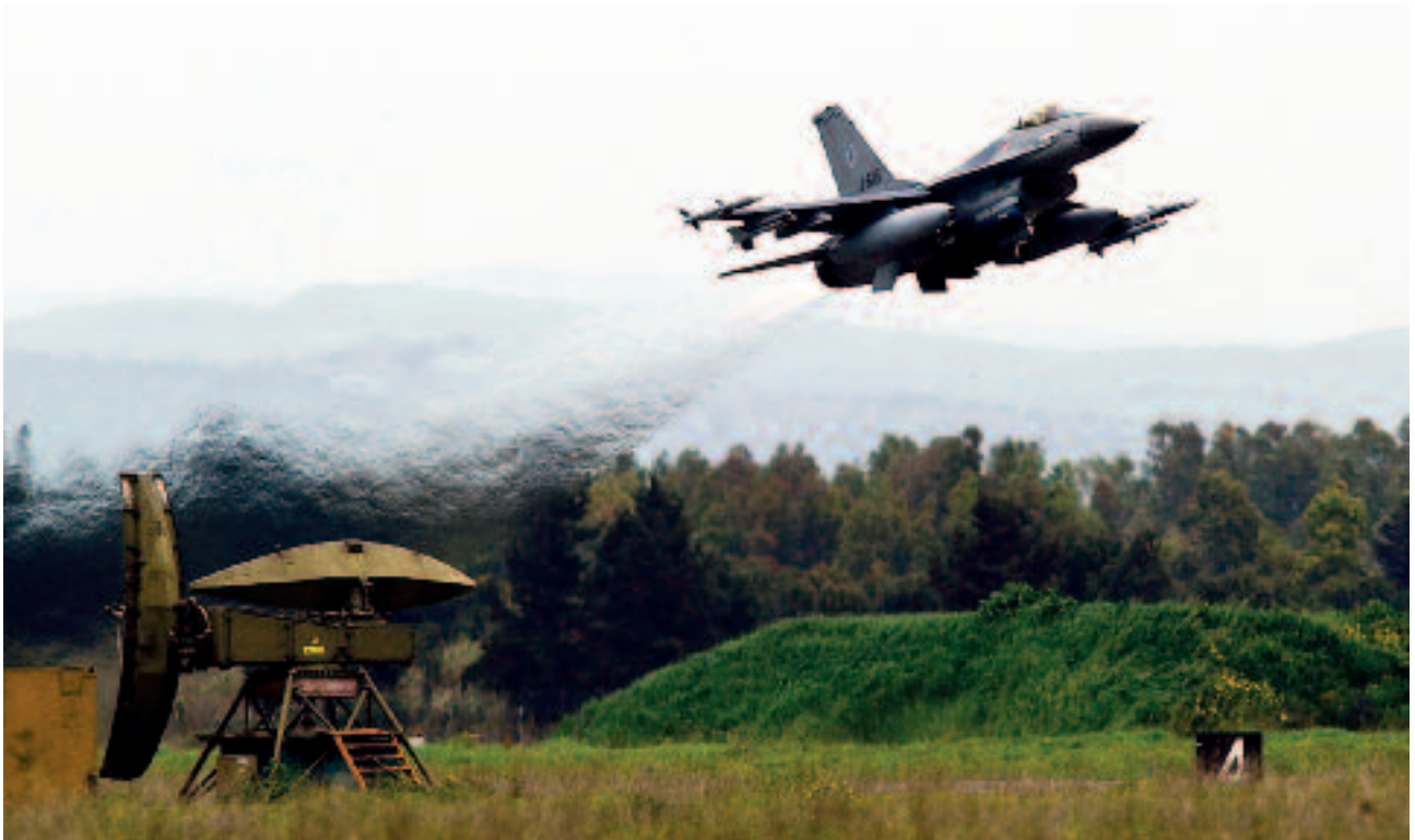
Een Nederlandse F-16 vertrekt van een vliegbasis op Sardinië voor een missie bij Libië; de geografische ligging van Libië maakte het mogelijk om tijdens Unified Protector de NAVO-infrastructuur in de Middellandse Zee te gebruiken

had het CAOC de handen vol aan de (maximaal) 180 sorties die per 24 uur werden getasked , en dit terwijl, zoals de Amerikaanse minister van Defensie Gates later droogjes opmerkte, het CAOC was opgezet om dagelijks 300 sorties aan te sturen. 47 Dit staat in schril contrast met de meer dan 700 sorties per 24 uur-cyclus die de NAVO kon tasken tijdens Allied Force in 1999. 48 Tijdens Unified Protector heeft de NAVO 25.944 sorties getasked, waarvan 25.011 fixed wing , 424 helikopter en 509 UAV. Daarvan waren 9.658 sorties in een aanvalsrol (air-to-ground). 49 De connectiviteit tussen het hoofdkwartier en eenheden op de diverse locaties vormde een probleem. Met name de beperkte bandbreedte over een beveiligde verbinding voor het delen van hoogwaardig beeldmateriaal bleek een kritisch punt. Aanschaf van de benodigde apparatuur zoals BICES 50 blijft een nationale verantwoordelijkheid. Unified Protector heeft aangetoond dat veel lidstaten hierin te weinig hebben geïnvesteerd, met name in een expeditieve variant. Daarnaast bleek de toeganke-