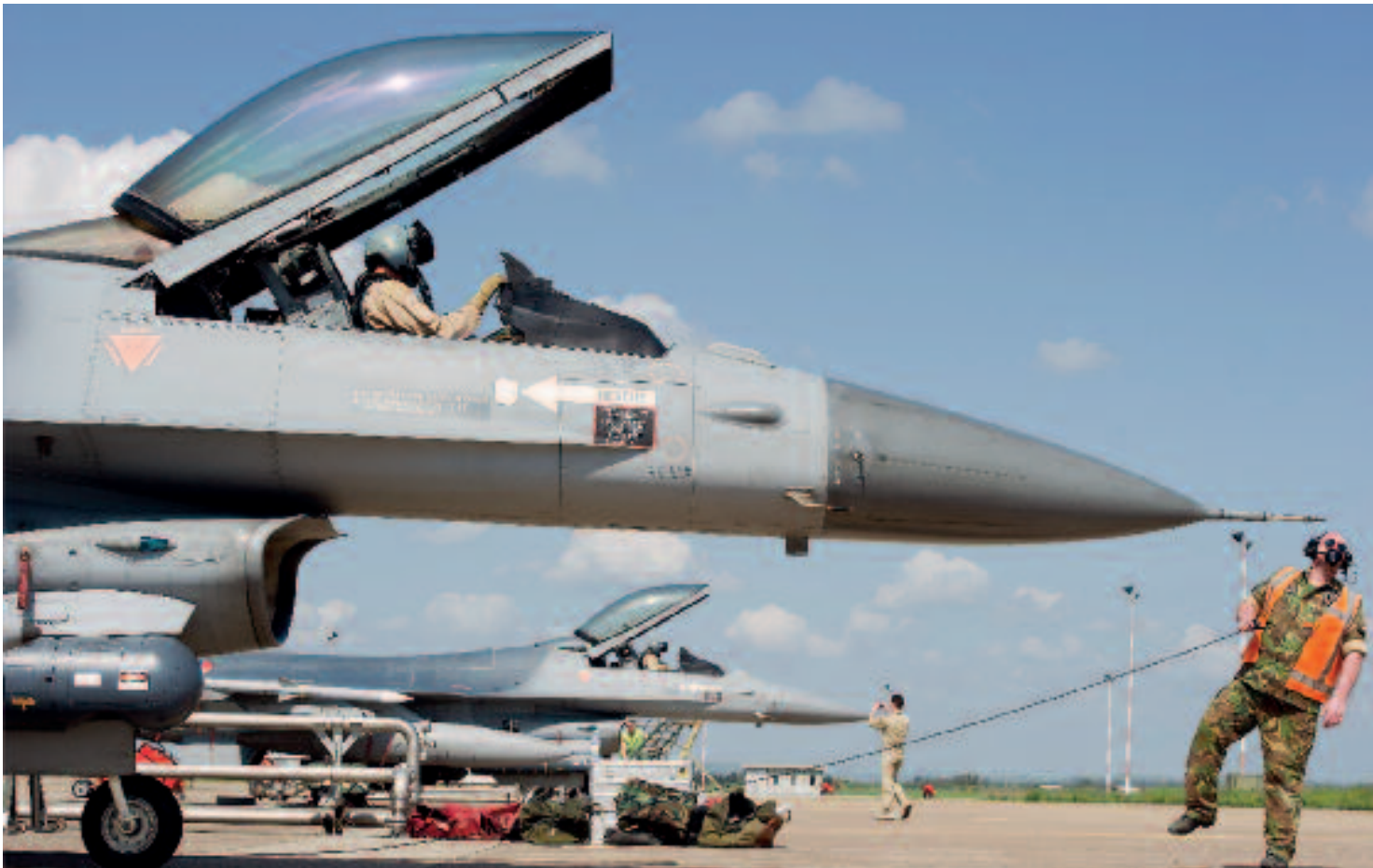
Nederlandse F-16's tijdens voorbereidingen voor trainingsvluchten op Sardinië: Unified Protector ging direct de Europese belangen aan, maar niet alle NAVO-landen daar waren bereid offensieve middelen te leveren