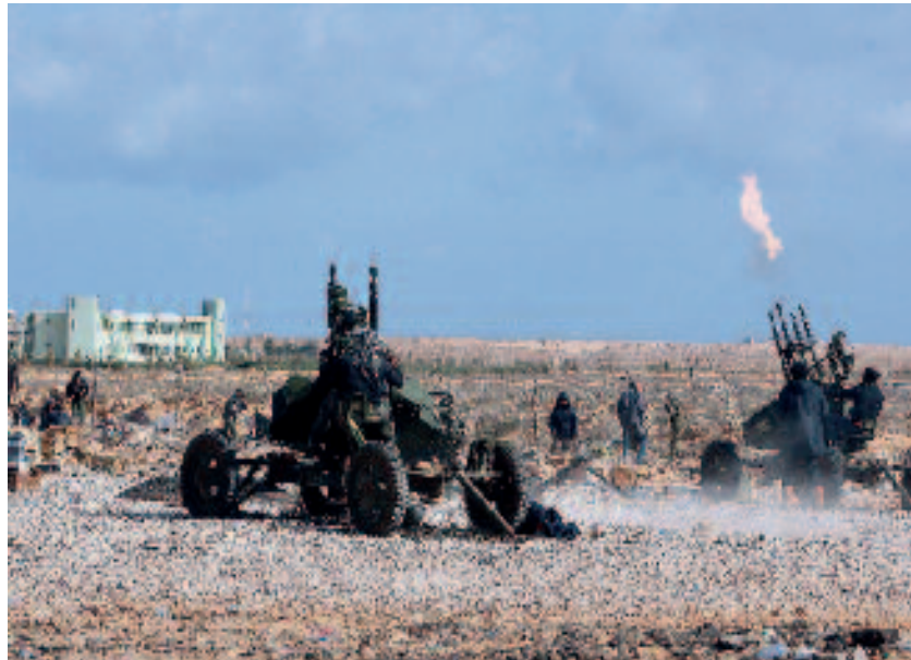
Special Forces onderhielden de verbinding met de rebellen, die onder meer probeerden veroverde vliegvelden te verdedigen tegen de luchtmacht van Gaddafi

Verenigde Arabische Emiraten de operatie met SF-eenheden ondersteund. 60 Deze eenheden trainden rebellen in het lokaliseren en identificeren van eenheden die trouw waren aan het Gaddafi-regime, zodat luchtsteun gericht kon worden ingezet. Ook verzorgden SF-eenheden de verbinding tussen de rebellen en de CAOC's voor Odyssey Dawn en Unified Protector . 61 Daarnaast zijn SF betrokken geweest bij de coördinatie van NAVO-luchtaanvalen tegen Gaddafi-eenheden en de operaties in onder meer Tripoli. 62 Daarbij werd onder meer gebruik gemaakt van Twitter en e-mail. 63 Vooral de liaisonofficier van Qatar in JFC Napels schijnt een actieve rol te hebben ge-