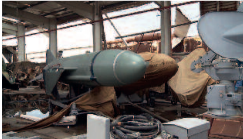
Bij acties van NAVO-vliegtuigen waren Libische wapensystemen- en opslagplaatsen voortdurend doelwit

Figuur 2 op pagina 226 geeft aan in welke delen van Libië het regime van Gaddafi een bedreiging vormde. Om in staat te zijn de grootste luchtdreiging van het Libische leger uit te schakelen, zijn tijdens de eerste aanvalsgolven veel kruisraketten en enkele B2-stealthbommenwerpers gebruikt. De B2-stealthbommenwerpers zijn door hun vorm in combinatie met de gebruikte materialen minder zichtbaar voor de radar van geleidewapensystemen en hierdoor zijn ze bijzonder geschikt om in die fase van het conflict waarbij er nog een substantiële dreiging van SAM's is, de meest kritische doelen aan te vallen.