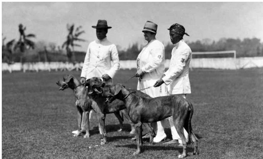
Vader en moeder Hoven, en een inheemse bediende, bij de hondententoonstelling in Semarang, met drie prijswinnaars.