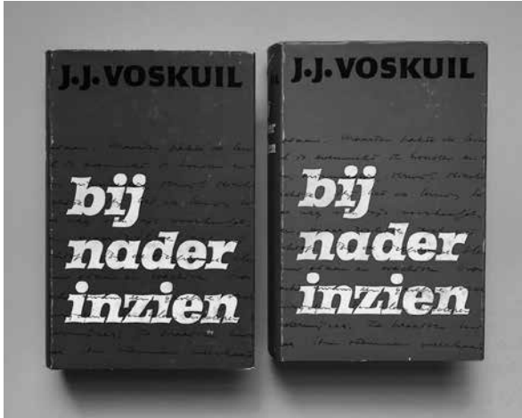
J.J. Voskuil, Bij nader inzien (1963).

Dat noemt Paul, die steeds geïrriteerder raakt, ‘H.B.S. jongens-filosofie’. Het is duidelijk dat Maarten en Paul op dit vlak niet nader tot elkaar komen. 36