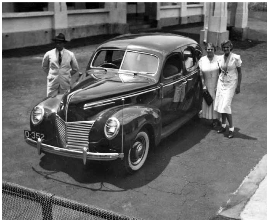
Vader, moeder en Suus en 'de nieuwe Mercurie', december 1939.