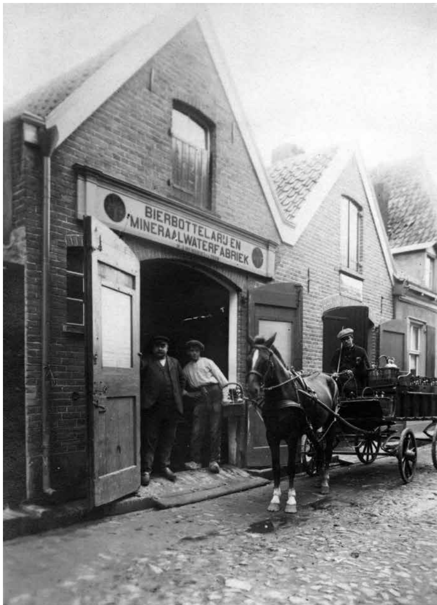
Bierbottelarij en mineraalwaterfabriek H.J. Hendriks en Zoon. Collectie Leonoor Oversteegen.