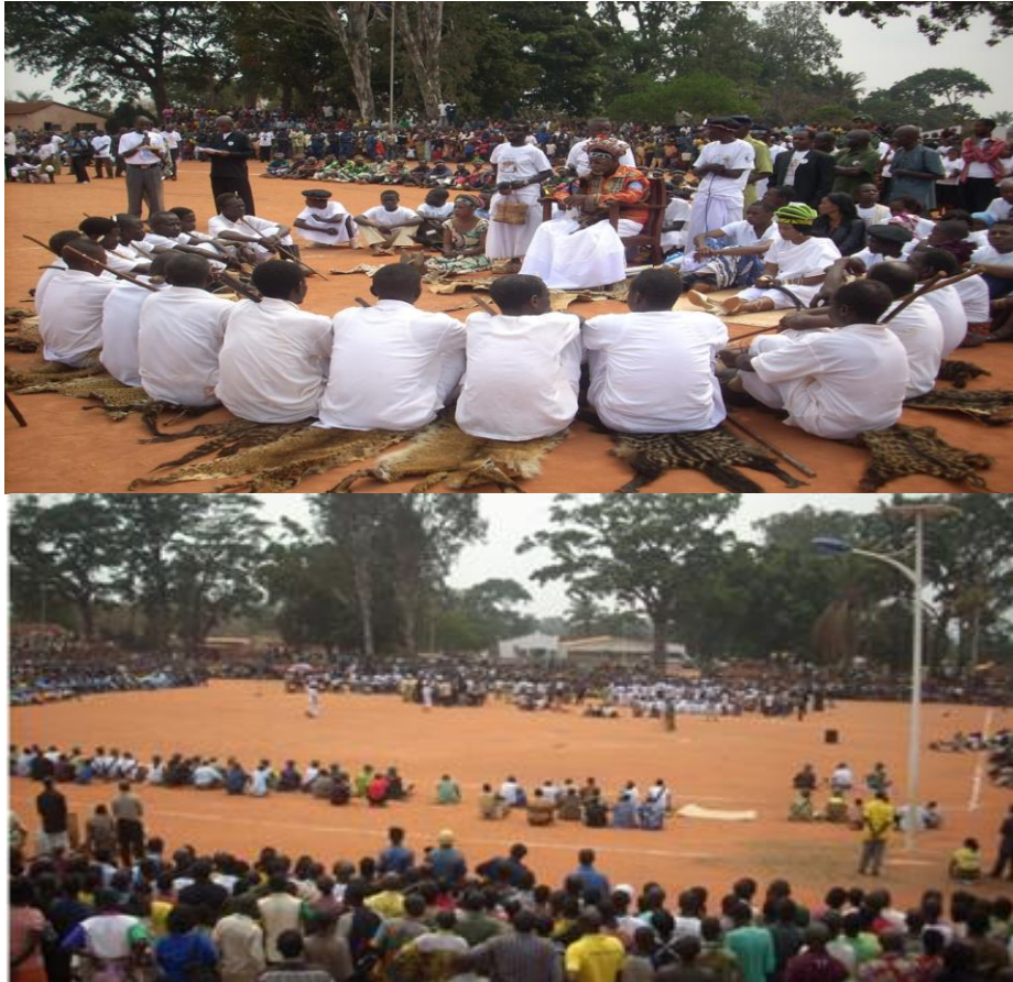
Sources : Liévain Mwangal, photos enquête effectuée sur le terrain, Musumb, 01/09/2012

L'organisation locale comprend des ayilol [(le pluriel de chilol ), chefs politiques sans droits de terre qui formaient des colonies ( iiyang ) et administraient une série des terres] et des ayikej (chefs politiques principaux, nommés par le Mwant Yaav comme surveillants et résidant dans une région où ils supervisent l'acheminement du tribut vers la capitale Musumb) 95 comme membres que le Mwant Yaav envoie auprès d'un ou plusieurs groupes propriétaires fonciers après les avoir assujettis. Ces ayikej se soumettent à l'autorité du Mwant Yaav , ils participent aux affaires politiques impériales et ils sont nommés par le Mwant Yaav lui-même. Ils sont encore chargés de contrôler les activités socio-politico-administratives d'un chilol ou des ayilol . 96