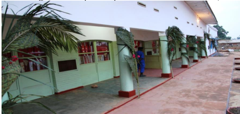
La résidence officielle ou le palais royal de Mwant Yaav à Musumb (l'actuelle)