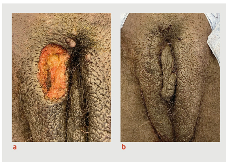
Figuur3 Het resultaat van de behandeling van de verruceuze afwijking

Bij de ingreep, 3 weken later, bleek de afwijking verder gegroeid te zijn tot 4 bij 3 cm; er was nu ook uitbreiding naar de mons pubis en het linker labium. De afwijking op het rechter labium werd met een diathermisch naaldje in toto verwijderd met een marge van 0,5 cm rond de afwijking. Het wondgebied werd met losgeknoopte hechtingen gesloten (figuur 3). Twee soortgelijke afwijkingen van enkele millimeters op de mons pubis en het linker labium werden gecoaguleerd.