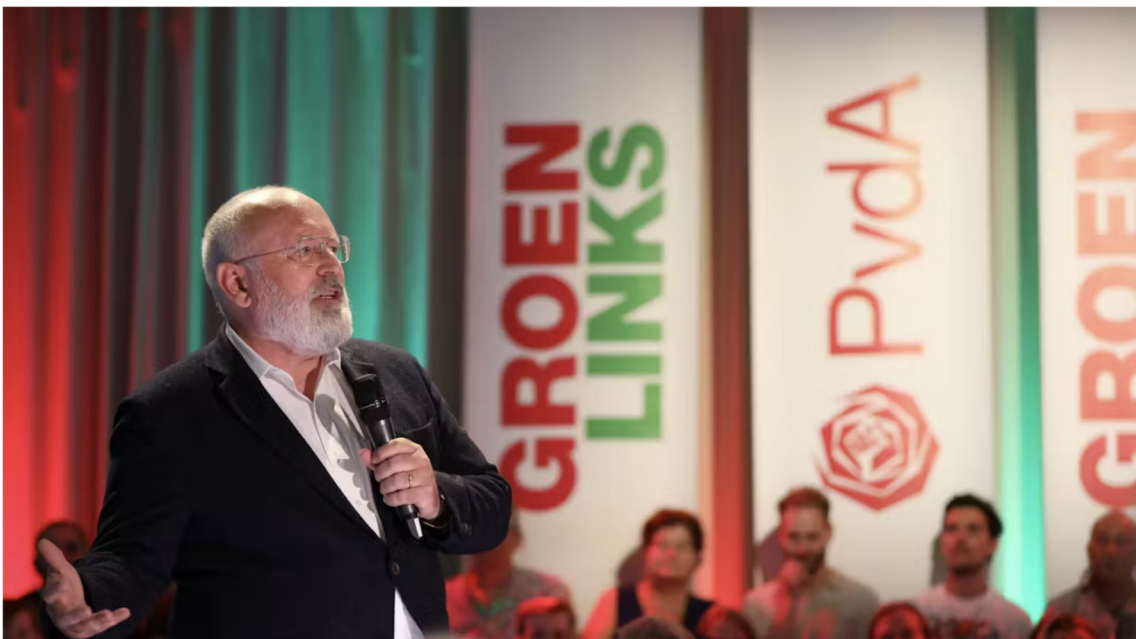
Frans Timmermans in actie