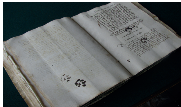
5. Manuscript, 11 March 1445. Kattenpootjes in inkt, 'Lettere e commissioni di Levante', band 13, Staatsarchief van Dubrovnik.