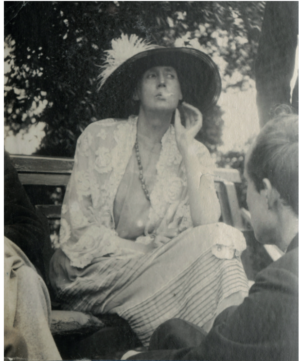
1. Foto van Virginia Woolf, juni 1923. Vintage snapshot print, 92mm x 61mm, Ax141310.

Zoals meestal met een religieuze of semi-religieuze bewustwording, moet de betreffende persoon zich in de juiste, ontvan-