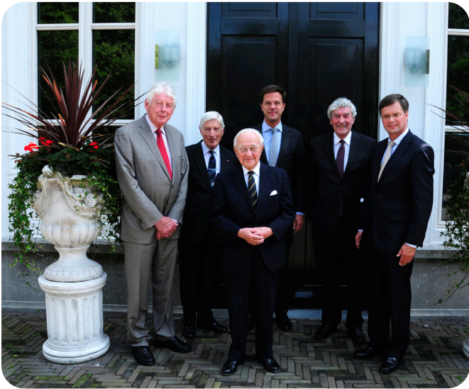
Minister-president Rutte

Israël hetzelfde doel als de Staatscommissie-Remkes: om de kiezers een directe stem te geven in de formatie. Daarnaast hoopten hervormers twee zaken te bereiken: door middel van een kiezersmandaat de legitimiteit van de premier te vergroten en de invloed, omvang en aantal van kleine partijen te verminderen om de bestuurbaarheid te vergroten (Ottolenghi, 2001). In 1996 was de eerste keer dat in Israël de premier direct kon worden gekozen. De positie van de minister-president weliswaar sterker, maar dit was vanwege de politieke versnippering eerder schijn dan realiteit (Ottolenghi, 2001). Dan het punt over de verbeterde bestuurbaarheid door de vermindering van het aantal kleinere partijen. De gekozen premier droeg weinig bij tot snelle coalitieonderhandelingen – coalities werden juist groter en uiteenlopender waardoor vanwege partijdynamiek en de handhaving van de coalitie de premier juist vaker genoodzaakt was om kleinere coalitiegenoten te accommoderen (Ottolenghi, 2001). Deze partijen hadden geen prikkel om concessies te doen naar de premier, wat ervoor zorgde dat de de facto macht van de premier niet groter was dan voor de invoering (O'Malley, 2006). Bij de verkiezingen van 1999 bleek dat juist de grote partijen kleiner werden en de kleinere partijen juist groter (Hazan & Diskin, 2000).