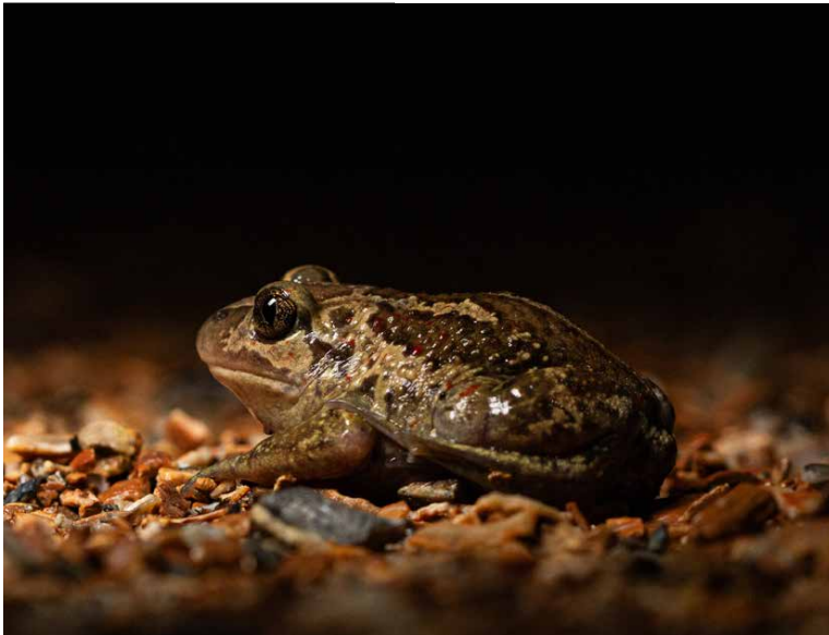
Knoflookpad uit Callantssoog. (Foto: N. Jansen).

Introductie van ziektes, concurrentie om voedsel en predatie – alle lastig waarneembaar, maar wel degelijk reëel – zijn voorbeelden van risico's voor de reeds aanwezige fauna. Ook mag het risico op verdere verspreiding van deze genetisch afwijkende knoflookpadden niet worden onderschat. Secundaire verspreiding, oftewel translocatie van dieren vanuit Zwanewater & Pettemerduinen naar autochtone populaties, kan desastreuze gevolgen hebben ('outbreeding'). Het gevaar van deze secundaire verspreiding krijgt vrijwel geen aandacht in Nederland, maar ligt voor diverse reptielen en amfibieën op de loer (Struijk & Wielstra, 2023).