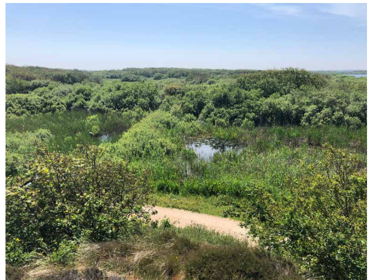
Succesvolle voortplantingswateren van de knoflookpad: ruime oppervlaktes met ondiep, visvrij, helder water met een weelderige onderwatervegetatie en een pH van 6,1-7.