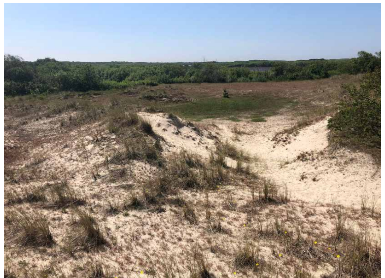
Landhabitat van de knoflookpad in N2000-gebied Zwanewater & Pettemerduinen.