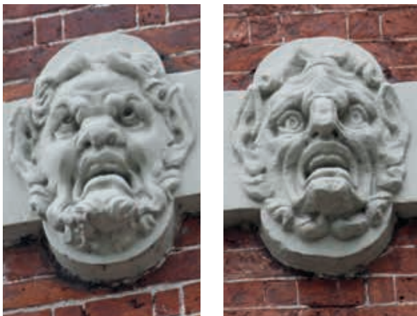
6. Mascarons op de verdieping van Huis Bartolotti, Herengracht 170-172 in Amsterdam uit 1620, atelier Hendrick de Keyser