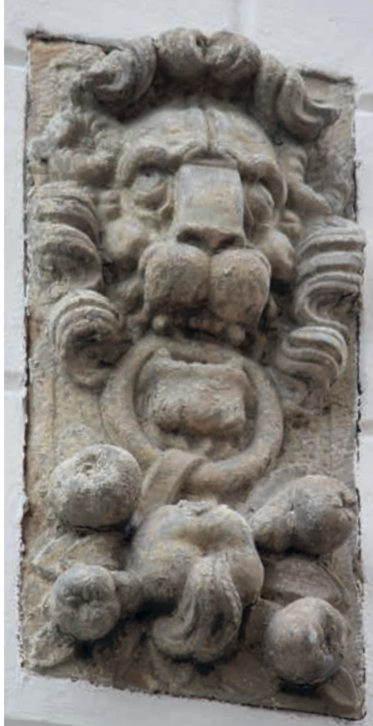
19. Broederstraat 25 in Kampen, flankerende hoekblokken met leeuwenkoppen die via een ring een vruchtenslinger dragen, toe te schrijven aan Gerrit Lambertsen van Cuilenborch, tweede kwart zeventiende eeuw