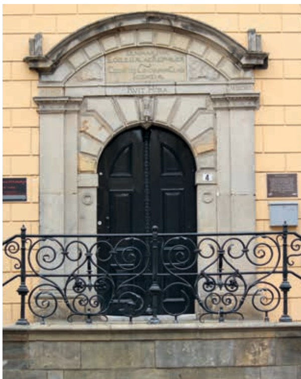
8. Gerrit Lambertsen van Cuilenborch, zandstenen ingangspartij van de Latijnse school in Kampen uit 1631