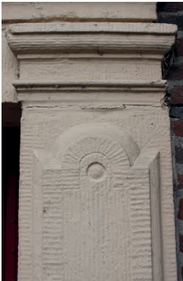
26. Detail van de spiegel op de deurstijlen van: a. Nieuwe Markt 8 in Kampen en b. de (flankerende) deuren van de Nieuwe Toren aan de Oudestraat in Kampen

De huizen aan de Zwolse Nieuwe Markt hebben een sobere, seriematige opzet met uniforme trapgeveltjes, 'met gevels twee vierkanten hoge opte anderen wal ge lyckende', volgens de instructie van het stadsbestuur (afb. 22). 47 Oorspronkelijk hadden ze alle trapgevels, en lijken daarmee op dat van Broederweg 9. Samen met Broederstraat 25 in Kampen hebben de Zwolse en Kamper pandjes nog een ander element gemeen, namelijk de insteek achter de hoge begane grond. Dit onderdeel is in Hollandse huizen meer vanzelfsprekend aanwezig dan in Overijssel. 48 Bij de inrichting van de Zwolse Nieuwe Markt hoort een natuurstenen poortje met het stadswapen op de sluitsteen in de koorsluiting van de Bethlehemkerk (afb. 24).