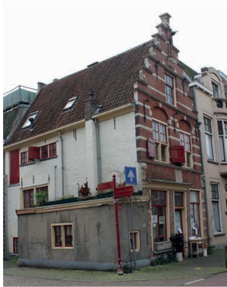
15. Voorgevel van het hoekpand Broederweg 9 in Kampen, tweede kwart zeventiende eeuw

weest zijn. Centraal daarboven zit een gevelsteen met St. Joris en de draak (afb. 14). De gevel lijkt een kleinere variatie op Oudezijds Voorburgwal 57 Amsterdam te zijn, een ontwerp van Hendrick de Keyser uit 1615.