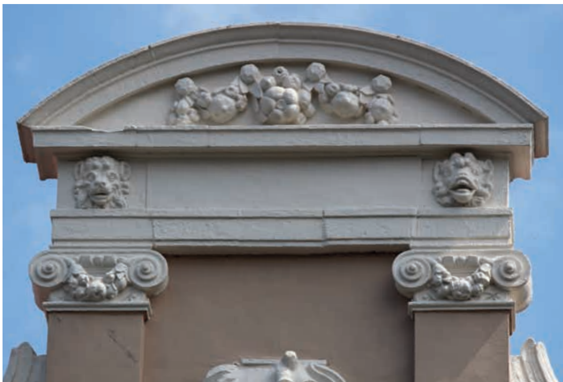
28. Zes leeuwenkoppen in de voorgevel van Melkmarkt 14 in Zwolle, 1653, toe te schrijven aan het atelier van Gerrit Lambertsen van Cuilenborch