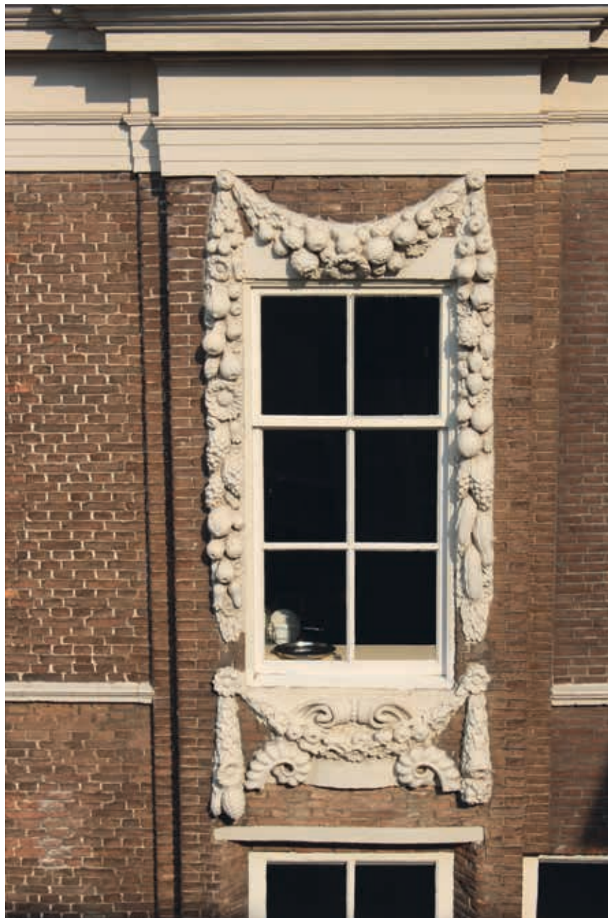
30. Festoenen boven de (zij)ingang van Koestraat 8 in Zwolle, 1651 of kort daarna, toe te schrijven aan Gerrit Lambertsen van Cuilenborch of zijn atelier

Het vroege classicisme van de Van Cuilenborchs in Kampen en Zwolle is overduidelijk beïnvloed door Hendrick de Keyser. Dat ligt voor de hand gezien zijn achtergrond. Net als bij andere architecten verandert binnen het oeuvre van Gerrit Lambertsen van Cuilenborch de gesuperponeerde pilasterstelling in een kolossale ordening van de pilasters. Het ionische kapiteel van Melkmarkt 14 is vlak uitgevoerd, zoals gebruikelijk bij Serlio en Hendrick de Keyser, terwijl Philips Vingboons en andere tijdgenoten een voorkeur hadden voor de overhoekse variant zoals voorgesteld door Scamozzi. 68 Leeuwenkoppen blijken een bruik-