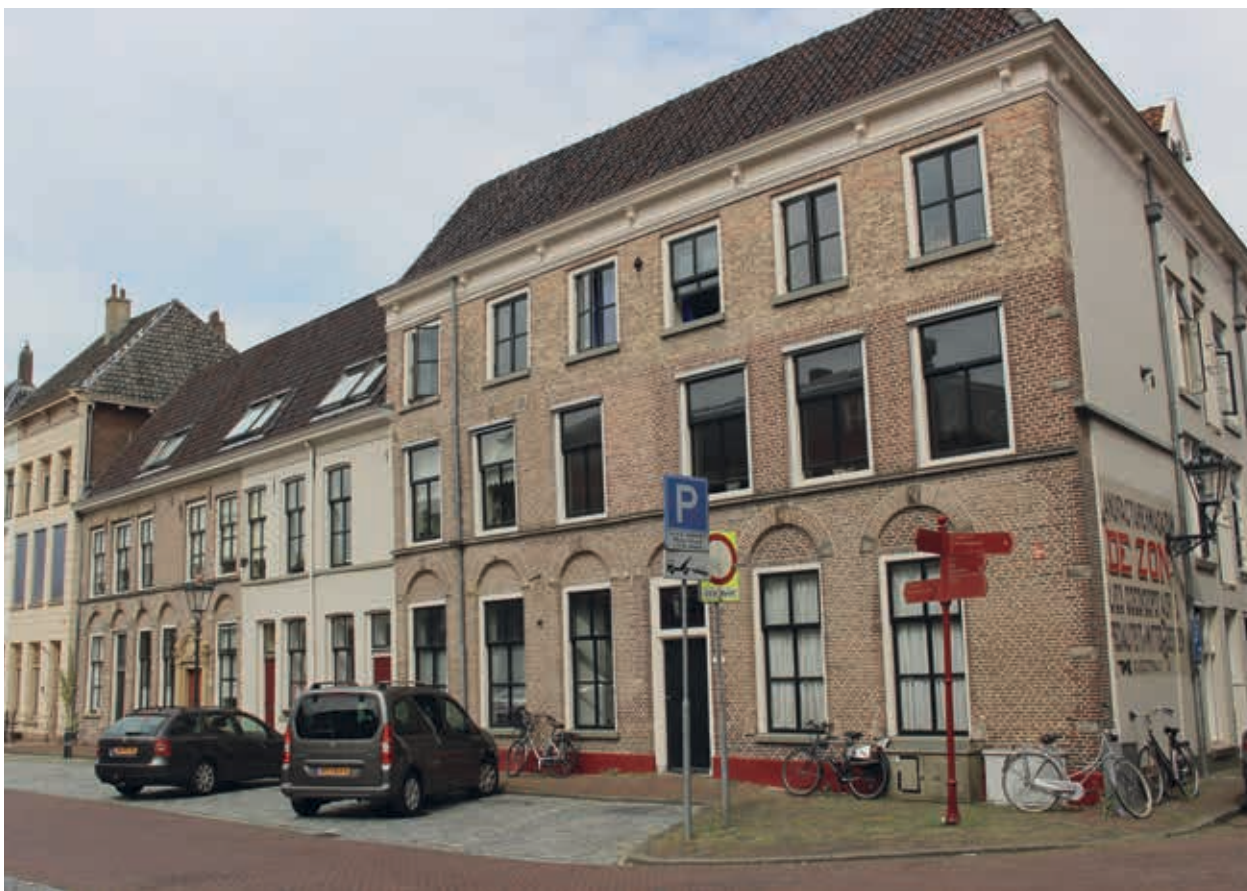
9. Noordzijde van de Nieuwe Markt in Kampen met het langgerekte gebouw dat oorspronkelijk de functie van doelen gehad kan hebben. De vensters op de begane grond worden gedekt door bogen, die van de verdieping met strekken (foto auteur)