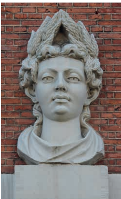
17. Twee hoofden van het 'Huis met de Hoofden', Keizersgracht 123 Amsterdam uit 1622: a. Ceres; b. Bacchus. Atelier van Hendrick de Keyser