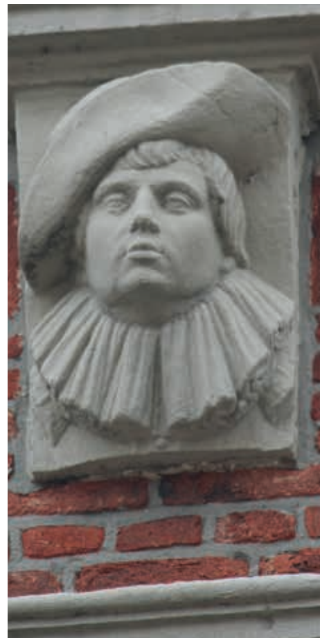
16. Gevelstenen met hoofden in de voorgevel van Broederweg 9 Kampen: a. Ceres; b. Bacchus; c. waarschijnlijk de opdrachtgever. Toe te schrijven aan Gerrit Lambertsen van Cuilenborch, tweede kwart zeventiende eeuw