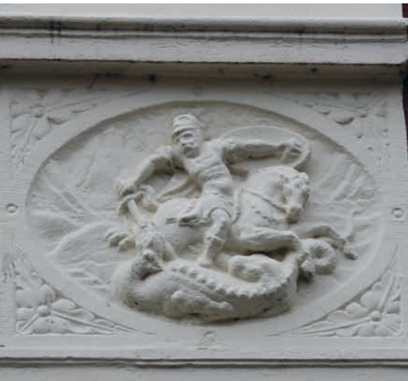
14. Gevelsteen met St. Joris, toe te schrijven aan Gerrit Lambertsen van Cuilenborch