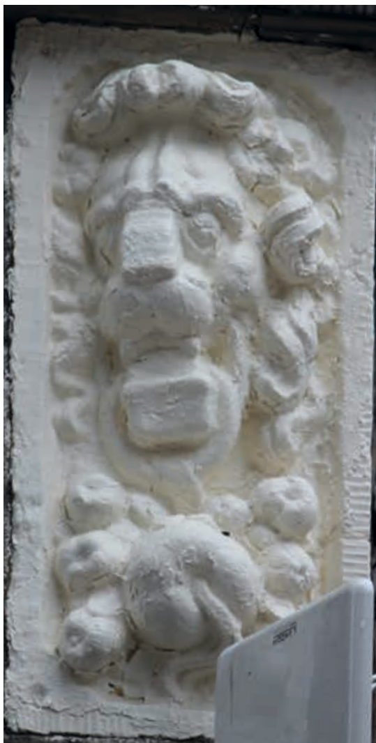
20. Sassenstraat 37, zijde Nieuwe Markt in Zwolle, flankerende hoekblokken met leeuwenkoppen die met een ring een vruchtenslinger in hun bek vasthouden, gedateerd 1647. Toe te schrijven aan Gerrit Lambertsen van Culenborch of zijn atelier