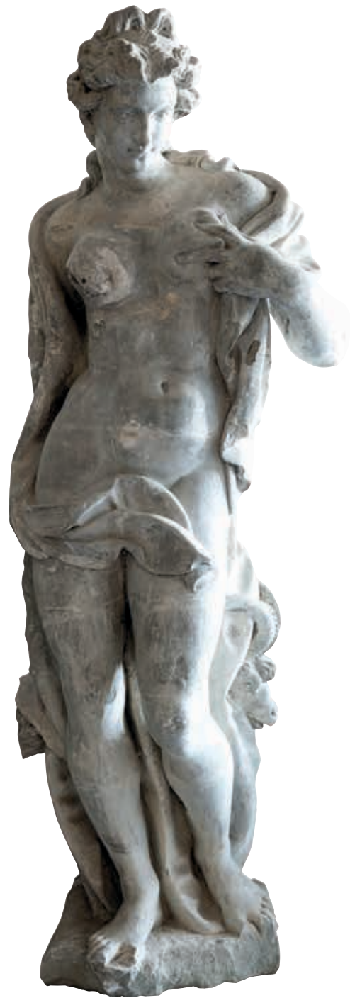
3. Gerrit Lambertsen van Cuilenborch, Venus/Sibylle van de 'marmorgalleriet' van kasteel Frederiksborg in Hillerød, ca. 1620

stierf. Hendrick de Keyser was deeltijds in dienst van de stad, hetgeen ruimte gaf aan opdrachtgevers buiten Amsterdam, zoals in Delft, Middenbeemster, Deventer, Rotterdam, Hoorn en in het buitenland. 3