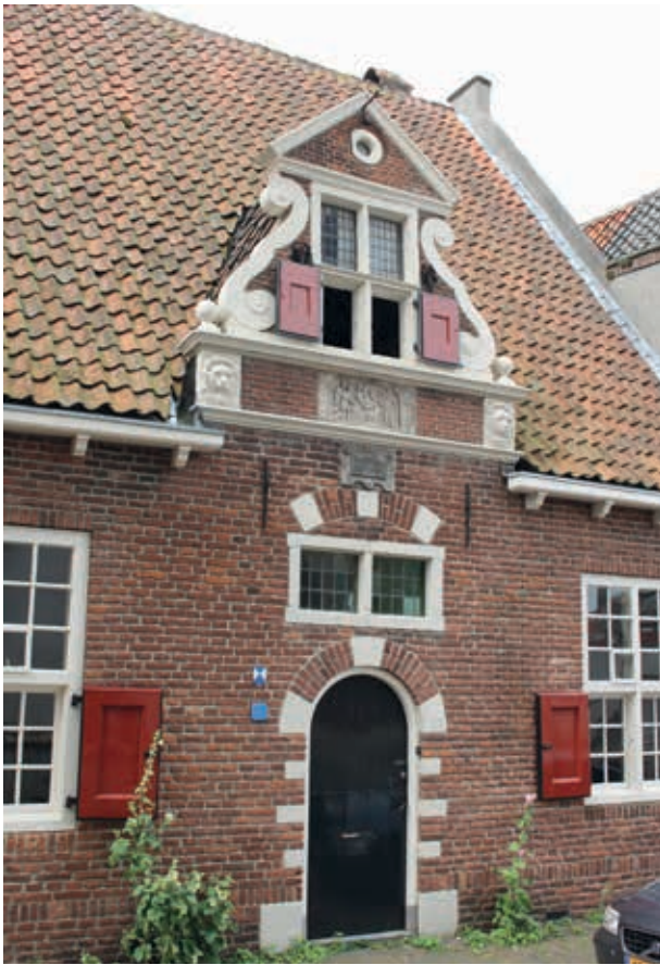
11. Middendeel van 'In Bethlehem', Buiten Nieuwstraat 62 in Kampen, uit 1631 (foto auteur)