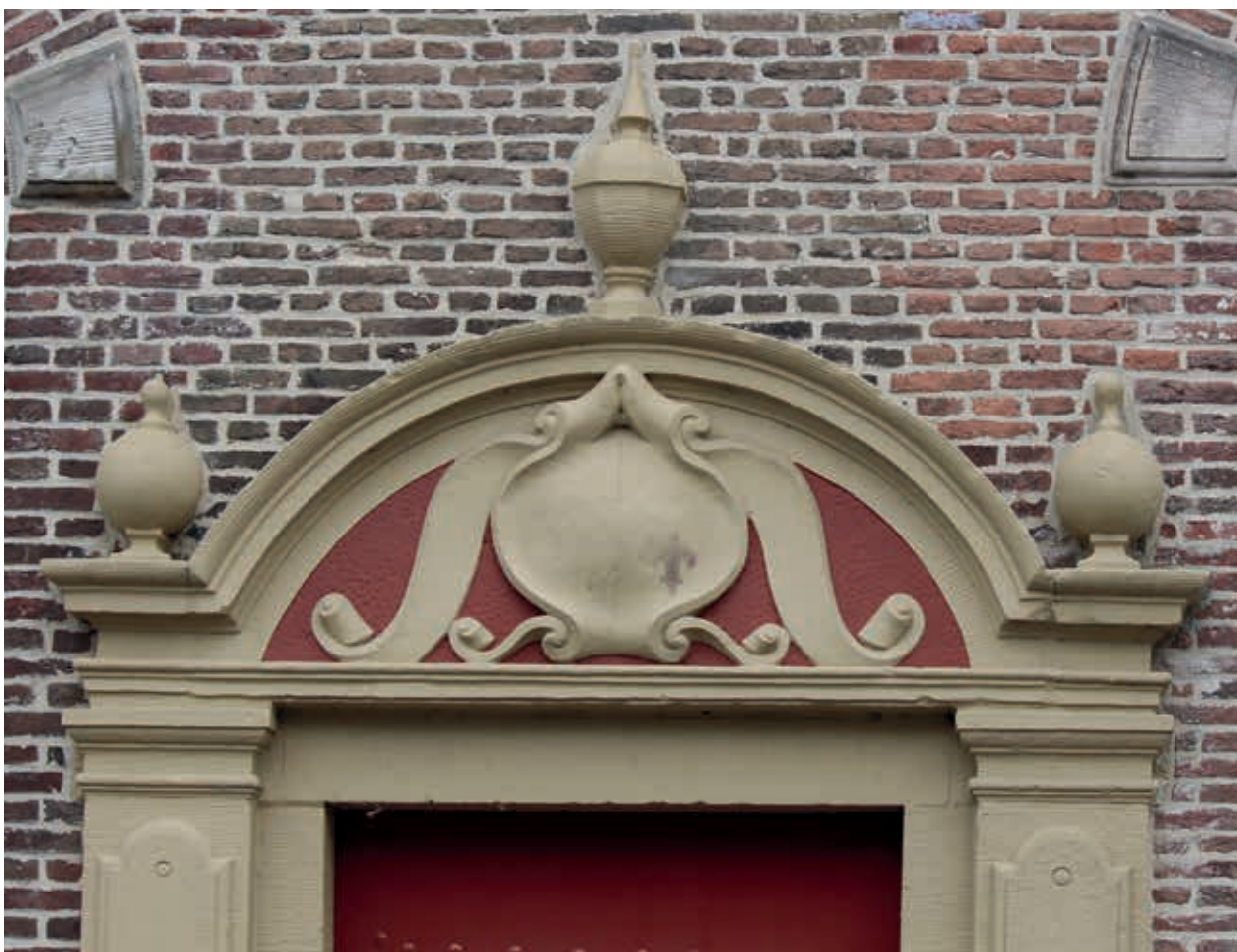
10. Bekroning van het ingangspoortje van Nieuwe Markt 8 in Kampen, waarschijnlijk behorend tot de doelen en uitgevoerd door Gerrit Lambertsen van Cuilenborch