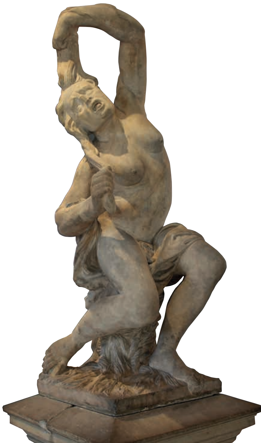
4. De Dolhuisvrouw, afkomstig uit het Amsterdamse Dolhuis, thans in het Rijksmuseum Amsterdam, toe te schrijven aan Gerrit Lambertsen van Cuilenborch

Elisabeth Neurdenburg schrijft nog een ander beeld toe aan de werkplaats van Hendrick de Keyser, in het bijzonder aan Gerrit Lambertsen: De Dolhuisvrouw , die momenteel in de zaal van Artus Quellinus in het Rijksmuseum te zien is (afb. 4). De vrouw lijkt – in hedendaagse termen – te lijden aan een manisch delirium, een motorische rusteloosheid die gepaard kan gaan met automutilatie. 'Niet alleen de figuur zelf, maar ook vier verschillende koppen van krankzinnigen, die aan elke zijde van het voetstuk als uit een raampje grijnzen, hebben steeds een sterken indruk gemaakt op allen, die het beeld bestudeerden', aldus Neurdenburg. 13 Deze vier hoofden symboliseren ver-