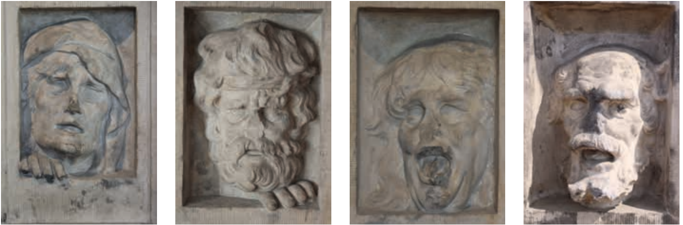
5. Voetstuk van het beeld de Dolhuisvrouw met op ieder van de vier zijden het hoofd van een krankzinnige in een deurluikje

in diverse fasen is uitgebreid en het beeld in de binnentuin stond opgesteld. Een datering in het midden van de zeventiende eeuw en een toeschrijving aan Artus Quellinus zijn minder waarschijnlijk. In navolging van A. Pit constateerde Hubert Vreeken bovendien dat de profilering van het voetstuk onder het Erasmusbeeld van Hendrick de Keyser uit 1622 treffend overeenkomt met dat van de Dolhuisvrouw. 15 Als 'tegenbeeld' van deze Dolhuisvrouw zou de omstreeks 1630 geschilderde versie van een verleidelijke naakte jonge vrouw van Salomon de Bray genoemd kunnen worden. Deze Jeu-ne femme vue en buste, se peignant is waarschijnlijk dus jonger dan de Dolhuisvrouw en bevindt zich in het Louvre. 16 Zij trekt met haar linkerhand een haarlok naar achteren, terwijl ze met haar rechter de blonde haarkruin kamt. De Bray en Lambertsen waren beiden in 1597 geboren en ontpopten zich als veelbelovend jong talent, genoten hun opleiding bij de 'vermaerste' meesters van Holland en trokken beiden de aandacht van de Deense koning. Gerrit Lambertsen zal zeker veel geleerd hebben van de zachtaardige, invoelende Hendrick de Keyser die 'gantsch willigh en bereydt om