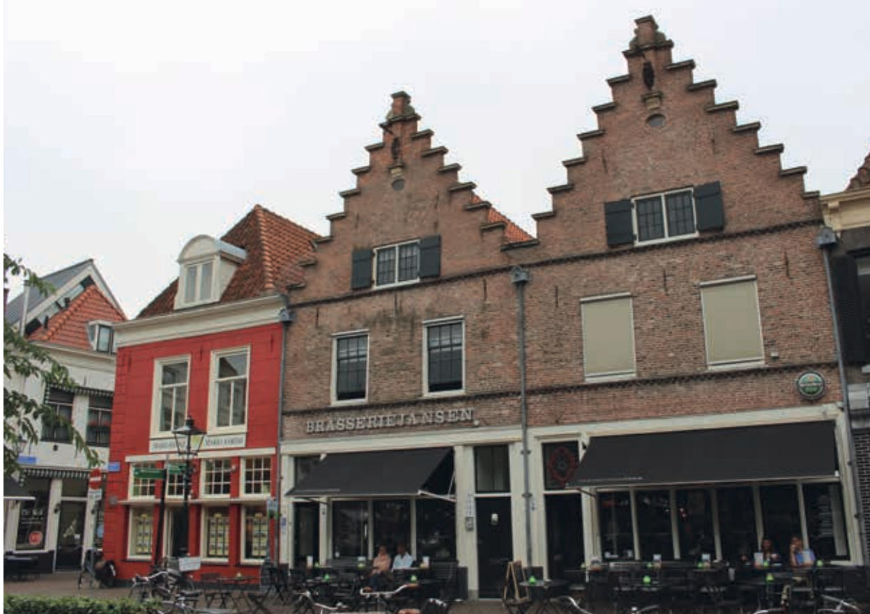
22. Huizen met identieke trapgevels aan de oostzijde van de Nieuwe Markt in Zwolle, ca. 1645