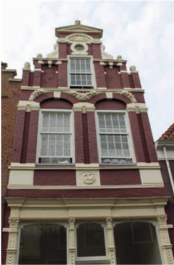
13. Voorgevel van Boven Nieuwstraat 100 in Kampen, tweede kwart zeventiende eeuw