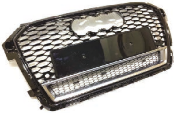
Afbeelding: Niet-origineel reparatie-onderdeel (grille) voor Audi auto's

vier cirkels nodig is om het Audi embleem te kunnen bevestigen.