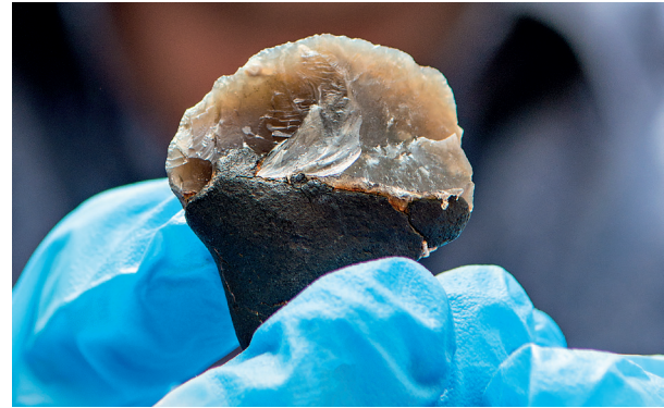
3. Vuurstenen mesje met greepje van berkenpek, 50.000 jaar oud, Zandmotor.

Als museum maakten we de eerste grote tentoonstelling hierover: 'Doggerland. Verdwenen wereld in de Noordzee'. Daardoor konden we die burgerwetenschappers en hun vondsten eindelijk op een voetstuk plaatsen, onder meer door levensgrote foto's van enkele strandstruiners met hun favoriete vondst. Presentatie leidt ook tot keuzes. Zo leverde zeldzaam goed bewaard DNA uit menselijke resten van Doggerland bewijs dat onze vroegste inwoners een donkere huidskleur en lichte ogen hadden. 31 Daar hadden we met een reconstructietekening van Kelvin Wilson al op voorgesorsteerd. Wetenschappelijk gezien bijzaak, maar in de media werd juist dat aspect ongenueanceerd uitgelicht, omdat het in sommige delen van onze samenleving gevoelig ligt dat onze vroegste voorouders geen roomblanke, blonde edelgermanen waren. Overigens was dat eerder bij de Britse mesolithische 'Cheddarman' net zo. 32 Met name de reacties op social media en fora als Geenstijl waren 'interessant'. Tegelijkertijd waren er andere geluiden. Sylvana Simons twitterde dat het 'omvolking' wel in een ander perspectief plaatste, evenals de sterke cartoon van Bas van der Schot. Onderbelicht bleef de eigenlijke vraag: waarom is een kleine mutatie op ons genoom en een idee over de huidskleur van onze voorouders zo belangrijk? Columnist Bert Wagendorp schreef: "zo worden gelukkig al onze zekerheden en daarmee ons zelfbeeld door de wetenschap ondergraven. De enige zekerheid is, dat 99,9 procent