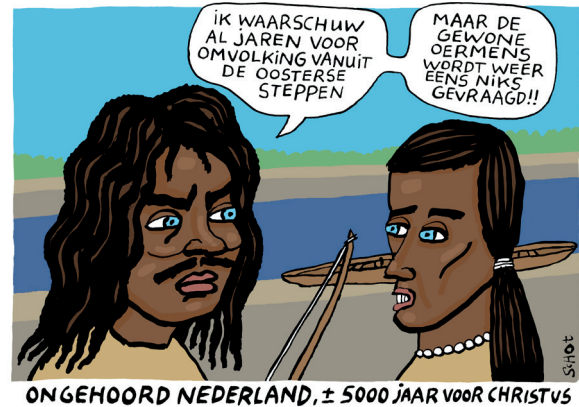
5. Cartoon over 'omvolking' in reactie op Nature -artikel over aDNA gegevens van jongpaleolithische tot neolithische bewoners van Europa, Volkskrant 14 maart 2023 (©Bas van der Schot).

We moeten belangrijke nuances verdedigen. Zo wilden we evenmin het risico lopen dat een verhaal over een miljoen jaar klimaat- en landschapsverandering zou dienen tot ontkenning van de enorme invloed die wij inmiddels daarop uitoefenen. We brachten de menselijke oorzaken van de huidige klimaatverandering en zeespiegelstijging dus expliciet onder de aandacht. Het laatste object was een krant uit 2020 die kopte