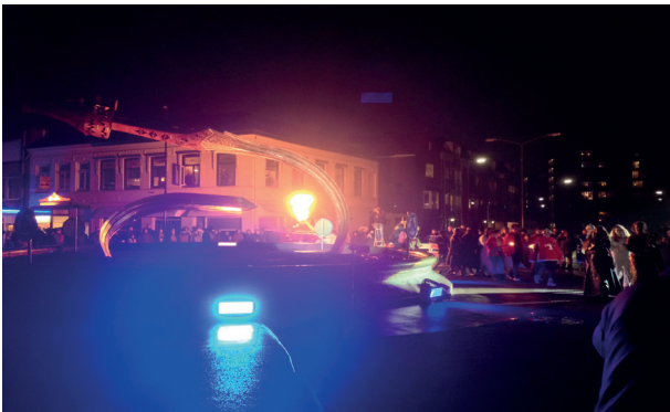
8. Onthulling met optocht van rotondekunst zwaard en situla Vorstengraf Oss (Luc Amkreutz/Rijksmuseum van Oudheden).

Het voorgaande laat zien hoe verbonden mensen zich voelen met specifieke materiële cultuur, hoe krachtig ideeën over verleden en herkomst zijn en dat mensen, materiële cultuur en plaatsen elkaar vormgeven. 40 Onze vergankelijkheid resonanceert met die van vergankelijke materiële cultuur, zoals het verpulverde kostbare textiel in het Vorstengraf, maar steekt ook schril af bij de tijdloosheid van grafheuvels, Stonehenge of kathedraal én ankeren in plaatsen, zoals Doggerland, Elsloo, of Oss. Materiële cultuur en plekken indexerend het voortschrijden van de tijd en maken het voor de immer vergankelijke mens mogelijk zich daartoe te verhouden. 41 The past is a foreign Country , zoals de Amerikaanse historicus Lowenthal duidde. Hij argumenteert dat net als de toekomst dat ongrijpbare verleden een integraal onderdeel van ons zelfbeeld is en net als verwachting herinnering elk moment van ons huidige zijn zin geeft. Het verleden is niet enkel om bij weg te dromen, maar neemt een essentiële positie in, in ons menszijn. Wie wij zijn heeft alles te maken met wie wij waren, of denken dat we waren. Zo legitimeert het verleden het heden en vinden we daarin een bevestiging van onze identiteit. 42,43 Het vormt het cement in de samenleving. Deze uiterst publieke kant van de archeologie raakt aan thema's als herkomst, gemeenschap, verbondenheid, vergankelijkheid en gedeelde culturele waarden.