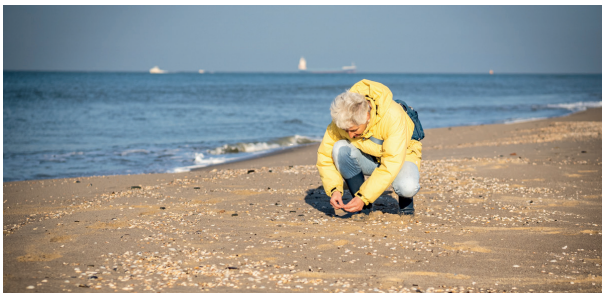
2. Op zoek naar vondsten uit Doggerland. Burgerwetenschap op het strand van de Zandmotor.

Een eerste voorbeeld betreft het onderzoek en de presentatie van Doggerland. 29 Doggerland is het gigantische verdwenen landschap onder de Noordzee dat de afgelopen miljoen jaar meestal droog lag. U kon van hier naar Engeland lopen, langs reusachtige rivieren samen met kudde mammoeten, rendieren en Neanderthalers. Een enorm prehistorisch terra incognita dat 8000 jaar geleden onder de golven verdween door klimaatverandering en zeespiegelstijging (waar kennen we dat van?). In de wetenschap leidde Doggerland een abstract bestaan. Vondsten in vissersnetten getuigden van menselijke aanwezigheid, maar het gebied werd vooral gezien als een brug naar de Britse eilanden. Dat veranderde door nieuwe onderzoekstechnieken, doordat het een naam kreeg, 'Doggerland', en door grondstofwinning en zandopspuitingen, voornamelijk aan de Nederlandse kust. Die leverden inmiddels duizenden vondsten op die het belang ervan op de kaart zetten, waaronder de eerste Neanderthaler en oudste moderne mens van Nederland, en de oudste lijm: een 50.000 jaar oud vuurstenen mesje met een greepje van berkenpek. 30 Allemaal gevonden en gemeld door amateurarcheologen.