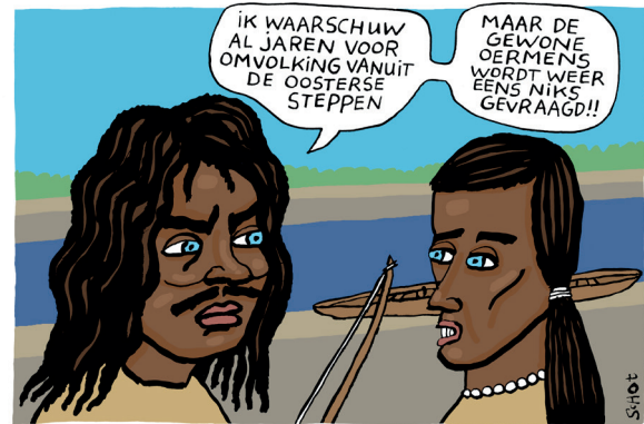
ONGEHOORD NEDERLAND, ± 5000 JAAR VOOR CHRISTUS

We moeten belangrijke nuances verdedigen. Zo wilden we evenmin het risico lopen dat een verhaal over een miljoen jaar klimaat- en landschapsverandering zou dienen tot ontkenning van de enorme invloed die wij inmiddels daarop uitoefenen. We brachten de menselijke oorzaken van de huidige klimaatverandering en zeespiegelstijging dus expliciet onder de aandacht. Het laatste object was een krant uit 2020 die kopte