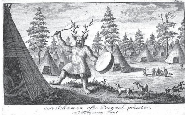
11. Ets van Nicolaas Witsen van een Siberische sjamaan tijdens zijn reis (1692) door die gebieden (Witsen 1705).

Ik weet dat ik er minutenlang voor heb gestaan en minstens twee keer terugliep naar de vitrine waar hij stond. Alle details wilde ik in mij opnemen, niet van een plaatje, nu in het echt. De gespannen houding, met gebogen armen, de rare mengvorm met mens- en roofdiertrekken, het katachtige gezicht, vriendelijk of gevaarlijk. De meeste theorieën plaatsen dit stuk in een rituele sfeer. Het samengaan van mens-diertrekken, een Misch- of fabelwezen, wordt vaak in verband wordt gebracht met sjamanen en sjamanistische praktijken. Het is dan ook aannemelijk de leeuw mens een religieuze of cultische rol vervulde. 93 Een voorwerp, een boodschapper uit een ver verleden die je aan het denken zet. Het was magisch.