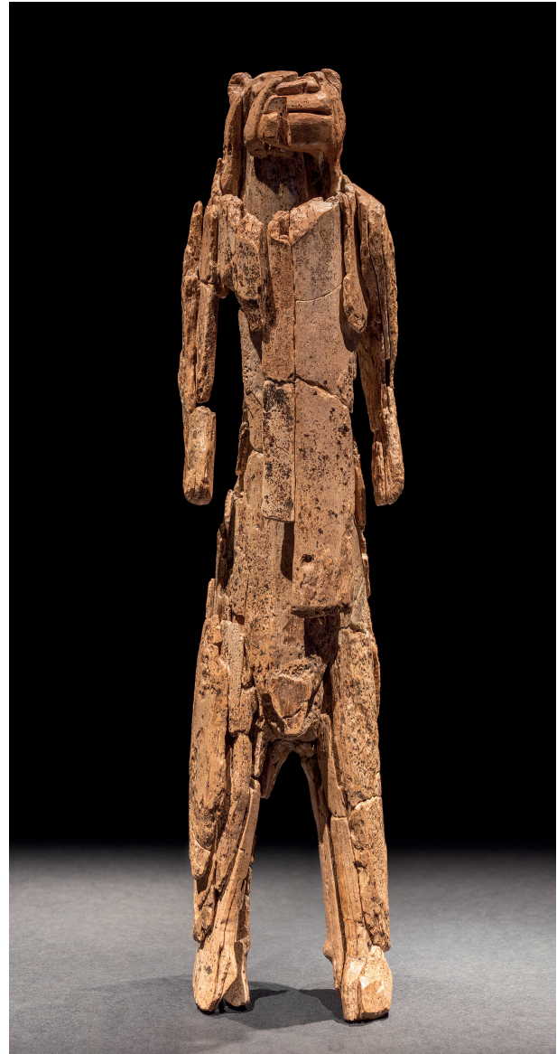
12. De Löwenmensch, gesneden uit een mammoet stootand 41-35.000 jaar geleden.

Het beeldje omvat in al zijn eenvoud al die aspecten van Public Archaeology die ik net de revue heb laten passeren: het vertelt een verhaal uit de moderne geschiedenis met zijn ontdekking in een grot in de Schwäbische Alb aan de vooravond van de Tweede Wereldoorlog. Het vertelt een verhaal over onderzoek, restauratie en wetenschap: door nieuwe onderzoeksmethoden en denkkaders geeft dit beeldje steeds meer informatie prijs over de wereld waarin het gemaakt werd. Een wereld waarin de vroegste moderne mensen hier in ijstijd-Europa hun weg zochten, hier bleven, zich staand houdend in een veranderende