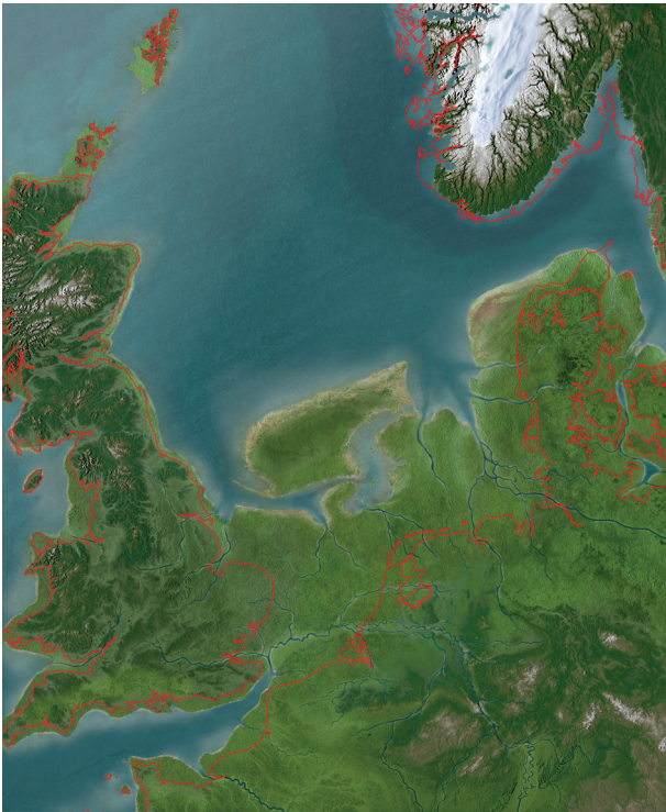
9. Doggerland ca. 10.000 jaar geleden met een zeespiegelstijging van 70 cm per eeuw (Olav Odé/Rijksmuseum van Oudheden).

verdrinkende land wijzen naar 12.000 jaar geleden. Hetzelfde moment waarop hier Doggerland verdwijnt. Zij hebben dus een actieve herinnering aan land dat anders was, besef van een omgeving die leeft en waar zij onderdeel van zijn. Wij niet meer. Archeologie - en met name prehistorische archeologie vormt een krachtige discipline die ons bewust maakt van een dynamische omgeving en gereedschap kan bieden voor het hervinden van een nieuwe relatie daarmee. Leidse initiatieven zoals Archeologists4Future bieden plaats voor dit soort discussies en zijn zeer toe te juichen.