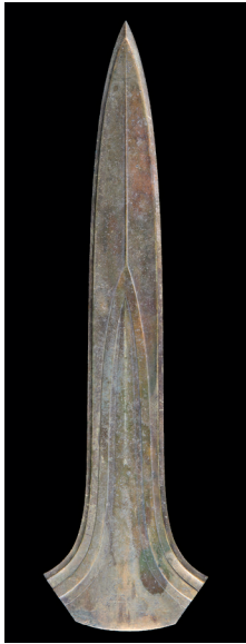
7. Het zwaard van Ommerschans, ca. 1350-1100 v.Chr. (Rijksmuseum van Oudheden).

gered, maar 'een drenkeling neem je ook niet mee naar huis' schreven ze. Op de grens van ludieke actie en serieus sentiment vormde datzelfde verbindend erfgoed ineens een splijtzwam.