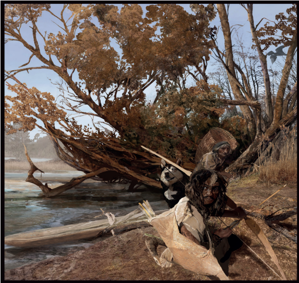
4. Impressie van laatmesolithische jager-verzamelaars in verdrinkend Doggerland.

van het dna van alle wereldburgers overeenkomt en dat we daar eindelijk een keer de juiste conclusies betreffende ras en etniciteit uit moeten trekken. 33 Belangrijk vind ik dat deze aandacht helpt sociale thema's te agenderen en vastgeroeste beelden doet kantelen, met name in het onderwijs. Zo had ik contact met Kidsweek dat meer volwassen en genuanceerd erover berichtte dan veel andere media. 34 Onlangs werkten we mee aan een Klokhuisaflevering over Trijntje en aan een nieuwe publieksplaat voor het eerste canon-venster, waar ze nu ook een donkere huidskleur heeft.