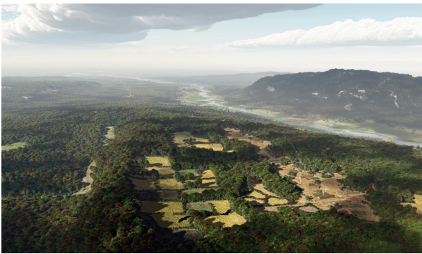
6. Impressie van de bandkeramische nederzetting Cannerberg bij Maastricht. Oerboeren of het begin van de stikstofproblematiek (Mikko Kriek/Rijksmuseum van Oudheden).

professor Modderman uitgebreid had bemonsterd, konden we alsnog modern fysisch-antropologisch en chemisch onderzoek doen. Daarbij viel op dat van de crematiegraven die waren toe te wijzen, juist de vrouwengraven meer dissels en aardewerk bevatten dan de mannen. Tevens bleek dat de rijkste graven van oudere vrouwen waren. De stoere mannelijke boerenkrijger met dissel liep hier toch averij op, net als de vastgeroeste onderzoekskaders en rolpatronen waarbinnen we lang werken. Dergelijke ontdekkingen onderstrepen dat het riskant is grafinventarissen te zien als persoonsgebonden objecten. The dead do not bury themselves , is een bekend adagium: we kijken juist naar gelaagde en complexe handelingen van nabestaanden. Inmiddels hebben de Graetheideregio, Maastricht en buurgemeenten de bandkeramiek omarmd als een mogelijk krachtig middel voor regional branding , werktitel: ‘Oerboeren’. De bandkeramiek als merk en opnieuw als verbinder van gemeenschappen, zeventuizend jaar later. Een spannende gedachte. Maar het roept ook interessante vragen op, want het zal niet bij fietsroutes blijven. Hoe gaat een wethouder de Limburgse oerboeren presenteren: als succesvolle migranten, wat ze waren? Oervaders van de stikstofproblematiek, of oorspronkelijk boerenland? Ook dit is een ongrijpbare factor. Erfgoed is nostalgisch en makkelijk te manipuleren. 37 Dat blijkt ook uit mijn laatste voorbeeld.