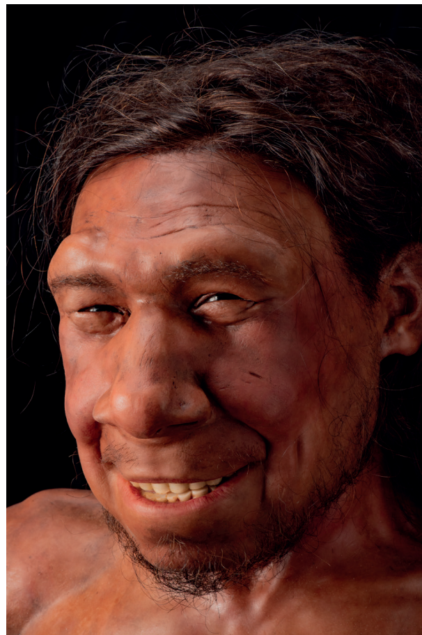
10. Reconstructie van Neanderthaler ‘Krijn’ door de gebroeders Kennis (Rijksmuseum van Oudheden).

Dit alles herinnert me aan wat millennia lang wellicht de belangrijkste personen in vroege gemeenschappen waren: sjamanen. De sjamaan kan door gebruik te maken van trance een andere staat van zijn bereiken en reizen tussen de eigen wereld en de mythologische wereld van de geesten en daar communi-