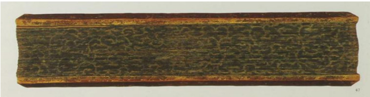
Gambar 1. Naskah lontar Caritanira Amir (Sumber: Galoop and Arps 1991, 78).

Salah sebuah obyek penelitian filologis yang konvensional adalah naskah tulisan tangan. Walau sebenarnya terlalu terbatas, bahkan filologi sering diidentikkan dengan pengkajian naskah. Memang naskah merupakan jenis artefak yang cocok untuk diteliti dengan pendekatan filologis, terutama karena dia sebuah benda yang maujud material, yang dibuat dengan jerih payah oleh manusia, yang dapat menyimpan teks dan yang mudah rusak atau hilang (sehingga menjadi langka) tapi pada sisi lain dapat juga disimpan sampai berabad-abad. Dengan demikian seringkali naskah lama dinilai mempunyai semacam bobot atau otoritas budaya sehingga pantas dijadikan obyek penelitian. Naskah itu sebuah artefak yang kaya sehingga penelitiannya dan pemahamannya dapat membuahkan kepuasan akademis dan intelektual.