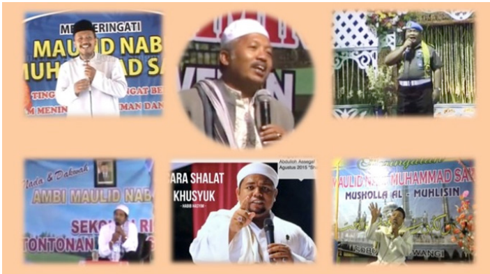
Gambar 2. Beberapa da'i di Banyuwangi yang biasa menggunakan bahasa Osing (sumber: Youtube).

bahasa Jawa tetapi memiliki berbagai ciri yang khas. 11 Pemilihan bahasa dalam praktik dakwah tidak secara mutlak mencerminkan penggunaan ragam bahasa pada masyarakat setempat. Kebanyakan da'i di daerah Banyuwangi berdakwah dengan menggunakan bahasa Indonesia dan Jawa. Formula-formula awal, penutupan, dan kutipan-kutipan Alquran dan hadis tentu berbahasa Arab. Bahasa lokal seperti Madura dan Osing merupakan pengecualian dalam repertoir kebahasaan pendakwah yang aktif di Banyuwangi.