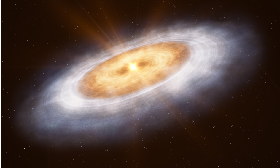
Figuur 3: Artistieke afbeelding van een warme protoplanetaire schijf. Dichtbij de ster in het oranje gebied is het warm waardoor bijna alle moleculen, inclusief water, in de gasfase zijn. Verder weg van de ster is de schijf kouder (witte gebied) en is water bevroren. De overgang tussen deze twee gebieden is de watersneeuwlijn. De ringen in deze schijf zouden veroorzaakt kunnen worden door onder andere planeten. Afbeelding van ESO/L. Calçada.

van de schijf op de ster vallen. Een andere manier om hoekmoment te verplaatsen is door een wind vanaf het oppervlak te laten waaien. Dit kan als een magnetisch veld aanwezig is en het gas in de bovenste lagen geïoniseerd is. De hoeveelheid gas die met de wind meegevoerd wordt is klein maar het hoekmoment hiervan is relatief groot. Hierdoor kan de rest van de schijf verder evolueren.