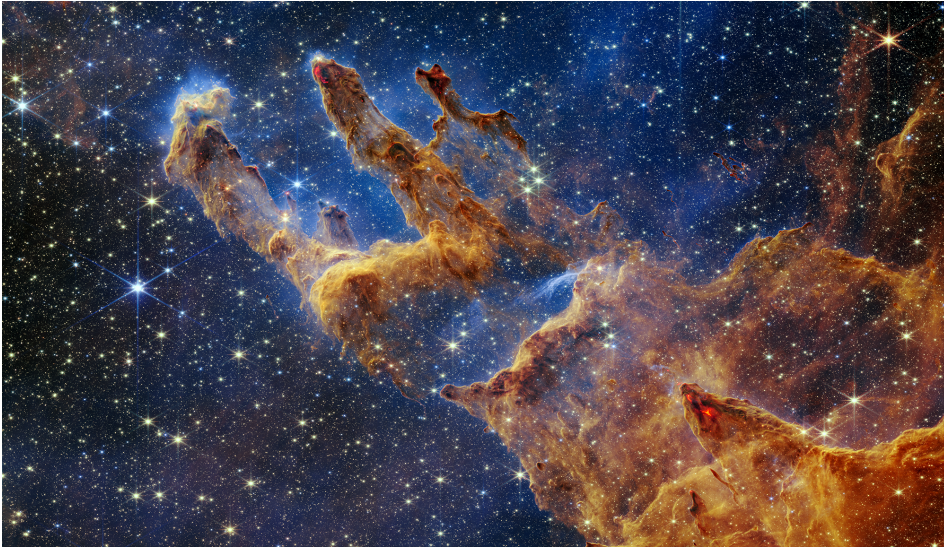
Figuur 1: Infrarood waarneming met JWST van de pilaren van creatie, een gigantische moleculaire wolk. In de donker bruine, compacte gebieden vormen jonge sterren.

processen kunnen een rol spelen. Dit proefschrift onderzoekt de oorzaak van deze structuren – planeten, een verandering in de dichtheid, of chemie – door te kijken naar verschillende moleculen in de gasfase en deze te vergelijken met het stof.