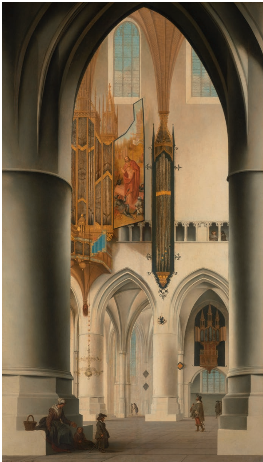
Interieur van de Sint-Bavokerk in Haarlem met zicht op het orgel (door Pieter Saenredam, 1636).