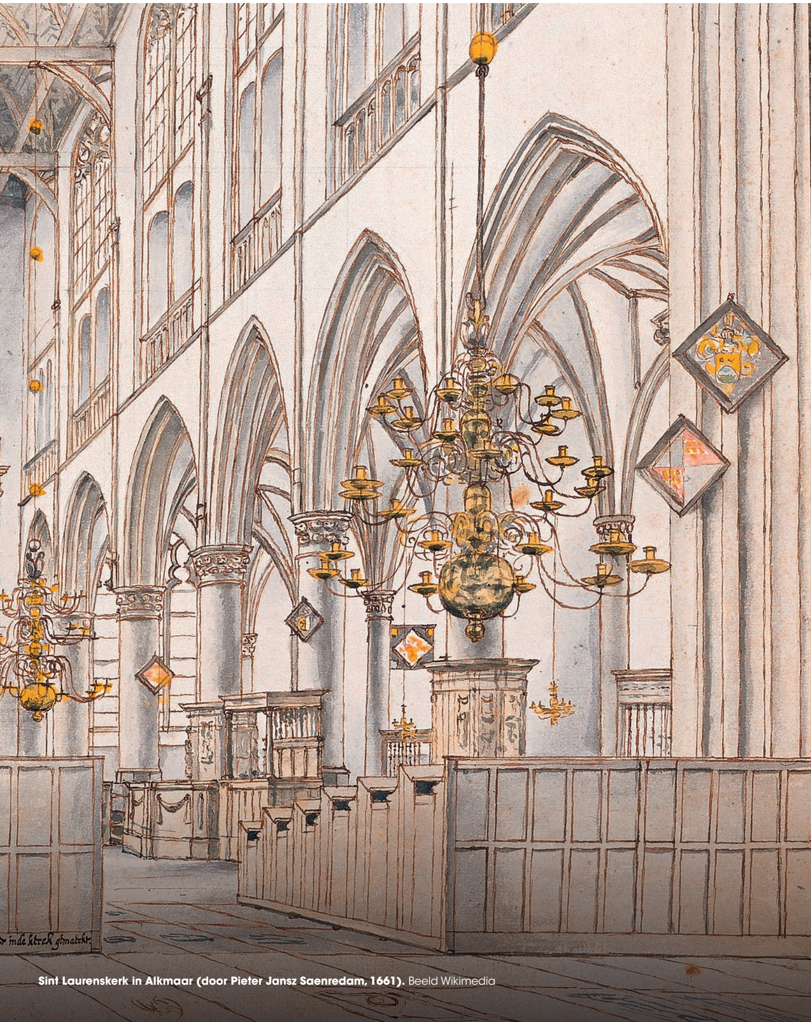
Sint-Laurenskerk in Alkmaar (door Pieter Jansz Saenredam, 1661).