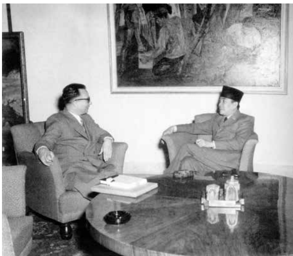
Goedhart schenkt Sukarno enkele boeken, 6 juli 1947.

Dat blijkt ook uit een andere ontmoeting, in Malang. In zijn hotel aldaar wordt 't Hoen opgezocht door een oude gepensioneerde Indonesische leraar die in Leiden heeft gestudeerd. Hij houdt van Nederland en stelt veel vragen over Nederland en de bezetting. Inmiddels is hij directeur van de HBS geworden omdat er in de Republiek behoefte is aan intellectuele kracht. Aanvankelijk stond de oudere Indonesiër sceptisch tegenover de Republiek, maar het hachelijke experiment dat op 17 augustus begon, is volgens hem in