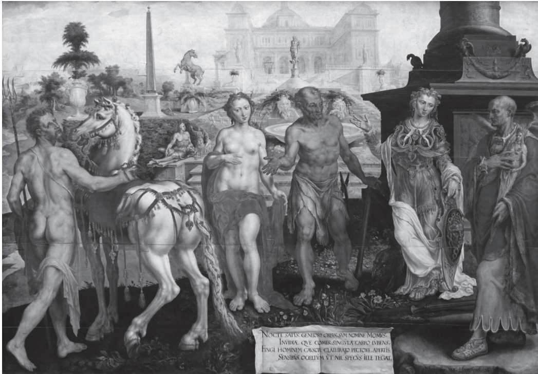
'Momus bekritiseert het werk van de goden' (1561) van de Nederlandse schilder Maarten van Heemskerck (1498-1574). In vroegmodern Europa stond Momus symbool voor zowel hyperkritiek als godsdienstkritiek.