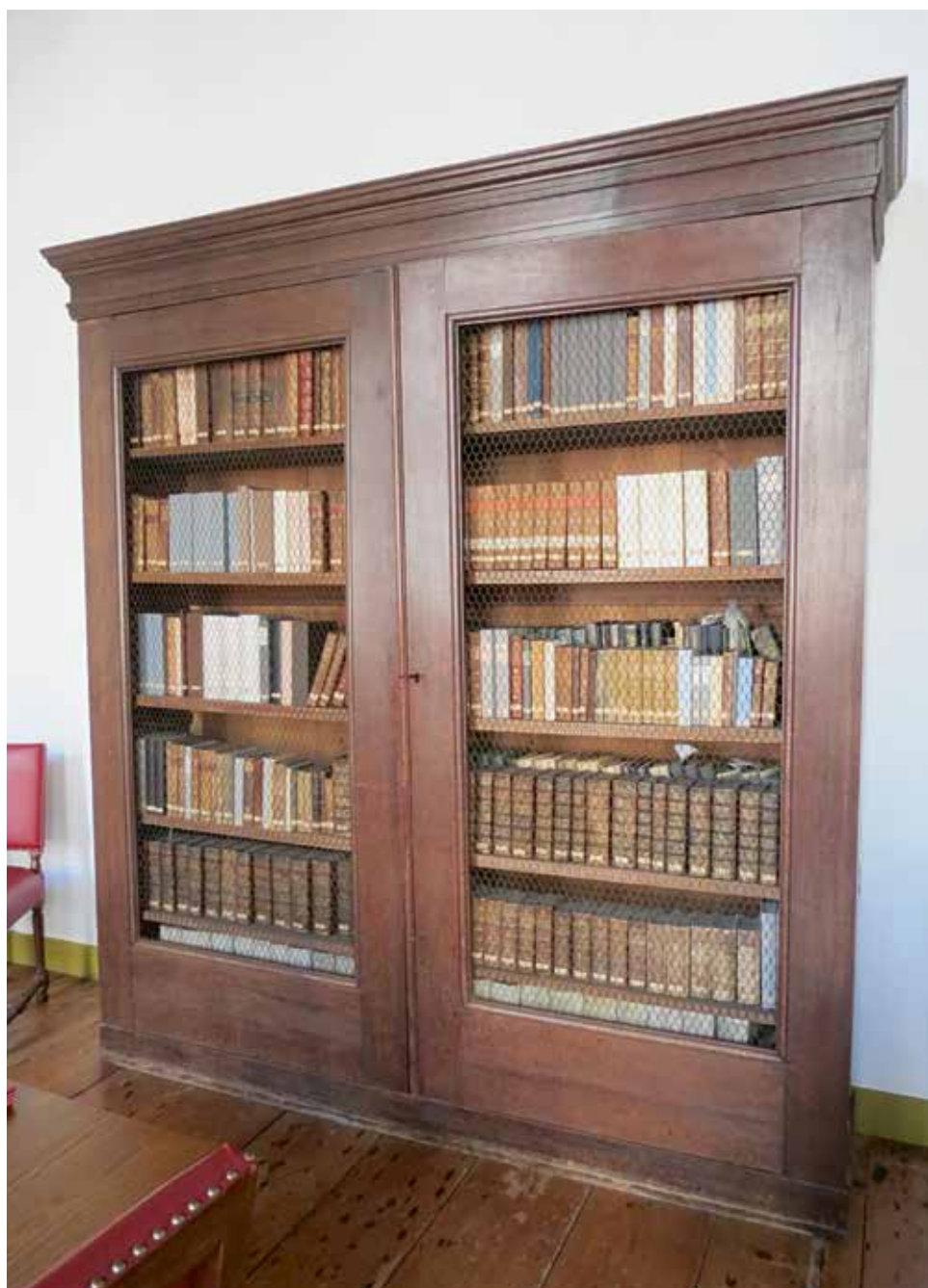
Kast van de Swedenborg-collectie op de begane grond van de Bibliotheca Thysiana.

wetenschap'; 'geheime wetenschap'; 'wis- en sterrekunde'; 'bedrijven en handwerken'; 'Oosterse letteren'; 'Griekse en Latijnse letteren'; 'nieuwere letteren'; 'geschiedenis'; 'hulpwetenschappen van de geschiedenis'; 'land- en volkenkunde'; 'kunst'. Deze categorieën bieden onderzoekers nog steeds een uitstekende ontsluiting van de collectie, temeer daar er allerlei subcategorieën zijn, zoals in de rubriek wis- en sterrekunde: 'in het algemeen', 'rekenkunde, algebra', 'meetkunde; mechanica', 'sterrekunde; gnomonica; optica'. Wel is het zo dat in deze catalogus nog veel titels van latere datum beschreven zijn, die in de twintigste eeuw om uiteenlopende redenen uit de collectie verwijderd zijn, het meest ingrijpend tijdens de laatste restauratie van het bibliotheekgebouw in 1997-2000. Goed bewaard is gelukkig de omvangrijke en voor Nederland unieke collectie van geschriften van en rond de Zweedse mysticus Emanuel Swedenborg (1688-1772), omdat deze van oudsher in een aparte kast werd bewaard (afb. hierboven). In de catalogus van Tiele wordt deze en bloc beschreven. 11