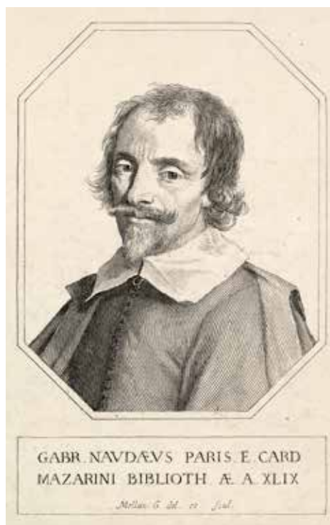
Portretgravure van Gabriel Naudé. Metropolitan Museum of Art, New York.