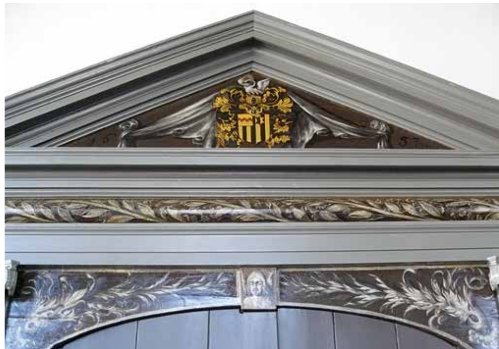
Wapen van de familie Thysius boven de oorspronkelijke archiefkast in de zaal op de eerste etage.

Ten slotte speelde zonder twijfel ook familietrots een rol bij het stichten van de Bibliotheca Thysiana. Niet voor niets worden de façade en het interieur van de bibliotheek gesierd door Thysius’ familiewapen, in het geval van het interieur passend boven de kast waarin het familiearchief werd bewaard 6 (afb. hieronder). Het