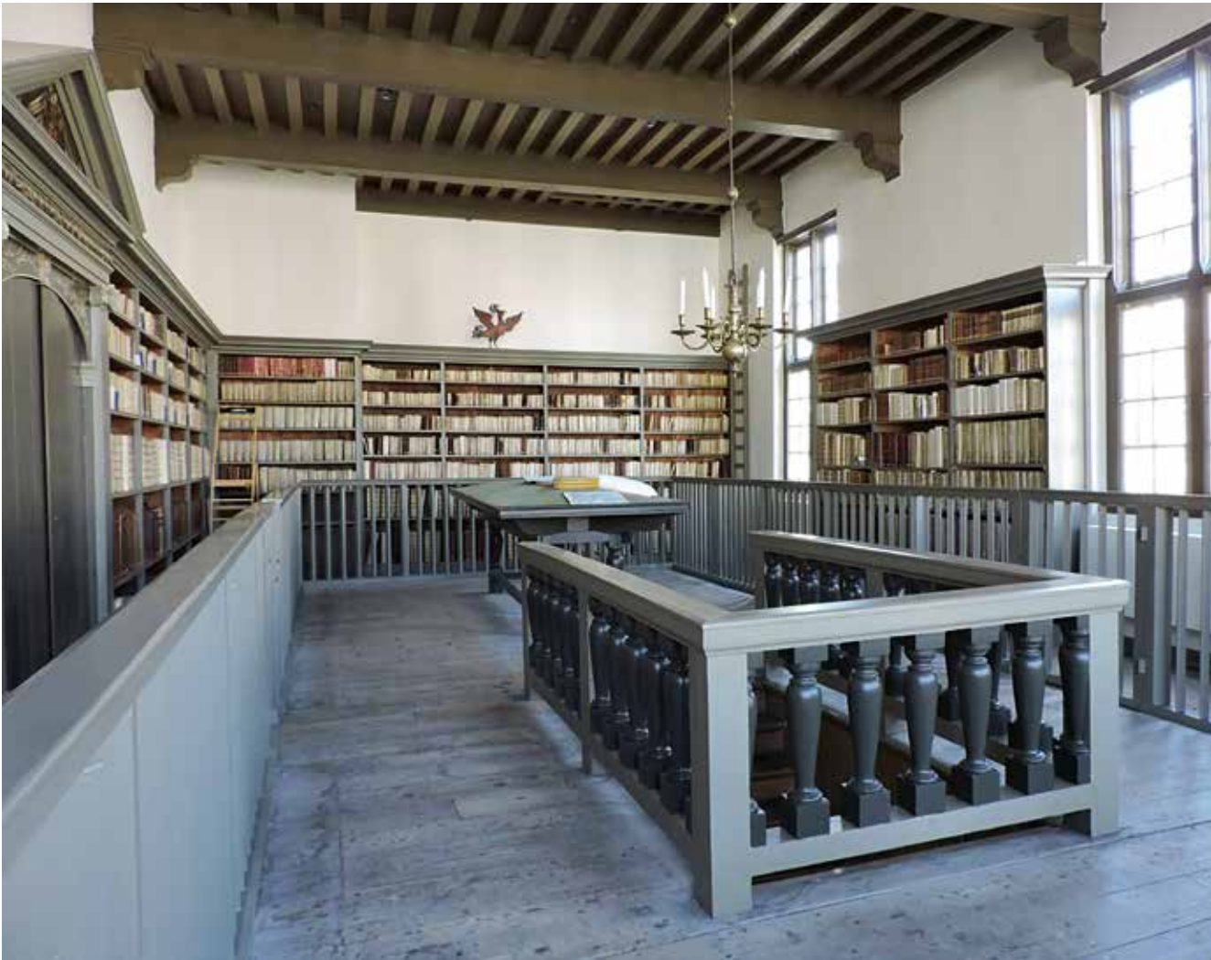
Interieur van de bibliotheekzaal op de eerste etage van de Bibliotheca Thysiana.