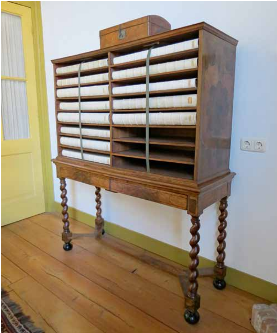
Het kastje van de Blaeu-atlas op de begane grond van de Bibliotheca Thysiana.