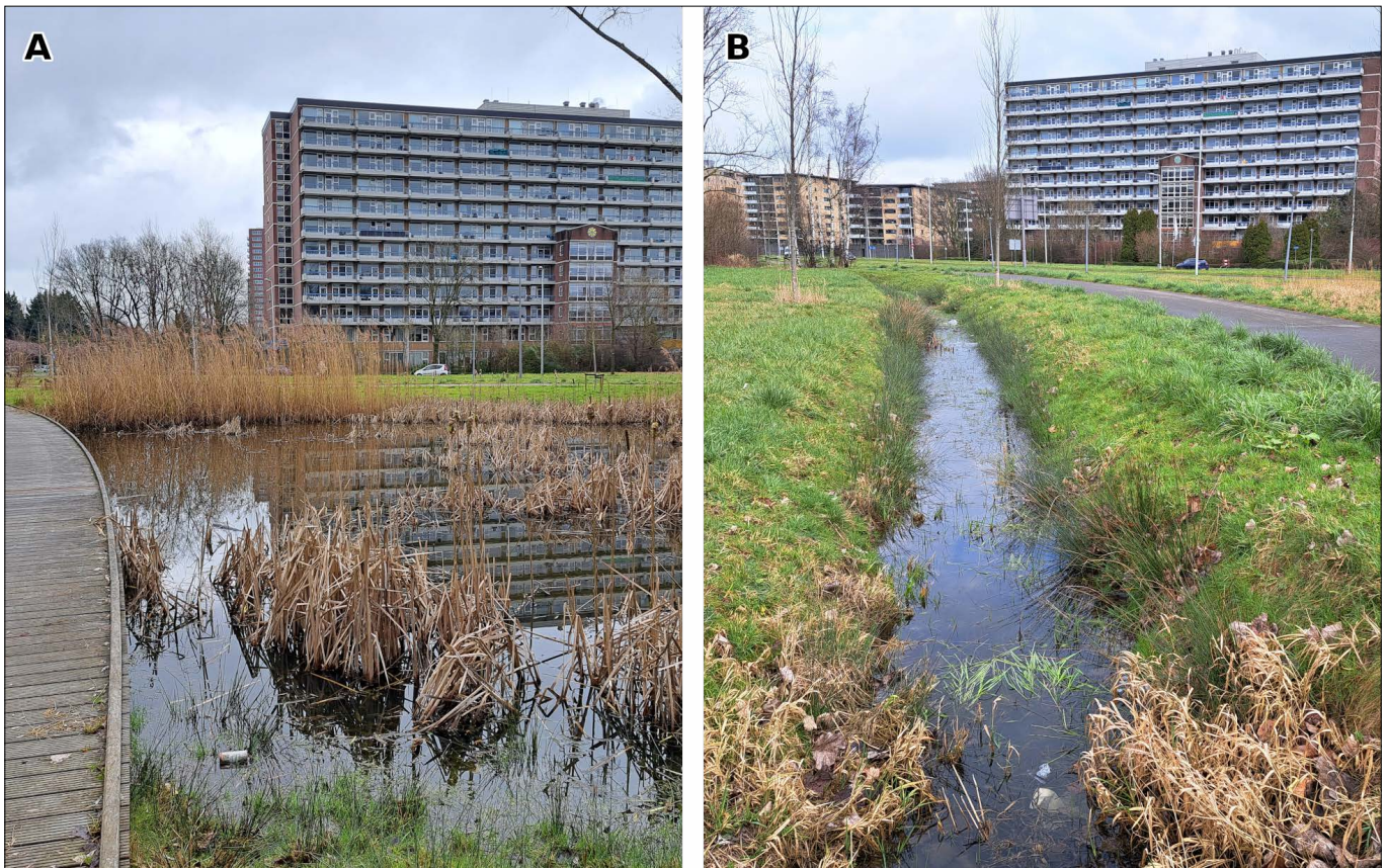
▲ Twee verschillende waterlichamen in Park de Twee Heuvels dicht bij de bebouwing van de wijk IJsselmonde: (A) amfibieënpool, (B) afwateringsgreppel. De flat op de foto's is gelegen aan de Ravenswaard. (Jordy van der Beek)

1. De steekmuggengemeenschap van stadstuinen . Dit zijn muggen die zich thuis voelen in kunstmatige waterhoudende voorwerpen, zoals bloempotten, emmers, niet afgesloten regentonnen, putten met een permanent laagje water en verstopte dakgoten. Hierin treffen we uitsluitend soorten van de Culex pipiens -groep en Culiseta annulata aan, die hier profiteren van een volledig roofdiervrije omgeving. Dit zijn soorten die 's nachts actief zijn, en als enkele van de weinige soorten binnenshuis bijten (data afkomstig van Muggenradar, WUR 2022). Overlast van de muggen die binnenshuis aanwezig zijn is dus vaak op te lossen door stilstaand water in tuinen en elders rondom het huis te voorkomen. Het zijn ook de dominante soorten muggen in de sterk versteende delen van de stad. In tuinvijvers met veel vegetatie worden soms muggen uit sloten en vijvers aangetroffen (de tweede gemeenschap).