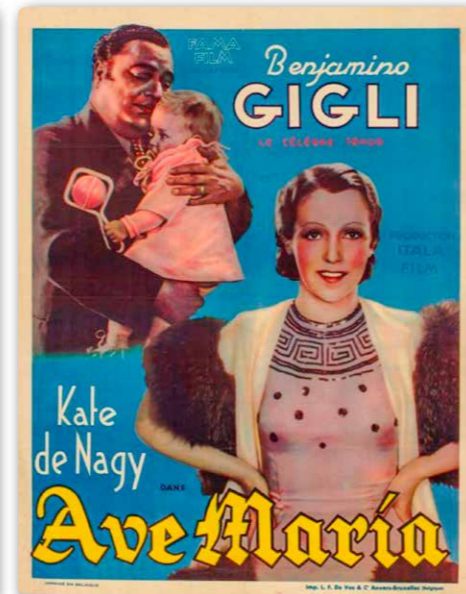
Filmposter Ave Maria (1936)

gedenkt een plaquette nog de plek waar admiraal Pavlos Koundouriotis, bevelhebber op het iconische fregat 'Averof', aan land stapte. Ik lees erover op een van de vele informatiepanelen die door het stadsbestuur voor bezoekers zijn neergezet. Via een QR-code wordt nog meer van het verleden toegankelijk gemaakt, in het Grieks én Engels.