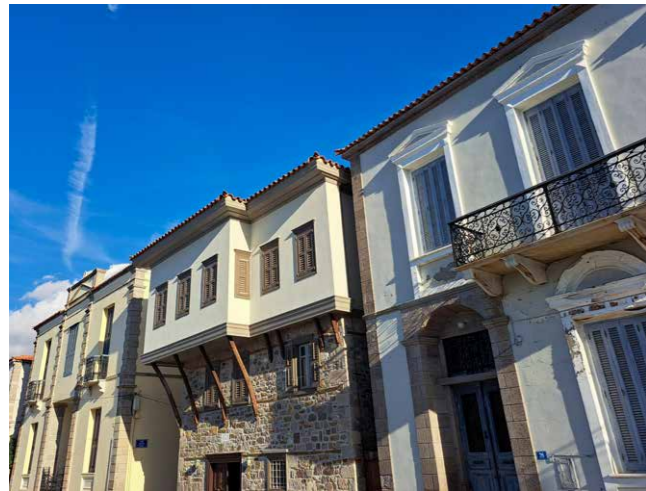
Promenade van Grieks-Egyptische herenhuizen in Myrina