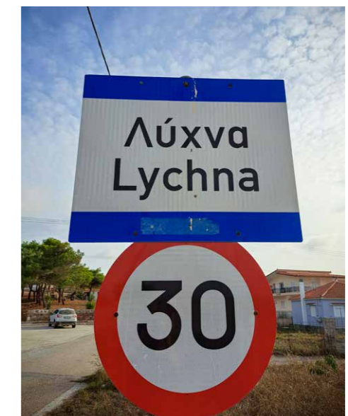
Dorp Lychna op Limnos

Dan toch naar het vliegveld, voor de enige vlucht die er die dag vertrekt. Ik ben vroeg en rijd nog een stukje door, tot een pittoresk dorpje met een opvallende naam: Ta Lychna (de 'Lichten'). Als dat geen teken is! Dit wordt een verhaal voor Lychnari, met een duidelijke boodschap: Limnos is een prachtige herfstbestemming, vol verrassingen en zonder drukte. Hier kom ik zeker terug. 🐾