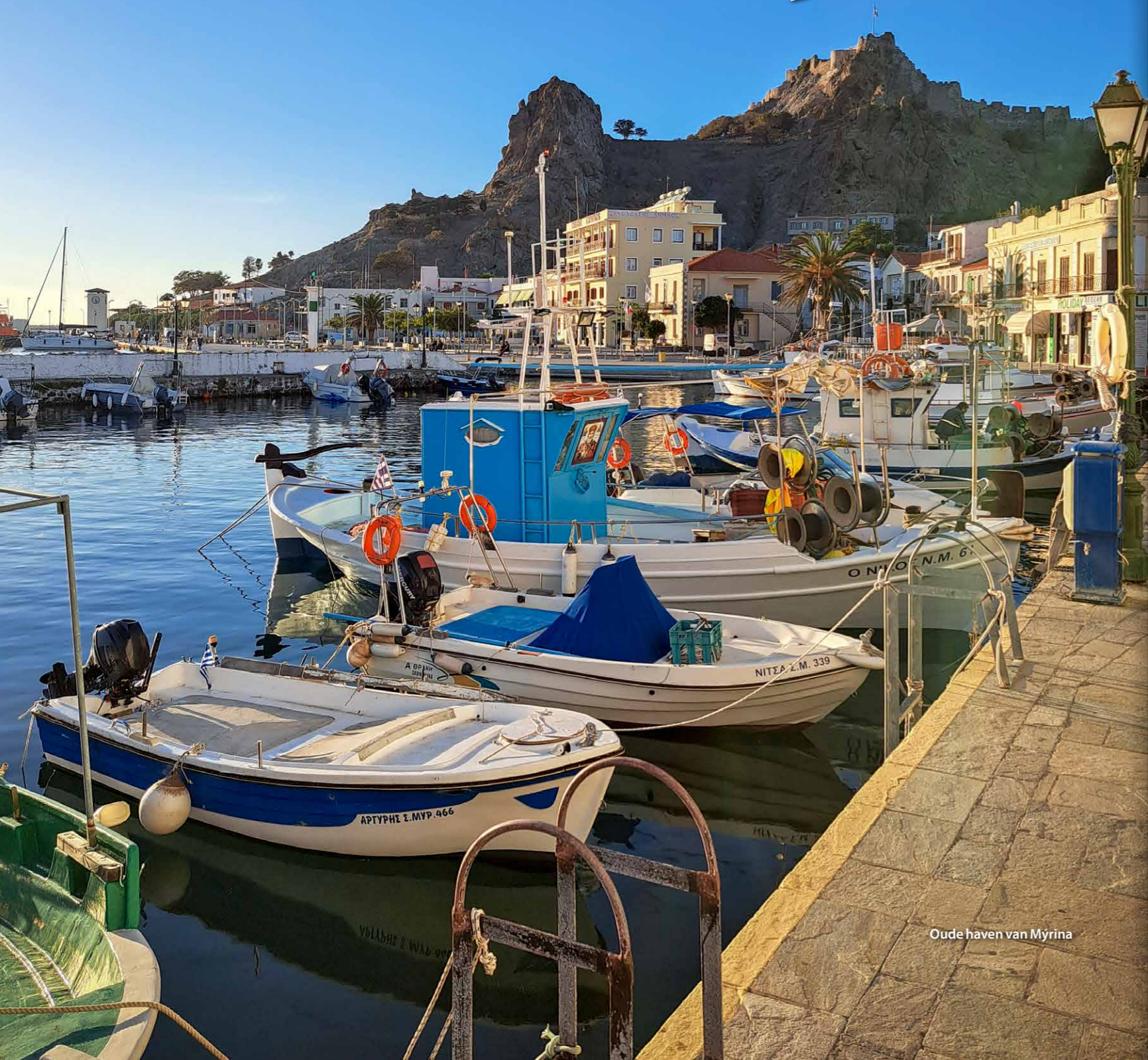
Oude haven van Myrina