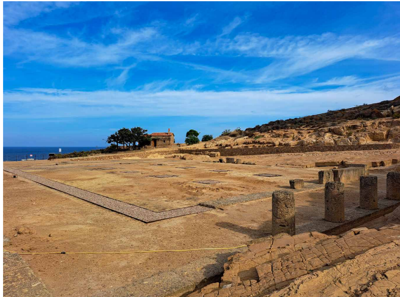
Heiligdom van de Kabeiren