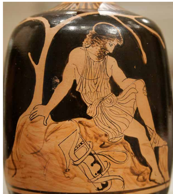
Philoctetes op Limnos. Roodfiguurige Attische vaas, ca. 460 v.Chr. (Metropolitan Museum of Art)