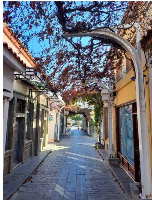
Kidastraat in novemberrust

Myrina strekt zich uit aan weerszijden van een in zee stekende kaap, die het oude centrum in twee buurten verdeelt: de 'Turkse kust' (Τούρκικος Γιαλός), de voormalige Ottomaanse wijk, en de 'Romeinse kust' (Ρωμείκος Γιαλός) – waar de Byzantijnse en latere Grieken (die zich Romií noemden) woonachtig waren. De laatstgenoemde buurt kent een schitterende boulevard met 19 e - en vroeg 20 e -eeuwse herenhuizen, die getuigen van de maritieme welvaart die Myrina in die periode kende. Veel rijke kooplieden hadden banden met Egypte en de Levant. De promenade biedt heden ten dage plaats aan diverse terrassen en (vis)restaurants, vanwaar in de namiddag het silhouet van de heilige berg Athos te zien valt.