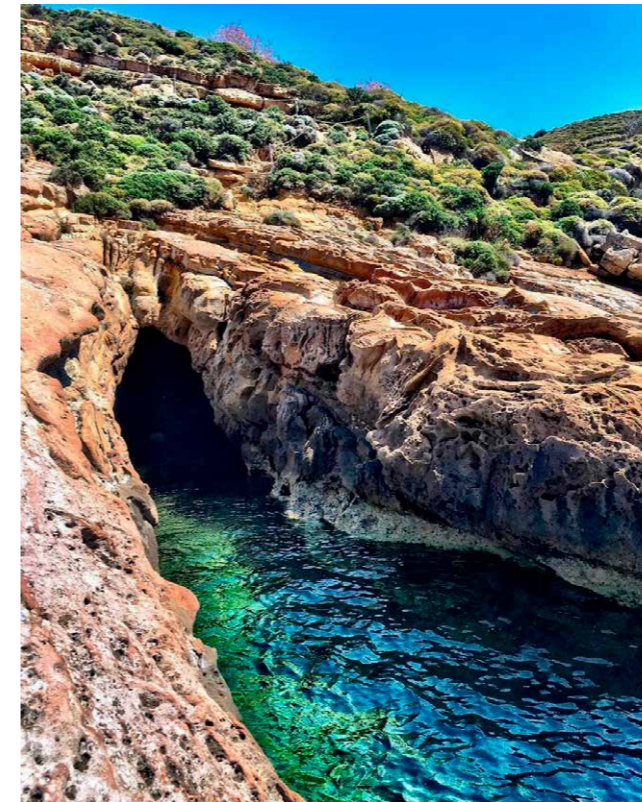
Grot van Philoctetes

Limnos blijft verrassen. Een volgende afslag voert van de doorgaande hoofdweg naar de ruïnes van Palaiopolis/Hephaistia, ooit – tussen 800 en 600 v.Chr. – de grootste stad van het eiland. De tocht naar het schiereiland voert over stonige zandwegen en vergt het uiterste van de huurauto. Ik twijfel of ik om moet keren, maar de bekoring van de Oudheid wint het van een mogelijke schadediscussie met de autover-