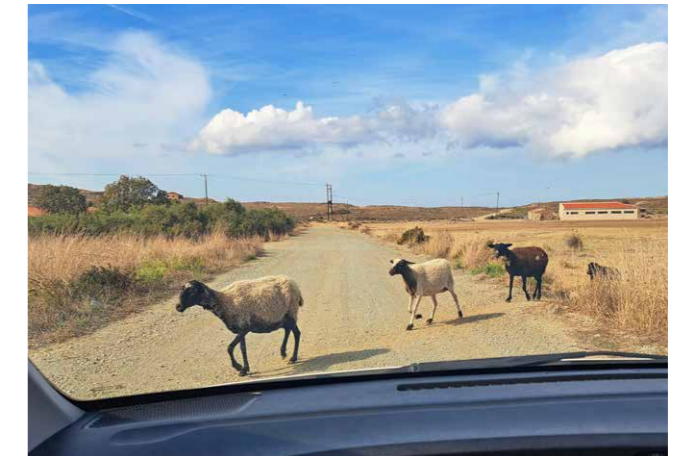
Geiten op de weg naar Hephaistia

Buiten de dorpskern ligt een van de geallieerde begraaf-