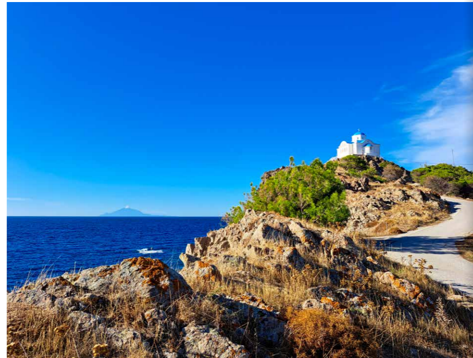
Nicolaaskerk met zicht op Athos

Hotel Archondikó doet zijn naam eer aan en is gevestigd in een schitterend gerestaureerd pand, omringd door kleine keienstraatjes. Ik zet snel mijn bagage weg en trek er weer op uit, in de voetsporen van de geschiedenis. Ver hoef ik niet te gaan. Limnos werd op 8 oktober 1912, tijdens de eerste Balkanoorlog, door de Griekse vloot 'bevrijd' van de eeuwenlange Ottomaanse overheersing en aansluitend bij Griekenland gevoegd. Aan het einde van de promenade