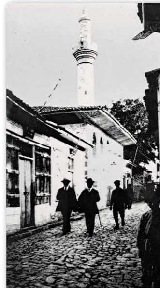
Marktmoskee, circa 1920