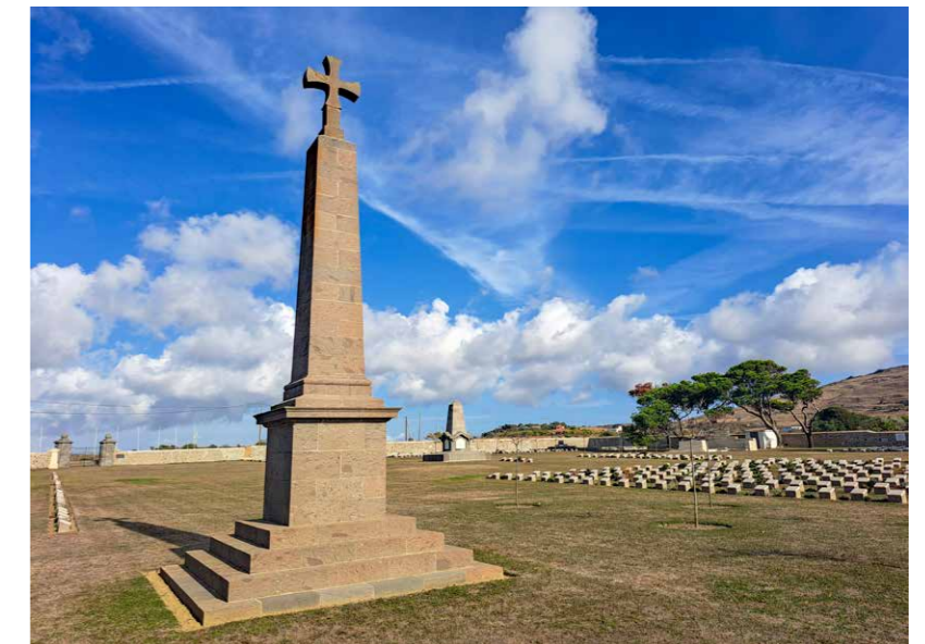
Geallieerde begraafplaats van Moudros

plaatsen die het eiland rijk is. Hier liggen zo'n 900 Engelse, Australische, Nieuw-Zeelandse, Canadese en Indiase soldaten begraven die hun leven gaven in een conflict ver van huis. De graven zijn keurig uitgelijnd en het terrein wordt onberispelijk bijgehouden. Als ergens van een 'historische beleving' sprake is, dan toch wel hier. De teksten op de zerken, monumenten en informatiepanelen stemmen droevig, maar getuigen van groot respect voor de gevallen. Wie meer wil weten over de 'Gallipoli campagne' kan de speciale wandeling volgen die ter nagedachtenis aan het Australian and New Zealand Army Corps (ANZAC) is uitgezet.