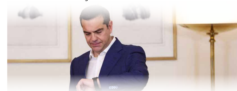
Tsipras: tijd om te gaan?