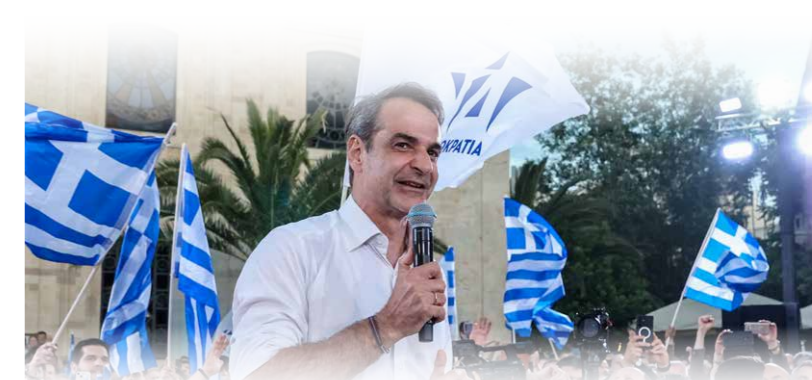
Mitsotakis viert de overwinning

Meest in het oog springend was wellicht wel de terugkeer van extreemrechts in het parlement. Het deed denken aan mei