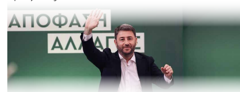
PASOK leeft op met Androulakis

2012, toen de Gouden Dageraad en de Onafhankelijke Grieken (ANEL) hun intrede deden. Drie nieuwe splinterpartijtjes bleken in juni 2023 de kiesdrempel te hebben gehaald en behaalden samen 12% van de stemmen – goed voor 34 van de 300 zetels. De nationalistische en pro-Russische Elliniki Lysi (‘Griekse oplossing’) en de ultraorthodoxe Niki (‘Overwinningspartij’) scoorden vooral goed in het noorden, niet verwonderlijk gezien het feit dat beide hun oorsprong kennen in het (aanhoudende) verzet tegen het Prespes-verdrag uit 2018 dat de naamkwestie met buurland Noord-Macedonië formeel beslechtte.