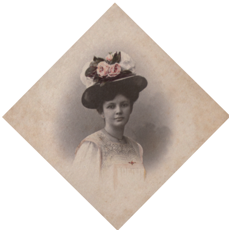
Afb. 2: Een Indo-Europese vrouw

In eerste instantie is deze koloniale ideologie ook in 'Een Indisch kind' en in Het mooiste meisje aan boord te vinden: door de Europese opvoeding van haar grootmoeder worden de Aziatische invloeden bij de lichtgekleurde Indo-Europese Minie uitgewist. Geheel volgens de koloniale normen van die tijd wordt in de novelle Minies moeder naar de achtergrond gedrongen en zorgt Minies vader ervoor dat zij een andere man vindt dan haar eerste geliefde, baron Van der Eyken. In het slot van de roman is die rol weggelegd voor Minies Javaanse moeder.