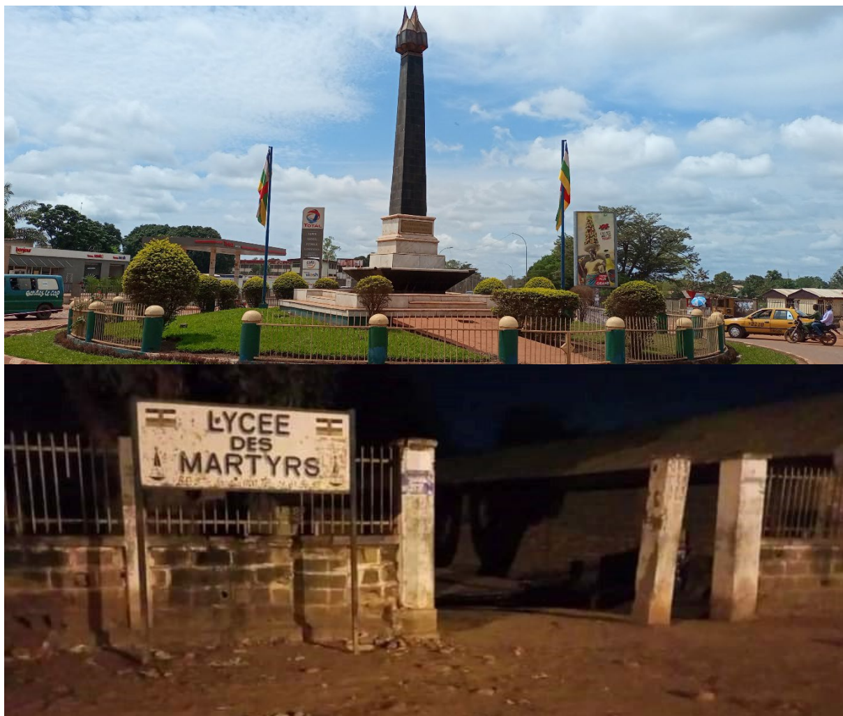
Du haut vers le bas : image 14 : le monument des Martyrs avec en arrière-plan droit le lycée des Martyrs ; image 15 : une vue de l'entrée principale du Lycée des Martyrs sans lumière la nuit. @ : images de l'auteur, Bangui, septembre 2022.

"Lycée des Martyrs". Et le 18 janvier de chaque année est commémorée la mémoire de ces jeunes martyrs sous l'impulsion du Conseil national de la jeunesse centrafricaine : c'est la « journée des martyrs ».