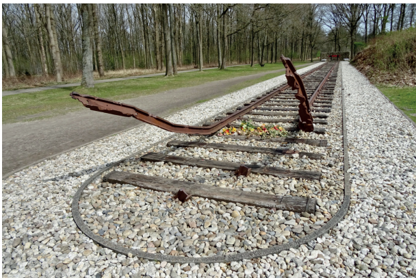
Ralph Prins, Nationaal Monument Westerbork 1970