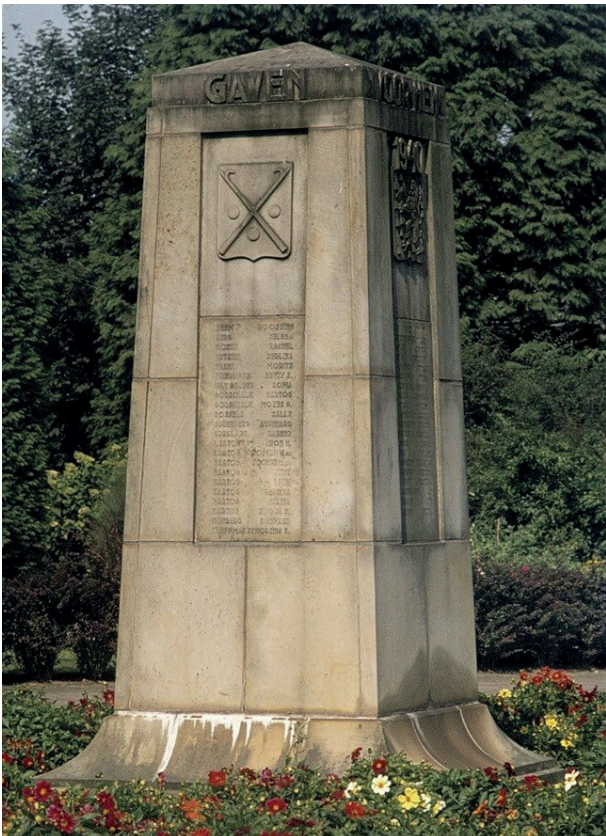
Voor hen die hun leven gaven (1948) Borculo.