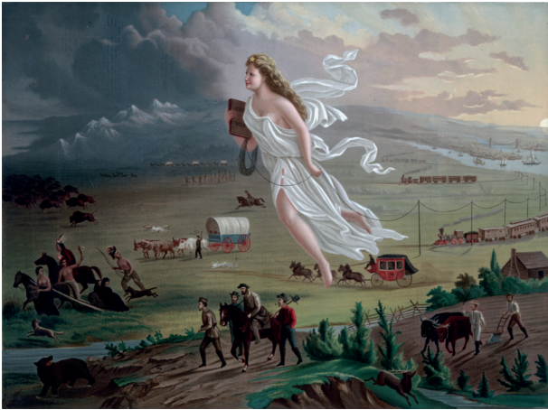
America's Manifest Destiny: American Progress - John Gast 1872

ontwikkeling in de negentiende eeuw, zoals de introductie van ‘vaderlandse geschiedenis’ op scholen en universiteiten, de opbloei van de nationale historieschilderkunst en de historische roman, de oprichting van nationale musea en bibliotheken, en, uiteraard, de oprichting van nationalistische monumenten – ofwel: de vorming van een historische cultuur, gebaseerd op een veronderstelde continuïteit, die voorouders en nakomelingen moreel en politiek samenbond, in de VS, in Frankrijk en, uiteraard, ook in Nederland, zoals blijkt uit de afbeeldingen achter mij.