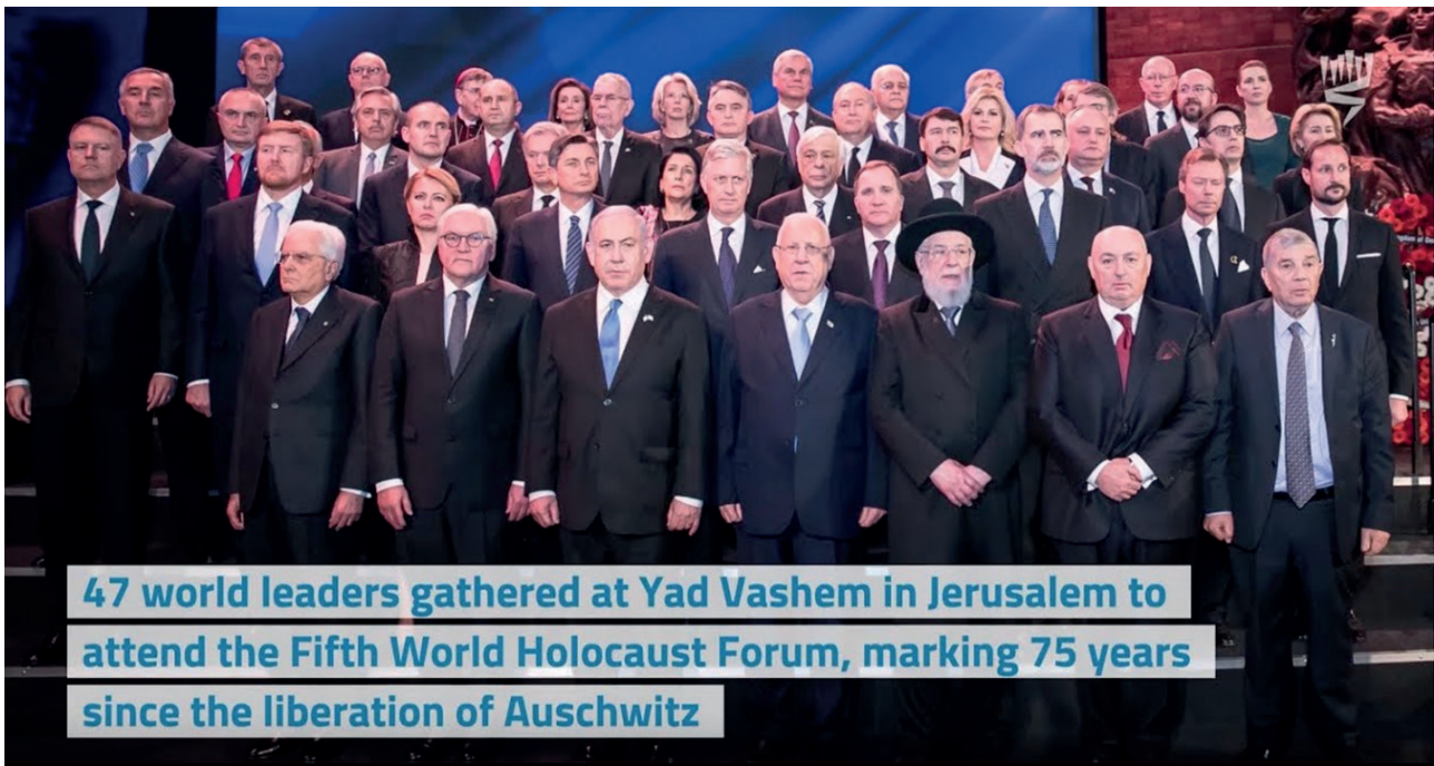
Yad Vashem 23 januari 2020

En die bredere basis komt ook tot uitdrukking in de verbinding die wordt gelegd met andere donkere episoden uit de geschiedenis – de Tweede Wereldoorlog in brede zin, de nazistische vervolging, slavernij en kolonialisme, staatsterreur en andere genocides. De Holocaust staat, kortom, in het hart van een transnationale, zelfs kosmopolitische historische cultuur die draait om de rechten van de mens en de waardigheid van het leven. Het is overigens ook die cultuur waaraan de eerder besproken omschrijving van de Cleveringa-herdenking refereert, met haar nadruk op vrijheid en inclusiviteit.