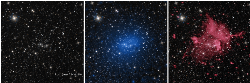
Figuur S.3: De cluster van sterrenstelsels Abell 2256 op drie verschillende golflengtes. Links : alleen de sterrenstelsels zijn zichtbaar in infraroodlicht; Midden : in blauw is de röntgenstraling van het hete gas tussen de sterrenstelsels te zien. Rechts : in rood is de radiostraling te zien, afkomstig van hoog-energetische geladen deeltjes in het gas die om magnetische velden gebogen worden. Infrarood: neoWISE (Meisner et al., 2017), röntgen: XMM-newton (Rajpurohit et al., 2023), radio: LOFAR (Osinga et al., 2023a), beeldoverlap: Frits Sweijen

Hoewel de naam doet vermoeden dat het simpelweg grote groepen van honderden sterrenstelsels zijn, zijn de sterrenstelsels het minst belangrijke deel van de clusters. Clusters bestaan vooral uit een erg heet en ijl gas, dat zich in de ruimte tussen de sterrenstelsels bevindt, in het zogenoemde intra-cluster medium 6 . Dit gas bestaat vooral uit waterstof- en heliumatomen, en omvat meer dan 90% van de massa van een cluster. De temperatuur van het gas is zo hoog (10 miljoen tot 100 miljoen graden Celsius) dat de elektronen loskomen van de atomen (ionisatie). Het gas is dan ook niet meer zichtbaar op golflengtes die ons oog kan zien, maar zendt röntgenstraling uit. Clusters van sterrenstelsels kunnen dus het beste worden gezien als enorme gaswolken (zie Figuur S.3, midden).