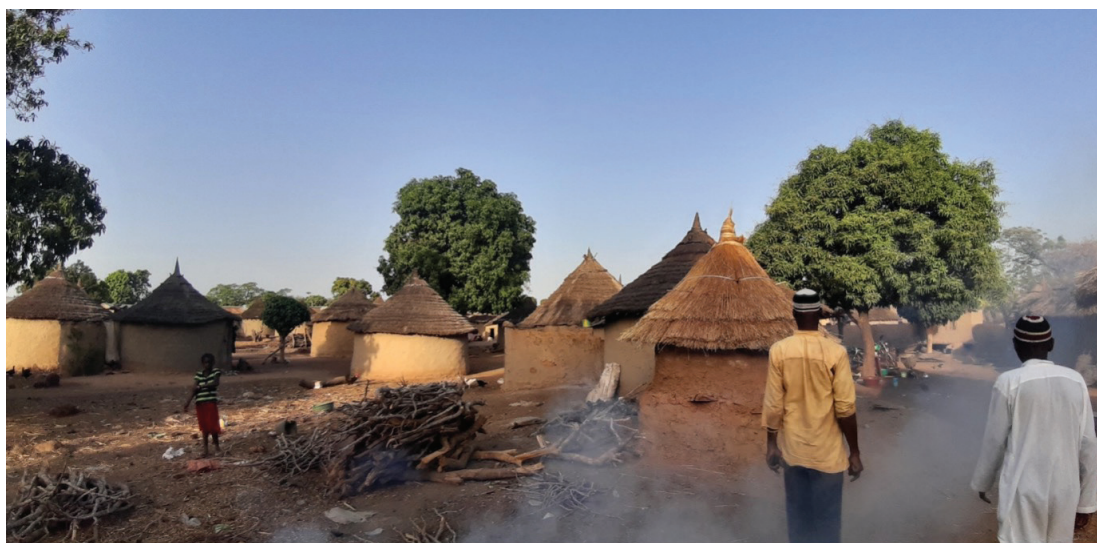
Figure 25: Vue sur le quartier dogon de Koflacè

Ces différentes raisons ont favorisé donc une sorte d'endogamie entre parmi les Dogons du Wassolon durant les premières années de leur arrivée. Les dix familles qui se sont installées dans le village de Koflacè en 1985 ont ainsi formé la colonie dogon de ce village. Chaque famille avait obtenu, par la voie des autorités gouvernementales, trois hectares de terres cultivables et un lieu de résidence dans la partie sud du village. Lorsque l'installation était effective, le chef de village ainsi que le conseil des gwatigi (chef de lignage) ont mis à la disposition des Dogons un espace allant des limites du village de Koflacè jusqu'aux frontières avec les terres du village de Bonounko. Ainsi chaque famille pouvait défricher l'espace qu'elle retenait suffisante pour sa production. Ces terres se trouvaient sur le domaine du chef de village. Avant de défricher, ce dernier était informé et honoré par une dizaine de colas en signe de présentation officielle de demande de terres.