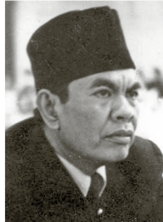
Muhammad Yamin, Namens Gerindra lid van de Nationale Concentratie in de Volksraad, later lid van het comité voor de voorbereiding van onafhankelijkheid en minister in vijf naoorlogse kabinetten van de republiek Indonesië.

In juli 1939 vat Mohammad Yamin (Nationale Concentratie) de bezwaren tegen en de gewenste lading van het begrip indianisatie nog één keer duidelijk samen als hij de ‘ontvoogding’ van de Dienst VolksGezondheid (DVG) bepleit. Die hangt volgens Yamin samen met ‘het groote hervormingswerk, dat thans allerwege op til is. Men kan dit streven noemen indianisatie, emancipatie of anderszins, maar in het belang der zaak, die ik beoog, zal ik al deze woorden angstvallig vermijden; ik gebruik liever het beter klinkende woord ‘ontvoogding’. 175