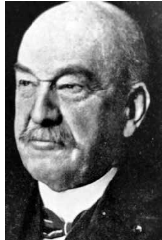
Minister van Koloniën S. De Graaf (1919-1925), www.parlement.com . Later voorzitter Eerste Kamer en nogmaals minister van Koloniën (1929-1933).

Bij de aanvang van de Tweede Volksraad (1921-1924) bleek zowel het politieke als het economische tij gekeerd. Inmiddels zat de conservatieve gouverneur-generaal D. Fock in Buitenzorg met een strikt bezuinigingsprogramma en in Den Haag zat de al even conservatieve minister van Koloniën S. de Graaff die op dit programma had aangedrongen. Ook de nieuwe bezetting van de Volksraad, uitgebreid tot 48 zetels, liet een reactionaire wending zien. Grootse partij was de conservatieve Politiek Economische Bond met vijftien zetels, massaal de raad ingestemd om 'onverantwoordelijke politieke heethoofden' bij te sturen. De liberale NIVD was op zeven zetels blijven steken. Een andere nieuwkomer was het eveneens conservatieve Indo Europees Verbond met twee zetels, terwijl ook de confessionele partijen twee zetels gewonnen hadden. 47