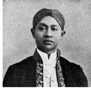
R.A.A. Wiranata Koesoema , uit: Volksraad, Overzicht betreffende het zittingsjaar 1930-1931 . Regent van Bandoeng en voorzitter van de Perhimpoean Pegawai Bestuur Boemiputra PPBB, na de oorlog de eerste minister van buitenlandse zaken van Indonesië (1945-48).

uit Nederland belangrijk verband houdt met de opheffing van het peil van het onderwijs'. 102