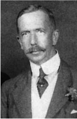
Gouverneur-generaal Van Limburg Stirum (1916-1921), www.parlement.com . Later buitengewoon gezant en gevolmachtigd minister in Caïro, Berlijn en London.