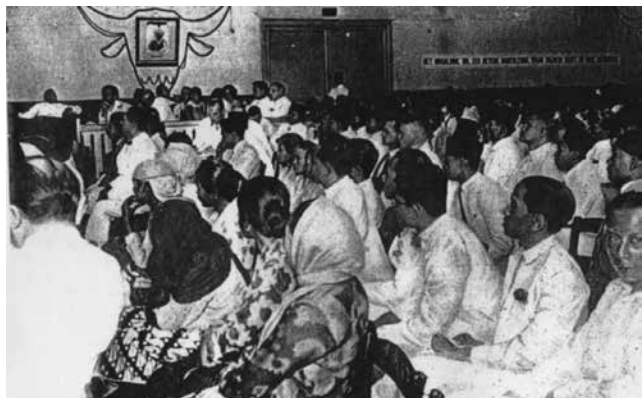
Bijeenkomst van de PNI van Soekarno, begin jaren dertig, www.zenius.net.