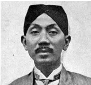
M. Soetardjo, uit: Volksraad, Overzicht betreffende het zittingsjaar 1930-1931 . Patih van Gresik, lid van de PPBB, vanaf 1936 als PPBB-voorzitter bekend van zijn staatkundige petitie.

Na drie zittingsjaren discussie over indianisatie lagen de heikele punten in het 'indianisatievraagstuk' inmiddels op tafel. Hoewel de regering bleef herhalen indianisatie als een natuurlijke en noodzakelijke ontwikkeling te zien, hoogstens door crisisbeleid wat verhaast, was geen van de fracties daarmee overtuigd. De Nationale Fractie zag indianisatie als een te kleine stap in de juiste richting van onafhankelijkheid. Conservatievere Indonesische fracties van de PPBB, Boedi Oetomo en de Indonesiërs uit de buitengewesten wilden nog niet zo ver gaan. Toch waren ze allemaal doordrongen van het belang van een juiste invulling van het brede begrip voor de toekomst. Vandaar de felheid waarmee men het belang van goed westers onderwijs benadrukte. Hoe konden Indonesiërs zonder geschikte scholing op grotere schaal posities gaan overnemen in de samenleving?