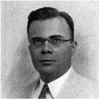
H.J. van Mook, uit: Volksraad, Overzicht betreffende het zittingsjaar 1930-1931. Assistent-resident van de politie in Batavia, minister van Koloniën (1941-1945) en luitenant-gouverneur-generaal (1942-1948).