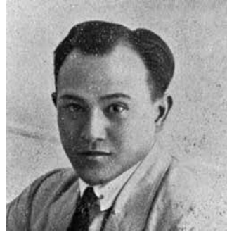
Dr Ratu Langie, arts, uit: Volksraad, Overzicht betreffende het zittingsjaar 1930-1931. Voorzitter van de Perserikatan Minahassa en na de oorlog de eerste gouverneur van Sulawesi voor de republiek Indonesia.