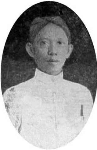
Soewardi Soerjaningrat of Ki Dewantoro, foto 'in zijn jeugd', en.wikipedia.org. Stichter van de Taman Siswa scholen, later kortstondig minister van onderwijs (1945).

Terwijl de protestacties tegen de Wilde Scholen-Ordonnantie gaande waren, groeide ook de kracht van de niet-coöperatieve partijen in Indië. De Partindo van Soekarno telde in augustus 1933 bijna 30.000 leden, de PNI Baroe van Hatta en Sjahrir