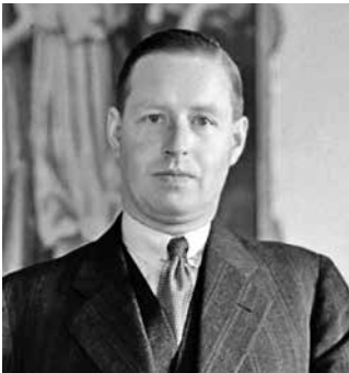
Gouverneur-generaal jhr. A.W.L. Tjarda van Starkenborgh Stachouwer (1936-1942)

Terwijl de non-coöperatieve politieke leiders in ballingschap hun dagen sletten op Flores en in Boven-Digoel, liet de Indonesische coöperatieve beweging een steeds grotere mate van eensgezindheid zien. Vanaf 1935 verenigde gematigde nationalistenvan Boedi Oetomo en Soetomo's PBI zich in Parindra, terwijl de sociaaldemocratische nationalistenvan zich in 1937 in Gerindra verenigden. Een islamitische coöperatieve partij ontstond een jaar later. De groei van de coöperatieve beweging vond inspiratie in politieke ontwikkelingen elders in Azië. De Filipijnen kregen in 1934 de status van gemenebest, na een overgangsperiode van tien jaar zou onafhankelijkheid volgen. In 1935 was in India de government of India Act aangenomen waarin een federatief India met een grote mate van zelfbestuur voor de provincies was ingesteld. Bij de Indonesische nationalistenvan groeide de hoop dat het Nederlandse gouvernement onder leiding van een nieuwe gouverneur-generaal bereid