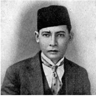
M.H. Thamrin, Leider van de Nationale Fractie in de Volksraad.